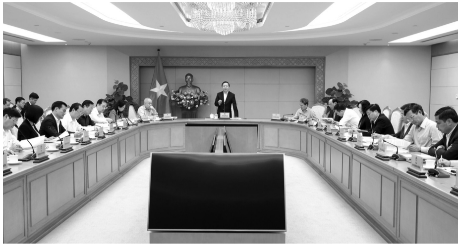
● Quang cảnh cuộc họp.