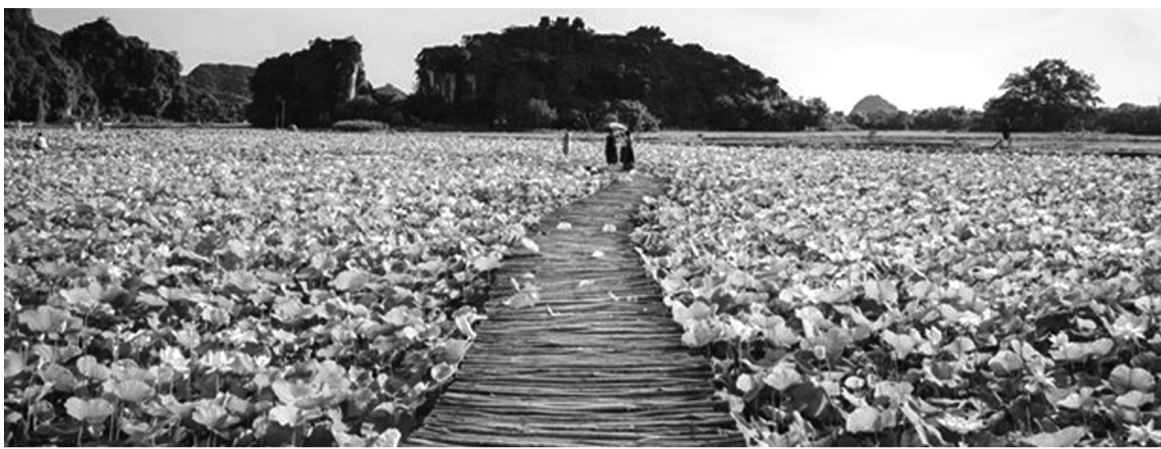
● Hồ sen hang Múa (Ninh Bình) là một trong những điểm đến yêu thích của nhiều du khách.

các quốc gia trong khu vực như Lào, Thái Lan theo tuyến hành lang kinh tế Đông - Tây.