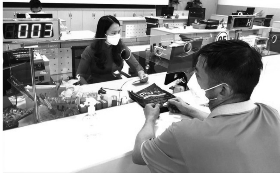
● Doanh nghiệp phản ánh vẫn khó tiếp cận tín dụng. (Ảnh minh họa)

Kết quả khảo sát PCI 2022 cũng cho thấy, trở ngại lớn nhất là việc "DN không