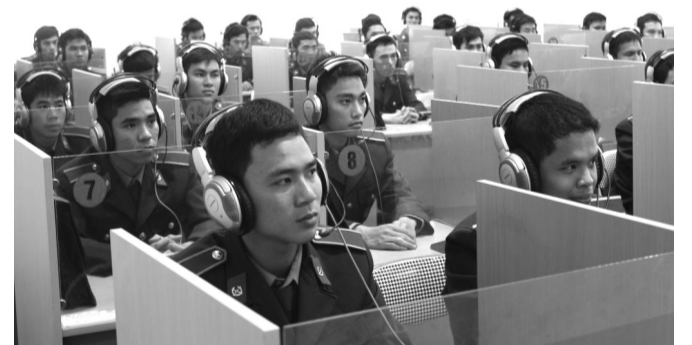
● Một lớp học tại Học viện Biên phòng.