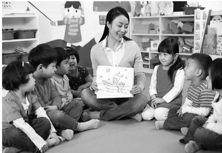
● Ảnh minh họa.

Ngoài ra, Thông tư 07/2023/TT-BGDĐT cũng nêu rõ liên kết đào tạo ngành Giáo dục Mầm non trình độ cao đẳng