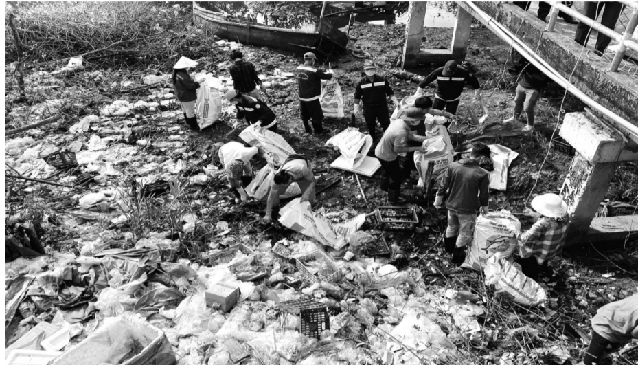
● Đụn rác nhựa đã trở thành hoạt động thường xuyên của nhiều người dân Phú Quốc khi ô nhiễm nhựa gia tăng.

Bà Nguyễn Thị Ngọc Ánh, Viện Chiến lược, Chính sách tài nguyên và Môi trường (ISPONRE), Bộ Tài nguyên và Môi trường, cho biết ước tính trong du lịch, trung bình mỗi khách du lịch thải ra môi trường từ 5 - 10 túi ni lông/ngày; 2 - 4 vỏ chai nhựa, hộp sữa/ngày, chưa kể đến các sản phẩm, vật dụng cá nhân làm bằng nhựa dùng 1 lần. Lượng chất thải nhựa và túi ni lông của cả nước chiếm khoảng 10 - 12% chất thải rắn sinh hoạt, đặc biệt một số thành phố có hoạt động du lịch phát triển.