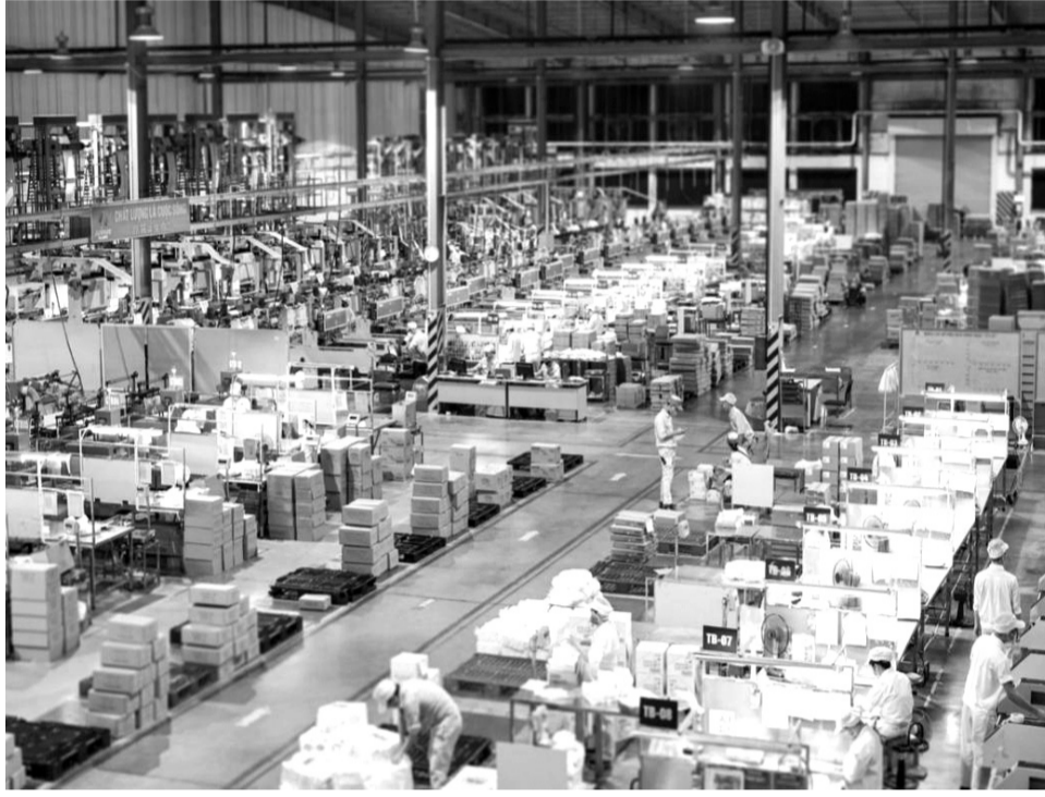
● DN cần chủ động tham gia lộ trình chuyển đổi xanh. (Ảnh minh họa)

Đáng chú ý, ông Công thông tin: “Chúng tôi sẽ thoái vốn khi nhận được bằng chứng về những vi phạm nghiêm trọng liên quan đến ESG hoặc DN không thực hiện quản trị các rủi ro liên quan đến ESG đã được xác định vì các