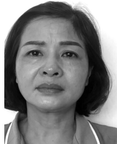
● Một số đối tượng trong vụ án.