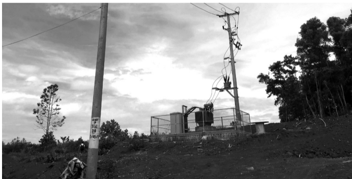
● Trạm biến áp được xây dựng để đấu nối, hòa lưới bán điện.

Ngày 25/11/2020, UBND xã phát hiện Mỹ Tân An đã tự ý sử dụng máy móc thi công san ủi làm biến đổi hiện trạng sử dụng đất tại đồi Trà Quân với