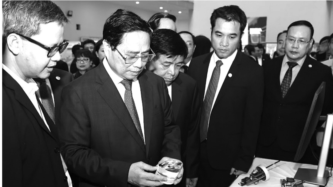
● Thủ tướng tham quan gian trưng bày sản phẩm vi mạch do sinh viên Viện Công nghệ thông tin ĐHQG Hà Nội nghiên cứu, chế tạo.

Thủ tướng lưu ý cần quan tâm đào tạo nhân lực trong cả 3 lĩnh vực bao gồm nghiên cứu cơ bản, quản lý và ứng dụng, nhất là các ngành mũi nhọn, các xu thế phát triển mới để có thể "đi sau, về trước" như chuyên đổi số, chuyên đổi xanh, kinh tế tri thức, đổi mới sáng tạo, kinh tế tuần hoàn, ứng phó biến đổi khí hậu, trên cơ sở bám sát chủ trương, đường lối, chính sách, pháp luật của Đảng, Nhà nước, phù hợp với điều kiện, hoàn cảnh đất nước và tiềm năng khác biệt, cơ hội nổi trội, lợi thế cạnh tranh của Việt Nam. Nhân mạnh đào tạo nguồn nhân lực để thu hút đầu tư, chuyển giao công nghệ, thích ứng với điều kiện, hoàn cảnh đất nước, thực hiện các mục tiêu, khát vọng phát triển đất nước tới năm 2030, năm 2045, Thủ tướng nêu rõ, đào tạo nhân lực vừa có tính chất bao trùm, phổ cập, toàn