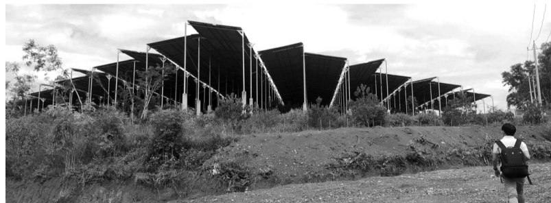
● HTX Mỹ Tân An cho DN thuê đất làm điện năng lượng mặt trời trên đất Trà Quân.