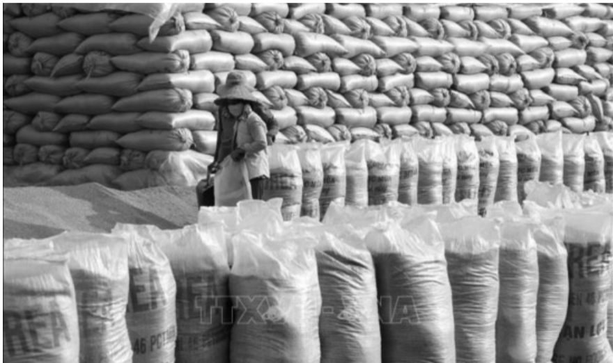
● Định mức chi phí bảo quản hàng dự trữ quốc gia do Tổng cục Dự trữ Nhà nước trực tiếp quản lý.

Bộ Tài Chính vừa ban hành Thông tư 21/2024/TT-BTC quy định về định mức chi phí bảo quản hàng dự trữ quốc gia do Tổng cục Dự trữ Nhà nước trực tiếp quản lý. Thông tư 21/2024/TT-BTC có hiệu lực từ ngày 15/5/2024.