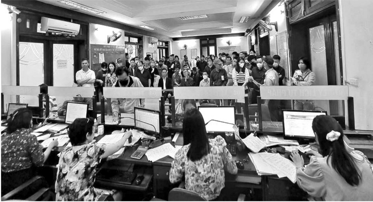
● Có những thời điểm, người dân đến làm thủ tục xin cấp Phiếu LLTP ở Hà Nội tăng đột biến.

Bộ Tư pháp đang xây dựng dự thảo Nghị quyết của Quốc hội thí điểm giao một số Phòng Tư pháp thuộc Ủy ban nhân dân cấp huyện tại Thành phố Hà Nội, Thành phố Hồ Chí Minh và tỉnh Nghệ An thực hiện cấp Phiếu lý lịch tư pháp (LLTP). Vấn đề được nhiều người quan tâm là nguồn lực cho việc thực hiện thí điểm tại các địa phương nói trên.