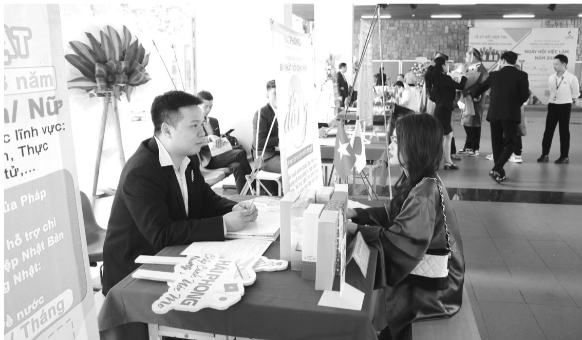
● Một sự kiện tư vấn, tuyển dụng lao động tại Thừa Thiên - Huế.

UBND tỉnh đã ban hành nhiều chương trình, nghị quyết về nâng cao chất lượng nguồn nhân lực, nổi bật trong đó là Nghị quyết 17 ngày 13/5/2022 về phát triển nguồn nhân lực,