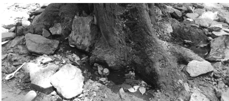
● Hình ảnh gốc cây sao đen trước nhà số 71 Lò Đúc bị đổ dung dịch màu xanh năm 2019, sau đó cây này bị chết.

UBND TP Hà Nội giao Công an TP kiểm tra, làm rõ nguyên nhân cây sao đen chết khô trước các công trình mới xây dựng trên phố Lò Đúc; Chánh Văn phòng UBND