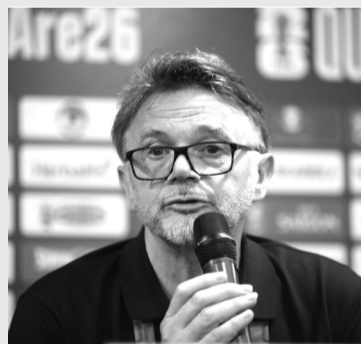
● HLV Philippe Troussier ra đi sau thất bại trước Indonesia là 2 trận lượt đi và về tại vòng loại World Cup 2026.

Giải V.League được coi là nền móng của bóng đá nước nhà, nơi lựa chọn các cầu thủ cho đội tuyển quốc gia thì càng ngày chất lượng trận đấu càng đi xuống, tiêu cực “nhân nhân”. Giải đấu không còn hấp dẫn cổ động viên. Các CLB Việt Nam yếu ớt và mong manh khi ra đấu trường quốc tế. Cầu thủ Việt Nam ra nước ngoài vì hợp đồng thương mại nhiều hơn là thi đấu. Có thể vì trình độ cầu thủ ở