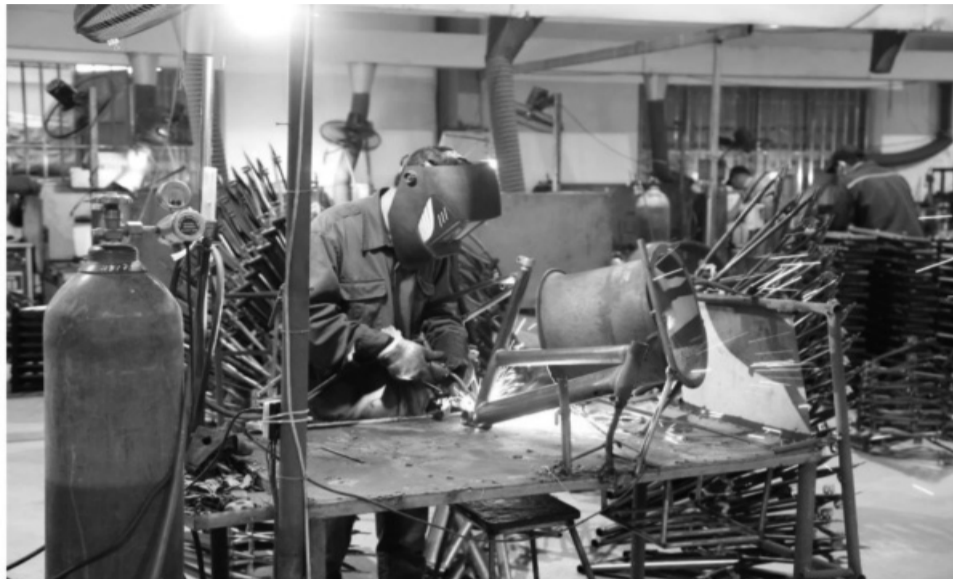
● Công tác an toàn, vệ sinh lao động vẫn còn một số tồn tại.

Qua sự việc trên có thể thấy còn nhiều tổ chức, cá nhân sử dụng lao động chưa tuân thủ đầy đủ các quy định của pháp luật về an toàn, vệ sinh lao động, chăm sóc sức