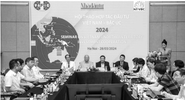
●Hội thảo "Hợp tác Đầu tư Việt Nam - Bắc Úc".