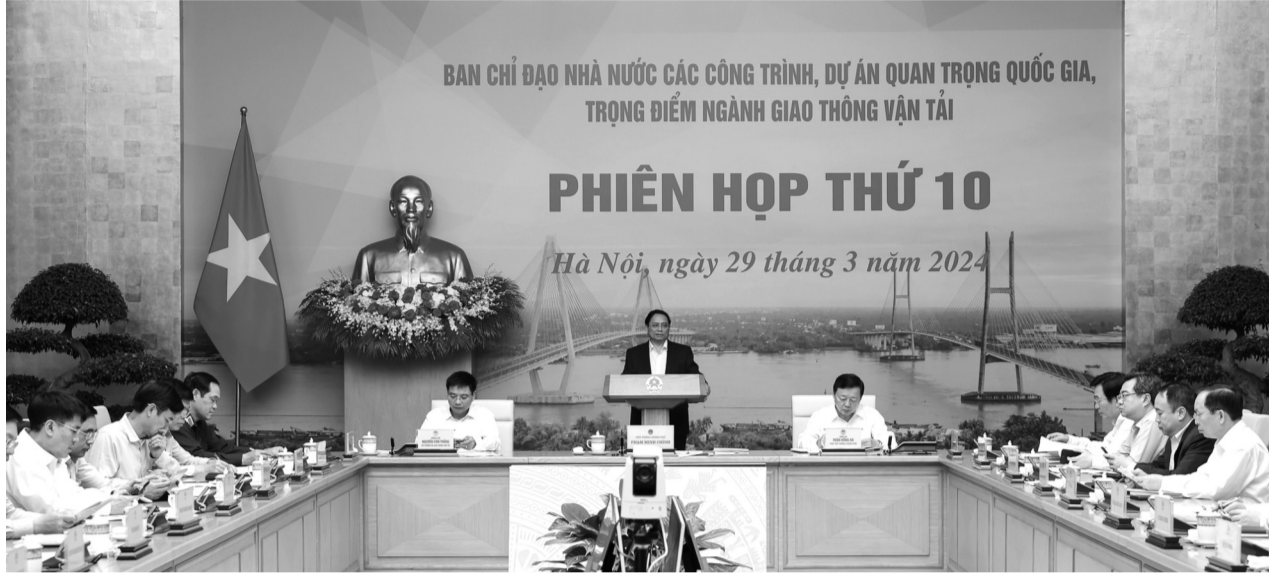
● Quang cảnh phiên họp.

Ngày 29/3, Thủ tướng Chính phủ Phạm Minh Chính, Trưởng Ban Chỉ đạo Nhà nước các công trình, dự án quan trọng quốc gia, trọng điểm ngành Giao thông vận tải (Ban Chỉ đạo) chủ trì họp Phiên thứ 10 của Ban Chỉ đạo.