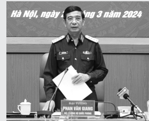
● Đại tướng Phan Văn Giang phát biểu chỉ đạo Hội nghị.

Sáng qua (29/3), Hội nghị giao ban Bộ Quốc phòng (BQP) tháng 3/2024 được tổ chức dưới sự chủ trì của Đại tướng Phan Văn Giang, Ủy viên Bộ Chính trị, Bộ trưởng BQP.