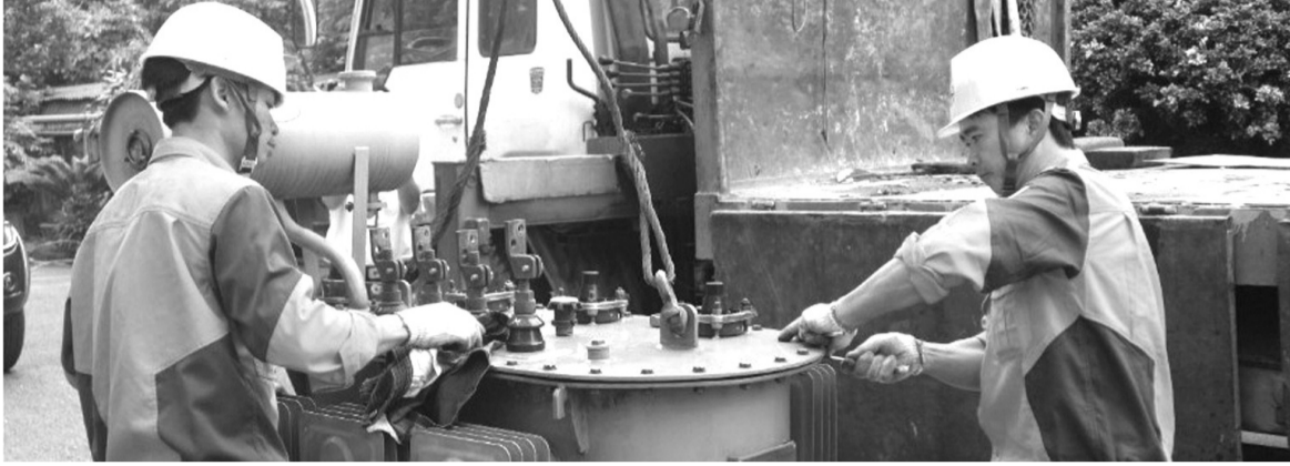
●Người lao động EVN duy trì môi trường làm việc xanh, sạch.