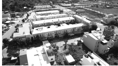
● Tại Khu ĐC Phú An, sau khi bán một số căn nhà cho một số người, Phúc Thanh Vinh lại tự ý đơn phương bán lại các căn nhà đó cho những người khác.