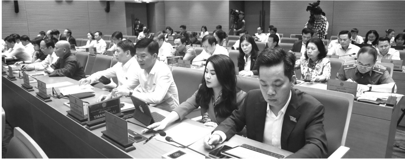
● Các đại biểu bấm nút biểu quyết thông qua Quy hoạch.

Sáng 29/3, tại Kỳ họp thứ 15, với đa số đại biểu có mặt tán thành, HĐND TP Hà Nội đã thông qua Nghị quyết về Quy hoạch Thủ đô Hà Nội thời kỳ 2021 - 2030, tầm nhìn đến năm 2050 (Quy hoạch). Quy hoạch xác định cấu trúc không gian phát triển của Thủ đô gồm 5 không gian phát triển, 5 hành lang và vành đai kinh tế, 5 trục động lực, 5 vùng kinh tế - xã hội, 5 vùng đô thị.