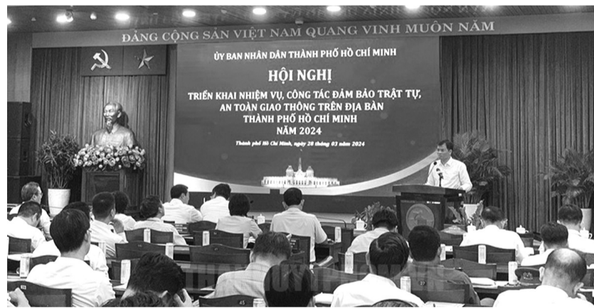
● Hội nghị triển khai nhiệm vụ, công tác bảo đảm trật tự, an toàn giao thông trên địa bàn TP HCM năm 2024.

rượu, bia, không vi phạm liên quan đến chất kích thích, không can thiệp vào các vụ việc xử lý vi phạm về trật tự, an toàn giao thông của lực lượng chức năng. Lãnh đạo UBND TP yêu cầu CSGT tiếp tục tăng cường xử lý vi phạm liên quan đến nồng độ.