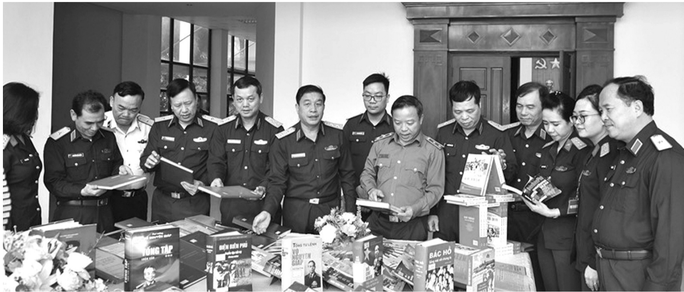
● Các đại biểu tham quan gian trưng bày sách về chiến dịch Điện Biên Phủ bên lễ Hội thảo.

Chiến thắng Điện Biên Phủ (ĐBP) là đỉnh cao của nghệ thuật quân sự Việt Nam trong kháng chiến chống Pháp, thể hiện trên cả 3 lĩnh vực: Chỉ đạo chiến lược, nghệ thuật chiến dịch và chiến thuật; đặc điểm nổi bật là sự chủ động, sáng tạo, đánh theo cách đánh mà ta lựa chọn, buộc địch phải bị động đối phó, hạn chế chỗ mạnh của địch về quân số, hỏa lực mạnh, sức cơ động cao. Chiến thắng đã để lại nhiều bài học kinh nghiệm quý báu và vận dụng sáng tạo, hiệu quả trong sự nghiệp xây dựng và bảo vệ Tổ quốc (BVTQ).