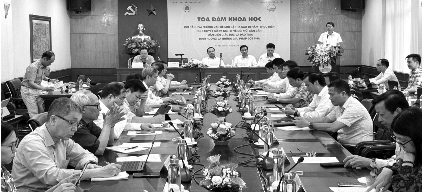
● Toàn cảnh buổi Tọa đàm.