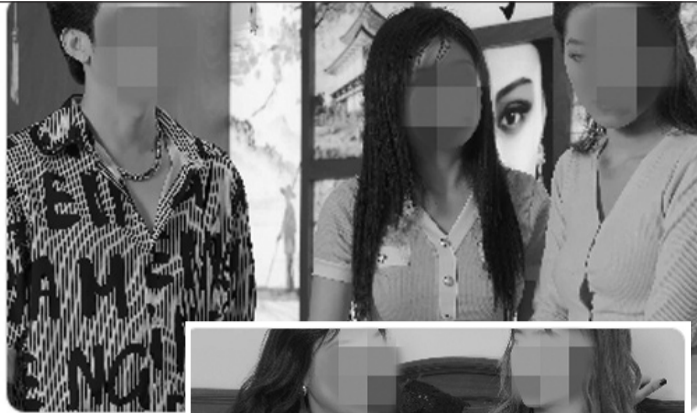
Trốn thoát... bị bảo kê r... 43 tuần trước · 111K lượt xem