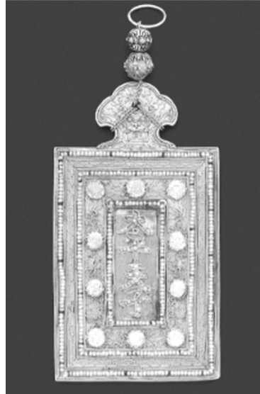
● Kim bài đính ngọc trai của Vua Khải Định.