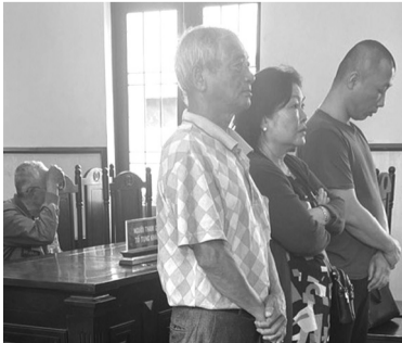
● Các bị cáo tại phiên tòa ngày 2/4/2024.