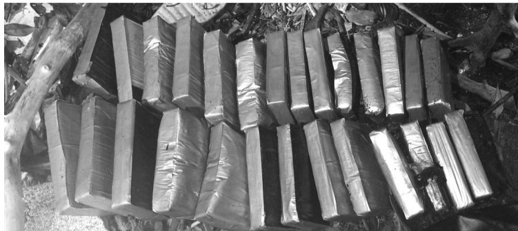
● Các gói chứa ma túy trôi dạt vào bờ biển Gò Công, tỉnh Tiền Giang.