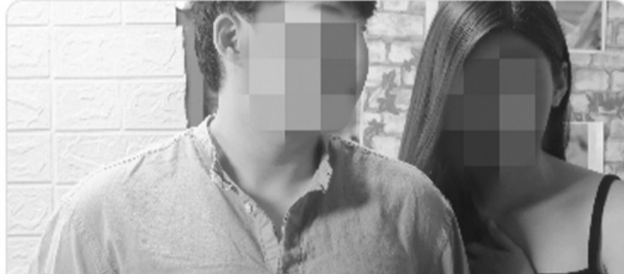
● Một trang mạng sản xuất nhiều phim ngắn có nội dung phản cảm. (Ảnh chụp màn hình)

Đề “câu view”, nhiều cá nhân và trang mạng đã sản xuất những phim ngắn có nội dung đi ngược thuần phong mỹ tục, gây bức xúc trong cộng đồng.