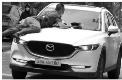
● Hình ảnh một vụ tai xế chống người thi hành công vụ xảy ra tại Hà Nội.

vào làn kiểm tra nồng độ cồn thì tài xế quay đầu xe bỏ chạy.