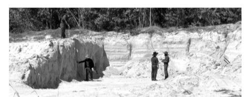
● Công an kiểm tra hiện trạng khu vực bị Chính tổ chức khai thác cát trái phép.

Nội dung nữa là việc truy nã bị cáo Hà. Theo hồ sơ, bị cáo Hà bị bắt theo lệnh truy nã vào ngày 1/3/2023. Tại các phiên tòa, bị cáo Hà đều khai không biết bản thân bị truy nã, trong thời gian này 3 lần lên UBND phường Minh Khai (quận Hai Bà Trưng, TP Hà Nội) xin xác nhận tình trạng hôn nhân để thực hiện giao dịch mua bán đất nhưng không hề được thông báo.