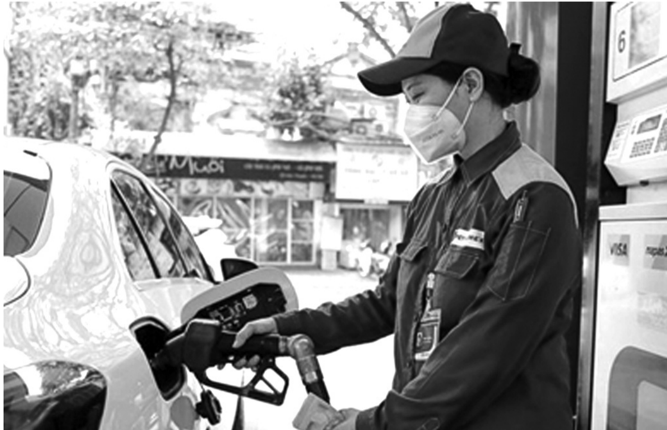
● Quy định về giá bán xăng dầu vẫn chưa có độ mở cần thiết.

Chỉ trong vòng 1 tuần, Bộ Công Thương đã đưa 2 dự thảo Nghị định về kinh doanh xăng dầu, thay thế cho tất cả các nghị định hiện hành về kinh doanh xăng dầu. Trong đó, đáng chú ý, ở dự thảo lần 2, Bộ Công Thương đã đề xuất quy định để doanh nghiệp (DN) đầu mỗi công bố giá bán.