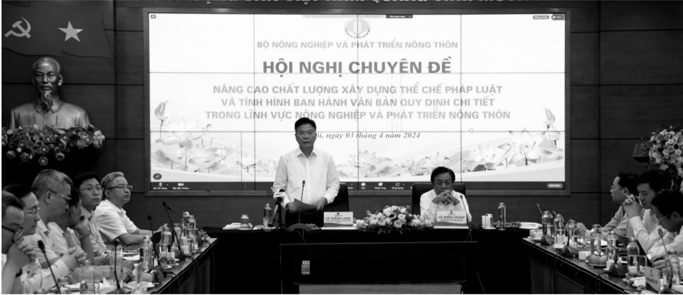
● Bộ trưởng Lê Thành Long phát biểu tại buổi làm việc.

Chiều 3/4, Bộ Tư pháp, Bộ Nông nghiệp và Phát triển nông thôn (NN&PTNT) đã tổ chức Hội nghị chuyên đề nâng cao chất lượng xây dựng thể chế pháp luật và tính hình ban hành văn bản quy định chi tiết trong lĩnh vực NN&PTNT. Hội nghị do Ủy viên Ban Chấp hành Trung ương Đảng, Bộ trưởng Bộ Tư pháp Lê Thành Long, Bộ trưởng Bộ NN&PTNT Lê Minh Hoan chủ trì.