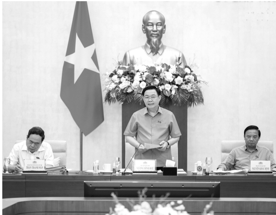
● Chủ tịch Quốc hội Vương Đình Huệ phát biểu tại cuộc họp giao ban.

Cho rằng dự kiến khối lượng công tác quý II/2024 là rất lớn, Chủ tịch QH đề nghị các cơ quan với tinh thần cầu thị, góp ý thẳng thắn nhìn nhận những kết quả đạt được, tính chuyên nghiệp hiệu quả của từng công việc cụ thể, bài học kinh nghiệm, giải pháp để nâng cao hiệu