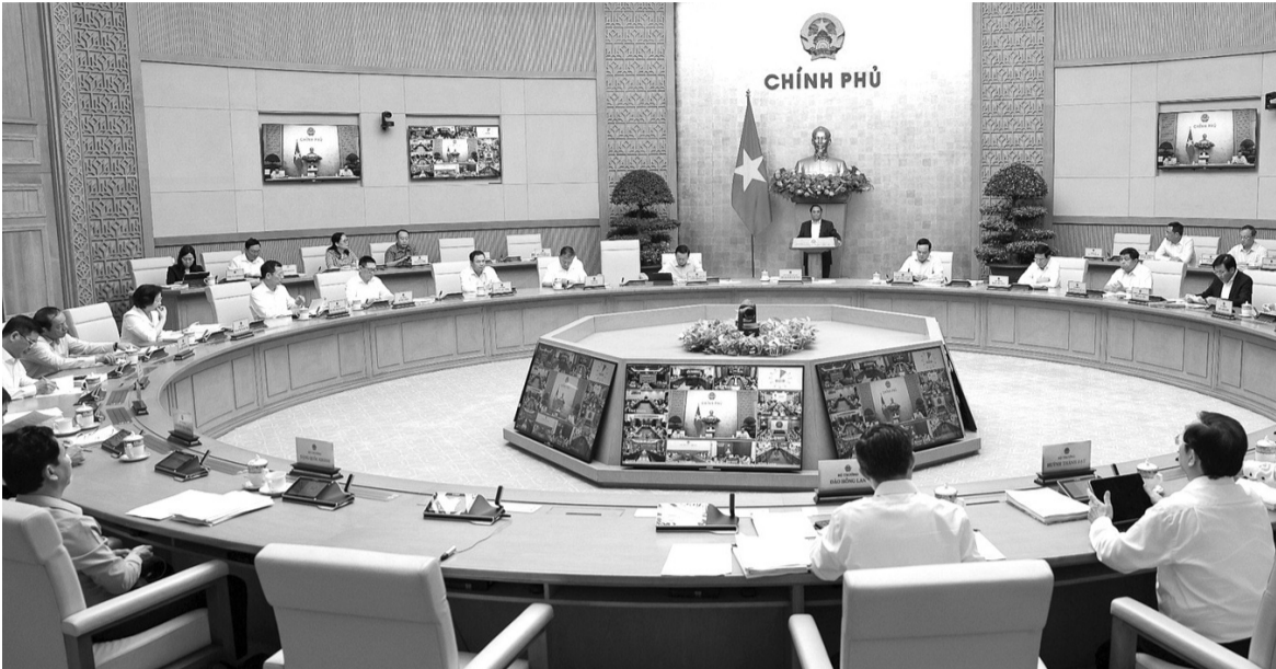
● Quang cảnh phiên họp.

nghiệm; quán triệt quan điểm chỉ đạo, điều hành, Thủ tướng yêu cầu các Bộ, ngành, địa phương kiên quyết không lùi bước trước khó khăn, giữ vững bản lĩnh, kiên định mục tiêu đề ra với quyết tâm cao hơn, nỗ lực lớn hơn, hành động quyết liệt, hiệu quả hơn. Phát huy tinh thần đoàn kết, tự lực, tự cường, coi khó khăn, thách thức là động lực phấn đấu vươn lên. Tập trung tháo gỡ khó khăn, thúc đẩy sản xuất kinh doanh, tạo công ăn việc làm, sinh kế cho người dân.