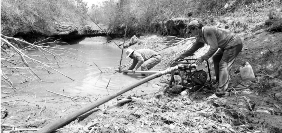
● Nông dân Bình Phước tận dụng nguồn nước từ các con suối để tưới cho cây trồng.

Cục Trồng trọt (Bộ NN&PTNT) vừa ban hành Công văn 449 gửi các Sở NN&PTNT các tỉnh, thành thuộc khu vực Trung Bộ, Tây Nguyên và Nam Bộ, đề nghị bám sát tình hình thực tế hạn mặn, triển khai một số nhiệm vụ cấp bách, cụ thể để ứng phó diễn biến hạn hán, giảm thiểu thiệt hại tới lĩnh vực trồng trọt.