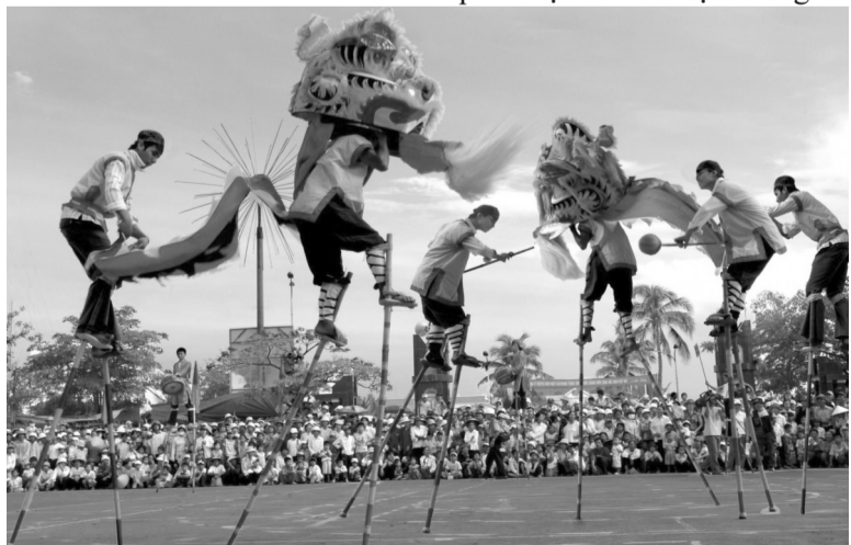
● Đi cà kheo múa sư tử - một trò chơi dân gian ở huyện Hải Hậu, Nam Định.