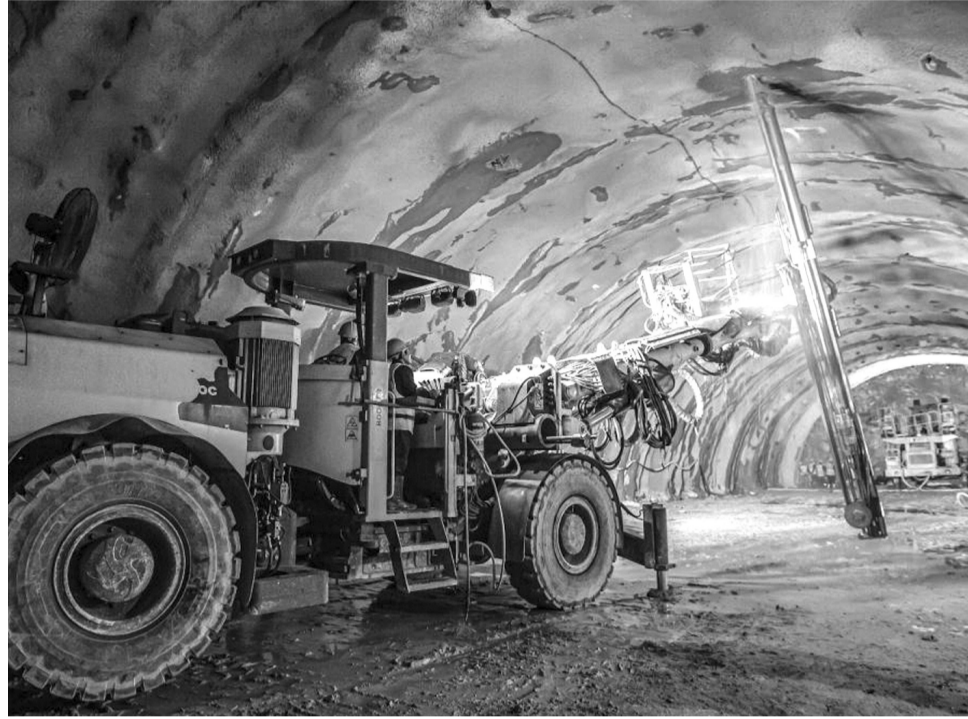
● Thi công hầm tại cao tốc Quảng Ngãi - Hoài Nhơn.

Một số nguyên nhân chính trong vướng mắc GPMB là do nhà ở của một số hộ dân chưa thể di dời (chờ các khu tái định cư hoàn thành); một số hộ dân đã thống nhất tiền đền bù nhưng vẫn còn khiếu nại, cần thời gian giải quyết; một số hộ dân chưa đồng thuận với phương án bồi thường, cần thủ tục để cưỡng chế thu hồi đất. “Ngoài ra, một