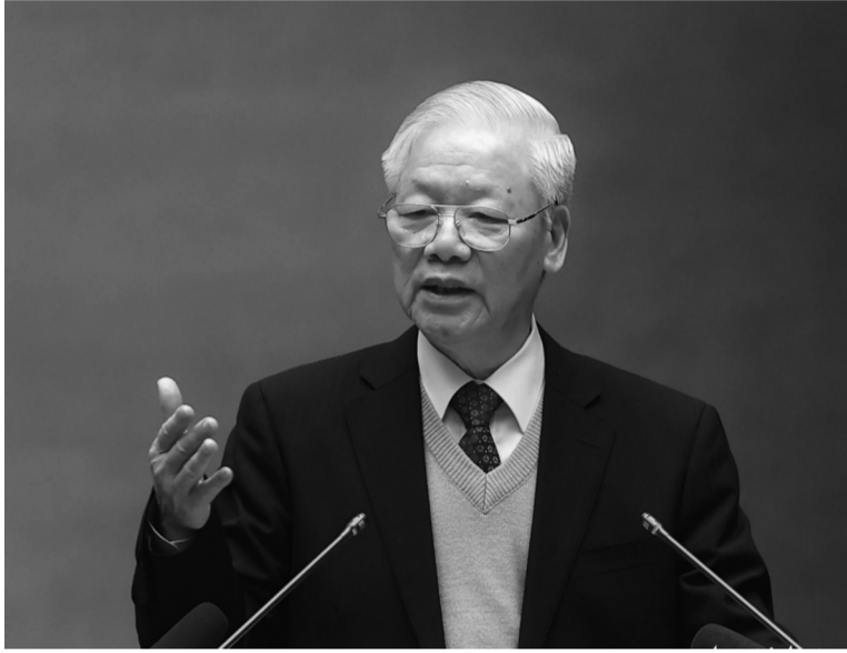
● Tổng Bí thư Nguyễn Phú Trọng phát biểu chỉ đạo Hội nghị Văn hóa toàn quốc, triển khai thực hiện nghị quyết Đại hội đại biểu toàn quốc lần thứ XIII của Đảng.

Các nhà nghiên cứu đúc rút rằng, lịch sử hàng ngàn năm dựng