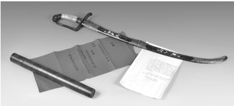
● Thanh kiếm đấu hổ của Vua Hàm Nghi.

Thanh kiếm dài 97,5cm, lưỡi kiếm dài 70cm, chuôi kiếm làm bằng bạc có chạm khắc hình đầu hổ. Phần tay nắm ở chuôi kiếm làm bằng ngà voi có chạm khắc họa tiết hoa lá tinh xảo. Bao kiếm làm bằng gỗ, được khảm ốc xà cừ. Phần chuôi vỏ kiếm bịt bạc và được chạm khắc hình rồng. Thanh kiếm này được đấu giá kèm theo một tờ giấy đồ trang trí rồng vờn mây, bỏ trong một hộp tre. Bút tích trên tờ giấy được cho là của Vua Hàm Nghi. Giá khởi điểm của thanh kiếm này là 3 nghìn đến 3 nghìn rưỡi Euro (thời