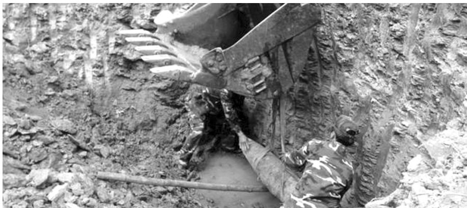
●Hiện trường một vụ xử lý bom.

Bên cạnh đó, công tác tổ chức giải quyết chính sách, chăm sóc sức khỏe nạn nhân bom mìn và bị phơi nhiễm chất độc hóa học/dioxin tiếp tục được triển khai thực hiện, đạt những kết quả nổi bật. Công tác tuyên truyền, hợp tác quốc tế, vận động tài trợ, nghiên cứu khoa học và phát triển công nghiệp tiếp tục được tổ chức tốt, tạo sự chuyển biến tích cực.