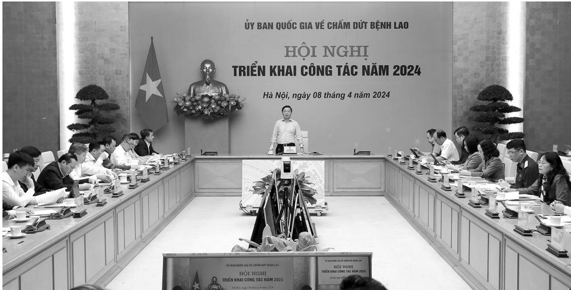
● Phó Thủ tướng đề nghị các cơ quan báo chí, truyền thông tăng cường tuyên truyền, nâng cao nhận thức của người dân về bệnh lao, chủ động khám sàng lọc, phòng ngừa.

Hiện nay, Chương trình Chống lao quốc gia Việt Nam đang triển khai các can thiệp