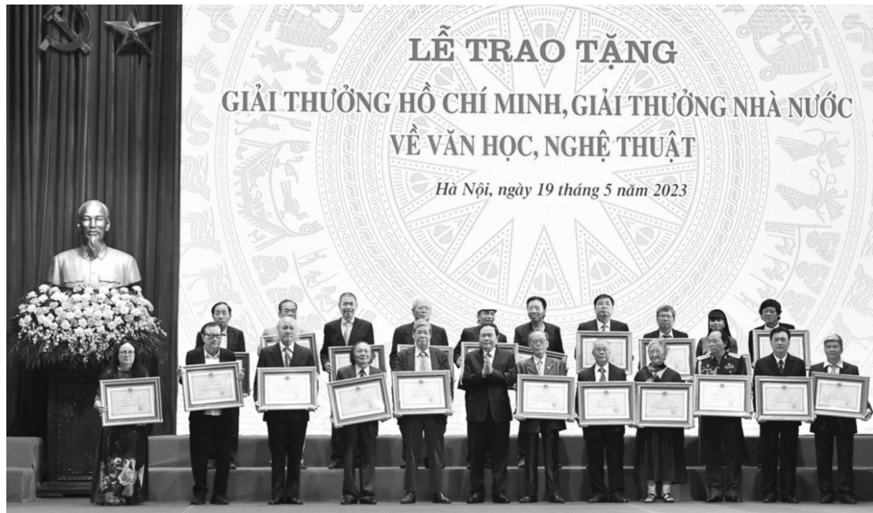
● Quang cảnh lễ trao tặng “Giải thưởng Hồ Chí Minh”, “Giải thưởng Nhà nước” về văn học, nghệ thuật năm 2023.

Tác phẩm, công trình về văn học, nghệ thuật xét tặng “Giải thưởng Hồ Chí Minh”, “Giải thưởng Nhà nước” về văn học, nghệ thuật phải đáp ứng các điều kiện sau đây: Đã được công bố, sử dụng dưới các hình thức xuất bản, kiến trúc, triển lãm, sân khấu, điện ảnh, phát thanh, truyền hình, giảng dạy, đĩa hát kể từ ngày 2/9/1945. Thời gian tác phẩm, công trình về văn học, nghệ thuật được công bố, sử dụng tối thiểu là 5 năm đối với “Giải thưởng Hồ Chí Minh” và 3 năm đối với “Giải thưởng Nhà nước” tính đến thời điểm nộp hồ sơ đề nghị xét tặng “Giải thưởng Hồ Chí Minh” hoặc “Giải thưởng Nhà nước” về văn học, nghệ thuật