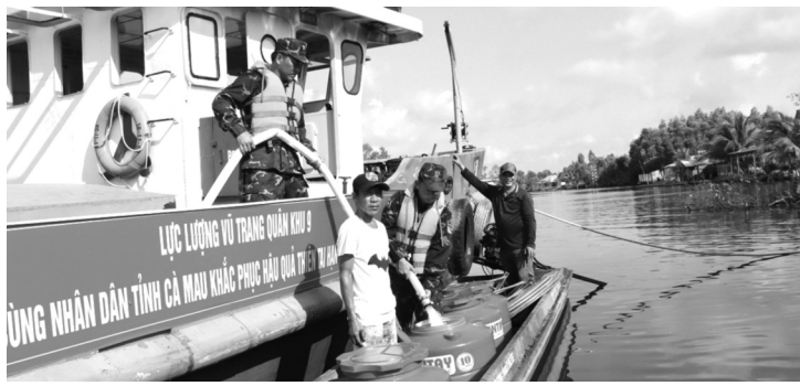
● Tàu chở nước ngọt của Quân khu 9 đến xã Biền Bạch (huyện Thới Bình) để cung cấp nước cho người dân.