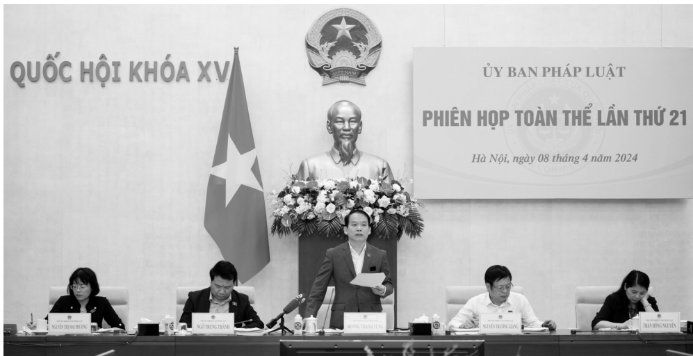
● Chủ nhiệm Ủy ban Pháp luật Hoàng Thanh Tùng chủ trì phiên họp.

Đồng thời, đề nghị Chương trình phải bảo đảm tính khả thi, tránh dồn nhiều dự án vào năm 2024; coi trọng chất lượng, không chạy theo số lượng, không đưa vào Chương trình những dự án thiếu hồ sơ hoặc chưa đáp ứng yêu cầu về chất lượng. Năm 2025 là năm cuối nhiệm kỳ, do đó, việc xây dựng Chương trình cần bảo đảm các dự án được xem xét, cho ý