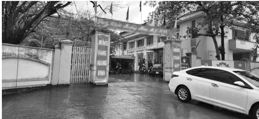
● Trụ sở UBND xã Thanh An.