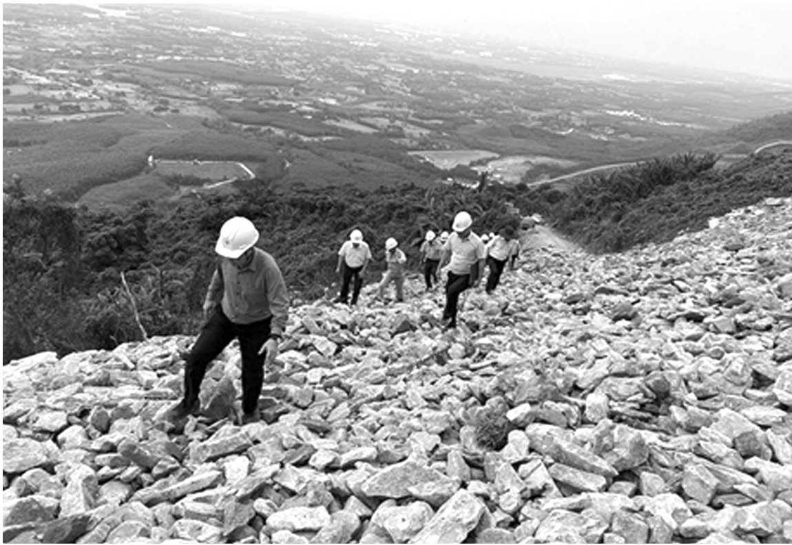
● Đường thi công vị trí một số móng cột ở Hà Tĩnh.

Đại diện các đơn vị thi công cho biết, đến thời điểm này, các đơn vị đã huy động và tăng cường nhân lực máy móc, thiết bị để tập trung thi công. Nhiều vị trí móng đã được đơn vị hoàn thành, trừ những vị trí móng đặc thù là những vị trí gặp nhiều khó khăn trong việc làm đường tạm vào thi công cũng như thi công trên núi đá nên mất nhiều thời gian hơn. Tuy nhiên, với nguồn nhân lực, máy móc đang được dồn về những vị trí này, các đơn vị thi công đều cam kết bảo đảm mục tiêu hoàn thành các vị trí móng theo chỉ đạo của Thủ tướng Chính phủ và chủ đầu tư.