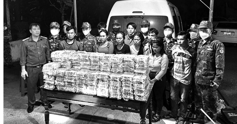
● Bộ đội Biên phòng tỉnh Quảng Trị chủ trì phối hợp Công an, Hải quan tỉnh triệt phá chuyên án ma túy xuyên quốc gia, thu giữ 100kg ma túy tổng hợp.

Chuyên án đấu tranh triệt xóa đường dây tội phạm có số lượng ma