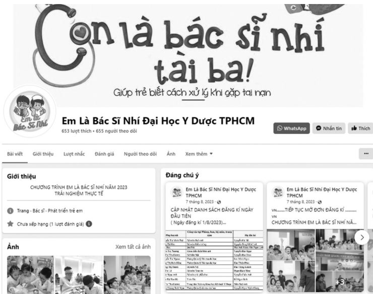
Một trang mạng giả danh Đại học Y Dược TP Hồ Chí Minh chiêu sinh trại hè. (Ảnh chụp màn hình)

Học viện Hàng không Việt Nam cũng mới phát cảnh báo về tình trạng hàng loạt Fanpage giả mạo Học viện Hàng không Việt Nam quảng cáo khóa học trải nghiệm hàng không hè cho học sinh.