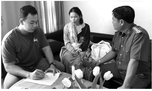
● Công an lấy lời khai đối tượng V.

Ngày 8/4, Công an phường Bến Nghé (quận 1, TP HCM) cho biết đã giải cứu thành công 2 bé gái mất tích tại phố đi bộ Nguyễn Huệ sau 42 tiếng truy xét khẩn trương.