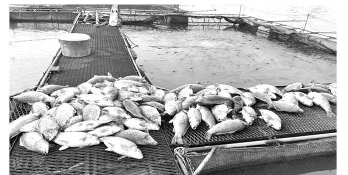
● Cá lồng chết nhiều ở xã Tiên Tiến, TP Hải Dương.

Trước hiện tượng cá lồng chết bất thường trong gần 1 tuần qua trên địa bàn, Chủ tịch UBND tỉnh Hải Dương vừa có văn bản chỉ đạo tập trung khắc phục và xác định nguyên nhân cá nuôi lồng chết.