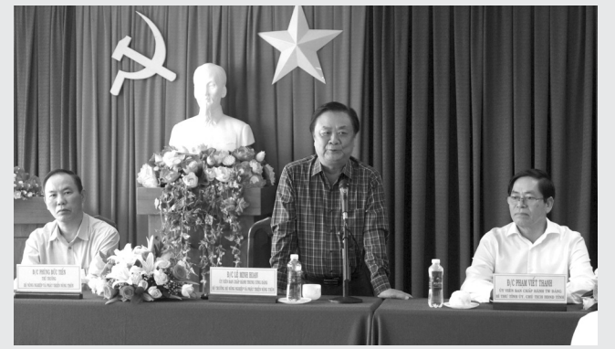
● Bộ trưởng Lê Minh Hoan phát biểu chỉ đạo tại buổi làm việc.

Chỉ còn một tháng nữa là hết thời hạn hơn 6 năm chịu "thẻ vàng" của Ủy ban Châu Âu (EC) và xem như thời gian này là cơ hội cuối cùng để ngành thủy sản của Việt Nam kết thúc tình trạng này, Bộ trưởng Bộ NN&PTNT Lê Minh Hoan nhấn mạnh tại buổi làm việc với tỉnh Bà Rịa - Vũng Tàu về phòng, chống khai thác IUU (khai thác hải sản bất hợp pháp, không khai báo và không theo quy định) diễn ra hôm qua (8/4).