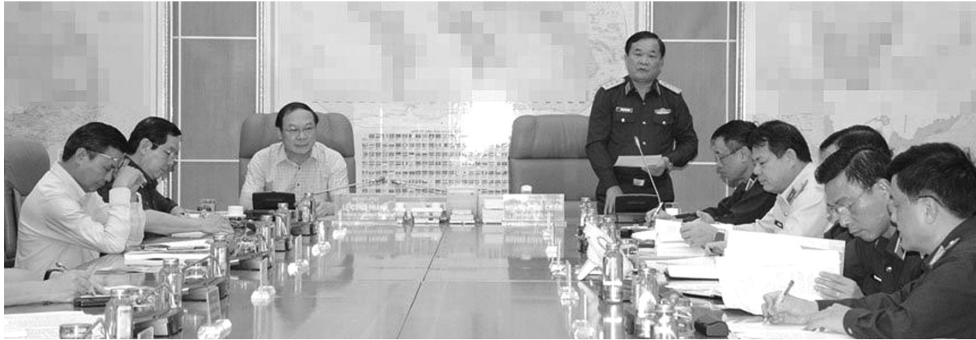
●Phiên họp đánh giá kết quả công tác KPHQBM&CDHH năm 2023, triển khai nhiệm vụ năm 2024.

Năm 2024, công tác khắc phục hậu quả bom mìn và chất độc hóa học/dioxin (KPHQBM&CDHH) sau chiến tranh sẽ tiếp tục thực hiện 8 dự án, tổ chức xây dựng Pháp lệnh khắc phục hậu quả bom mìn sau chiến tranh, bố trí khoảng 800 tỷ đồng và phá bom mìn tại 4 tỉnh biên giới phía Bắc (Cao Bằng, Lào Cai, Hà Giang và Lạng Sơn).