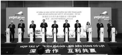
● Chủ tịch Quốc hội Vương Đình Huệ và các đại biểu chúc mừng Hãng Hàng không Vietjet nhân dịp 10 năm mở đường bay tới Trung Quốc và thực hiện nghi thức công bố mở đường bay mới tới Thiểm Tây.