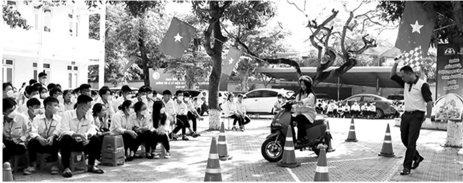
● Cán tăng cường vai trò quản lý, giáo dục ATGT trong nhà trường. (Ảnh minh họa)