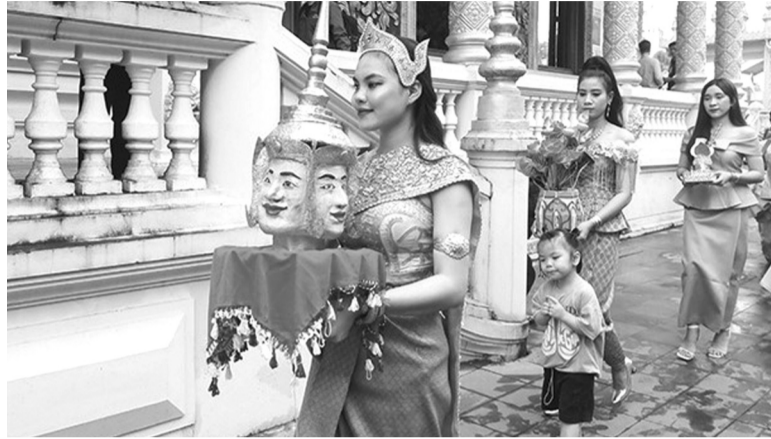
● Các nghi lễ của Tết Chôl Chnăm Thmây chủ yếu diễn ra tại các ngôi chùa của đồng bào Khmer.

Nhân dịp Tết cổ truyền Chôl Chnăm Thmây năm 2024 của đồng bào Khmer, thay mặt lãnh đạo Đảng và Nhà nước, Thủ tướng Chính phủ Phạm Minh Chính đã gửi Thư chúc mừng đến đồng bào, đồng chí và các vị chủ tịch dân tộc Khmer. Đồng thời, trong Tết cổ truyền Chôl Chnăm Thmây năm 2024, Ủy ban Dân tộc tổ chức các Đoàn công tác tổ chức đi chúc Tết tại các tỉnh, thành phố (Cần Thơ, Kiên Giang, An Giang, Hậu Giang, Sóc Trăng, Trà Vinh... và một số địa phương); thăm, chúc mừng đồng bào Khmer và tặng quà người có uy tín trong đồng bào dân tộc thiểu số là dân tộc Khmer.