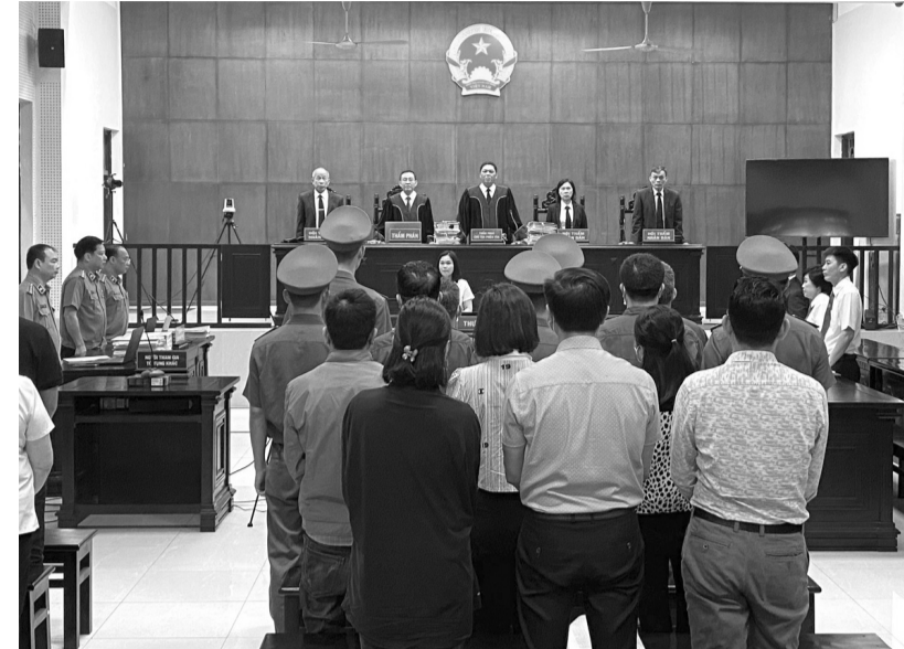
● Phiên xử diễn ra tại TAND tỉnh Quảng Ninh.

Sau đó, Đước thành lập Cty TNHH Phát triển Thương mại Vận tải Phương Bắc (trụ xã Văn Phong,