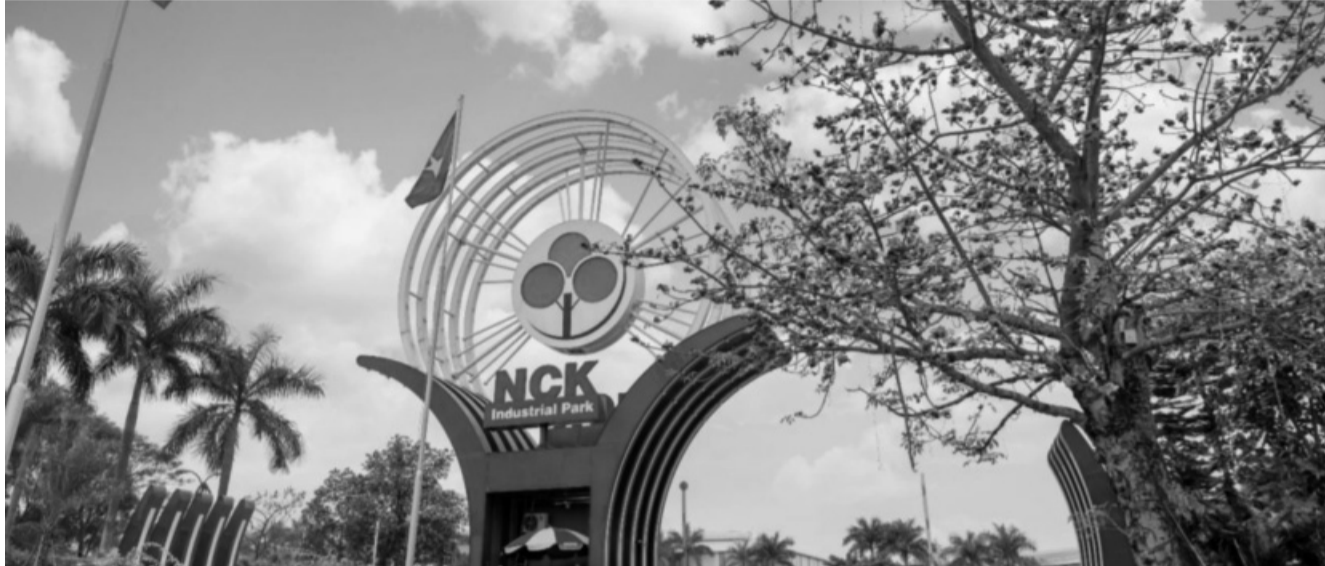
● Khu công nghiệp Nam Cầu Kiền có tiềm năng phát triển kinh tế tuần hoàn ở cấp vùng.

Bộ Kế hoạch và Đầu tư (KH&ĐT) đang xây dựng Luật Khu công nghiệp (KCN) và khu kinh tế (KKT) với 6 nhóm chính sách nhằm thúc đẩy phát triển các KCN, KKT, đáp ứng các yêu cầu công nghiệp hóa, hiện đại hóa (CNH - HĐH) đất nước cũng như xu thế vận động mới trên thế giới.