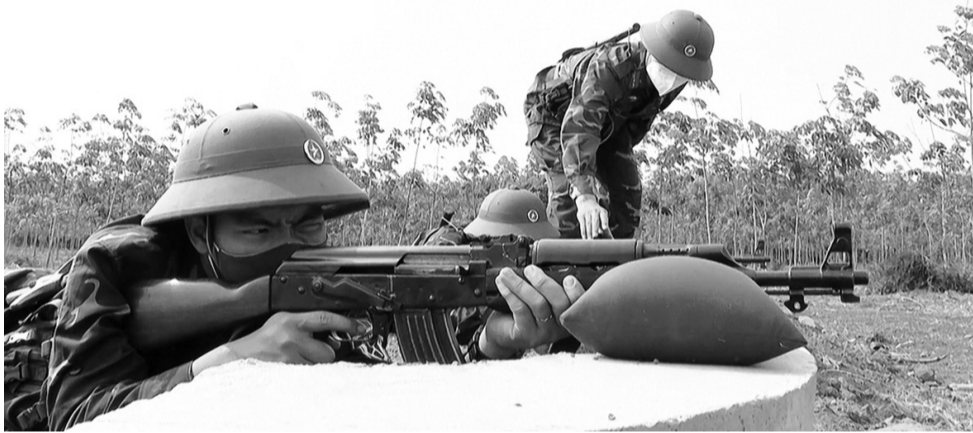
● Chiến sĩ mới huấn luyện bắn súng trên thao trường.

Thường xuyên gần gũi, nắm bắt tâm tư, thực hiện "3 cùng" với chiến sĩ, để kịp thời động viên các chiến sĩ yên tâm tư tưởng, nhận và hoàn thành tốt mọi nhiệm vụ được giao. Mặt khác, cũng có thao trường bãi tập, làm mới mô hình học cụ, chuẩn bị giáo án, tổ chức thông qua giáo án huấn luyện đúng quy định. Tô chức tập huấn, bồi dưỡng 100% cán bộ từ tiểu đội trở lên, quán triệt đến từng cán bộ về tinh thần, trách nhiệm với bộ đội, với đơn vị và yêu cầu tỉ mỉ, sâu sát, tận tình giúp CSM theo phương châm "cơ bản, thiết thực, vững chắc" trong huấn luyện.