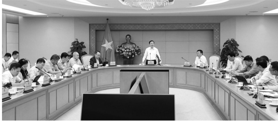
● Phó Thủ tướng Trần Hồng Hà nêu rõ điện mặt trời mái nhà là nguồn năng lượng tái tạo cần khuyến khích phát triển.

Tại cuộc họp, đại diện Trung tâm Điều độ hệ thống điện quốc gia đã báo cáo về năng lực bảo đảm an toàn, ổn định của lưới điện quốc gia khi tăng công suất nguồn điện tái tạo. Lãnh đạo các Bộ, ngành cũng đã trao đổi về những giải pháp cải cách, rút ngắn thủ tục hành chính về môi trường, xây dựng, phòng cháy, chữa cháy... trong cấp phép lắp đặt điện mặt trời mái nhà; hỗ trợ lãi suất ưu đãi; tiêu chí xác định điện nền hình thành từ lưu trữ điện mặt trời mái nhà; thẩm quyền cấp tín chỉ xanh cho