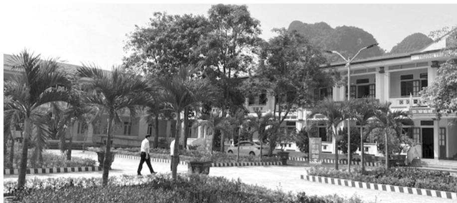
●Trường THCS Hồng Hóa.