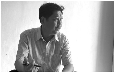
●Thầy Văn cho hay sẽ yêu cầu giáo viên chủ nhiệm và các giáo viên bộ môn tăng cường hỗ trợ, phụ đạo thêm với học sinh.

Đã học đến cuối năm lớp 6, nhưng một học sinh (HS) chỉ đọc được vài chữ trong cả trang sách, chỉ viết đúng được họ tên mình. Sự việc xảy ra tại Quảng Bình.