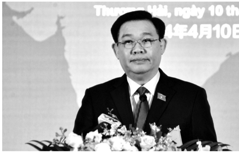
● Chủ tịch Quốc hội Vương Đình Huệ phát biểu tại Diễn đàn.

Về đầu tư, Trung Quốc có hơn 4.400 dự án còn hiệu lực với tổng