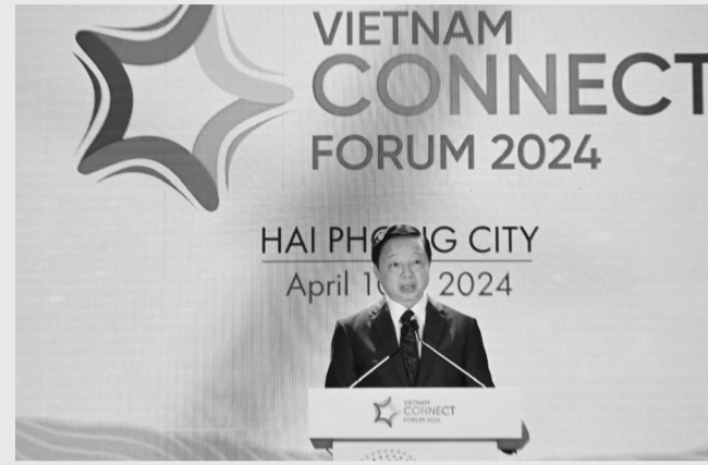
● Phó Thủ tướng Trần Hồng Hà phát biểu tại Diễn đàn.