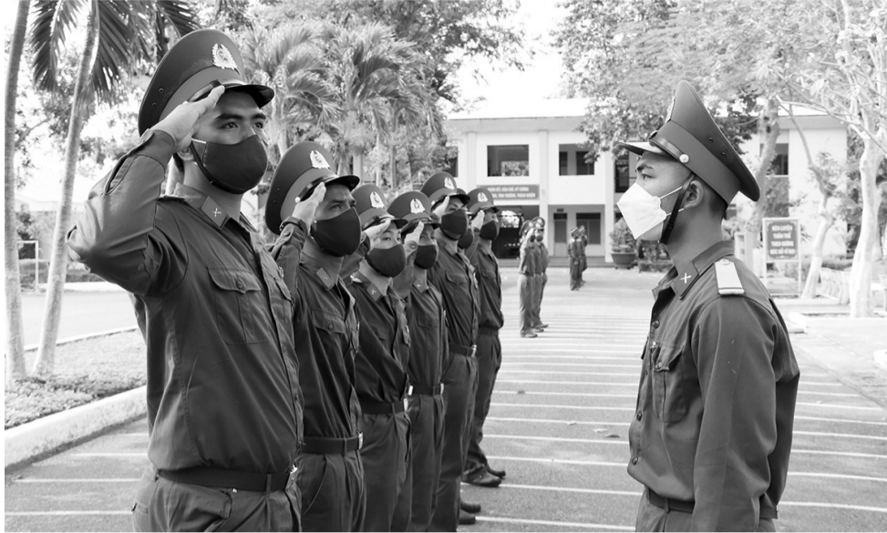
● Tân binh tập điều lệnh, đội ngũ.