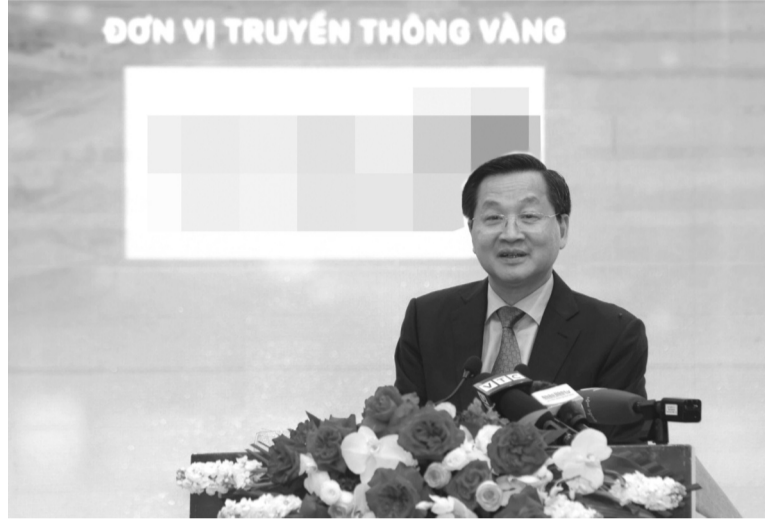
● Phó Thủ tướng Lê Minh Khái phát biểu tại Diễn đàn.

Kết quả đến nay, liên kết giữa các thành viên trong tổ chức KTĐT, HTX với nhau, giữa HTX với doanh nghiệp và các tổ chức kinh tế khác bước đầu đã có sự phát triển. Theo số liệu thống kê của Liên minh HTX Việt Nam và Bộ Nông nghiệp và Phát triển nông thôn, cả nước đã có trên 4.000 HTX tham gia liên kết theo chuỗi giá trị (chiếm gần 13% tổng số HTX). Tại một số địa phương như Thái Nguyên, Hà Nam, Nghệ An, Lâm Đồng, Đắk Lắk, TP Hồ Chí Minh, Tiền Giang... đã xuất hiện những mô hình HTX kiểu mới điển hình tiên tiến, hoạt động hiệu quả, mang lại thu nhập ổn định cho các thành viên và đóng vai trò quan trọng trong chuỗi liên kết phát triển vùng sản xuất nông nghiệp hàng hóa quy mô lớn phục vụ chế biến, xuất khẩu.