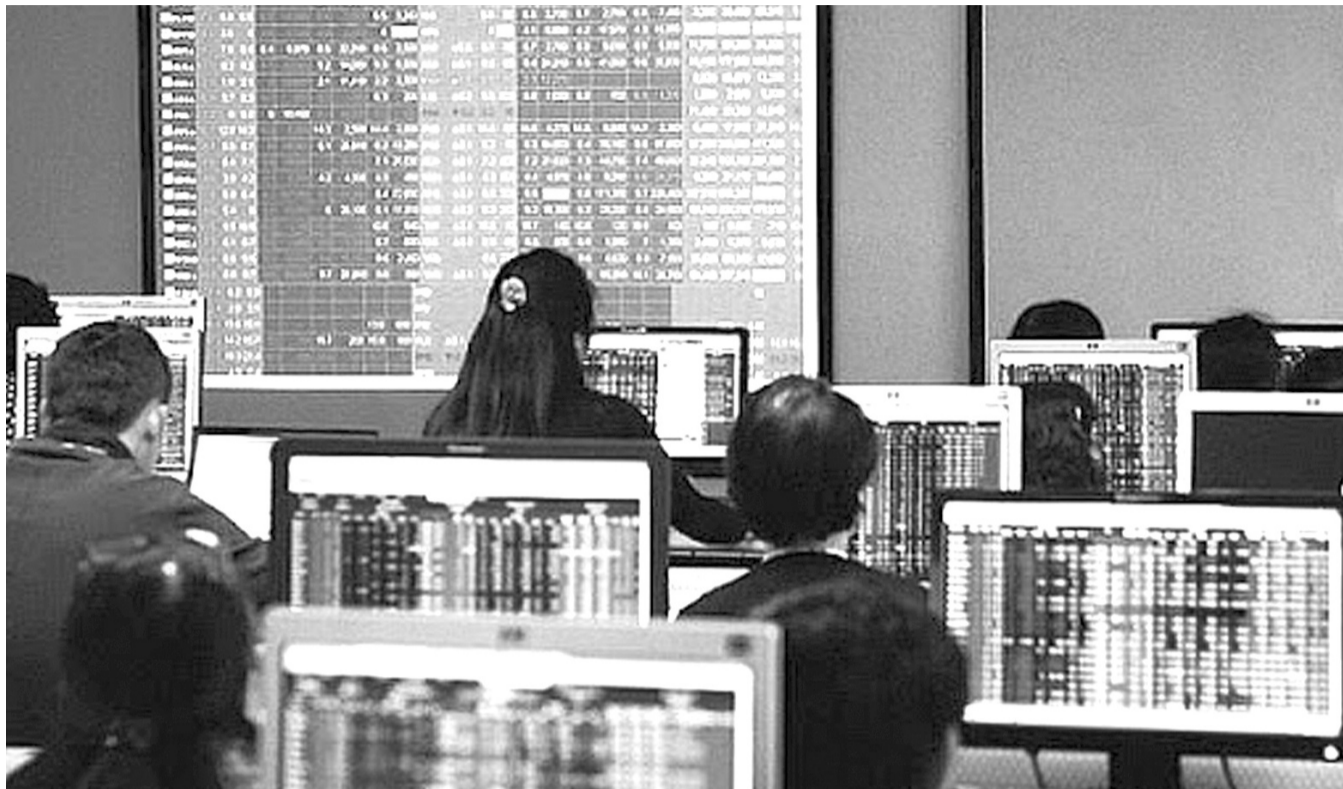
● Sự cố VNDIRECT bị tấn công mạng cảnh báo sự tuân thủ quy định pháp luật về an toàn thông tin. (Ảnh minh họa)

Theo đại diện các cơ quan quản lý và các chuyên gia, về tổng thể, Việt Nam đã có hệ thống đầy đủ với các văn bản quy phạm pháp luật (QPPL) về an toàn thông tin (ATTT), song tính tuân thủ còn hạn chế mà vụ việc Công ty CP Chứng khoán VNDIRECT bị tấn công vừa qua là một tiếng chuông cảnh tỉnh.