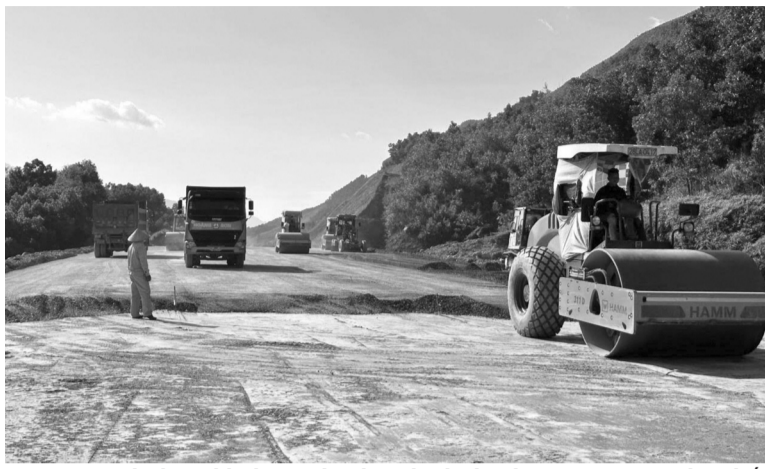
● Dự án vành đai V khi hoàn thành sẽ hình thành trục Đông Tây liên kết, kết nối tỉnh Thái Nguyên với tỉnh Bắc Giang.

Dù đang trong giai đoạn thi công nhưng hiện nay dọc tuyến