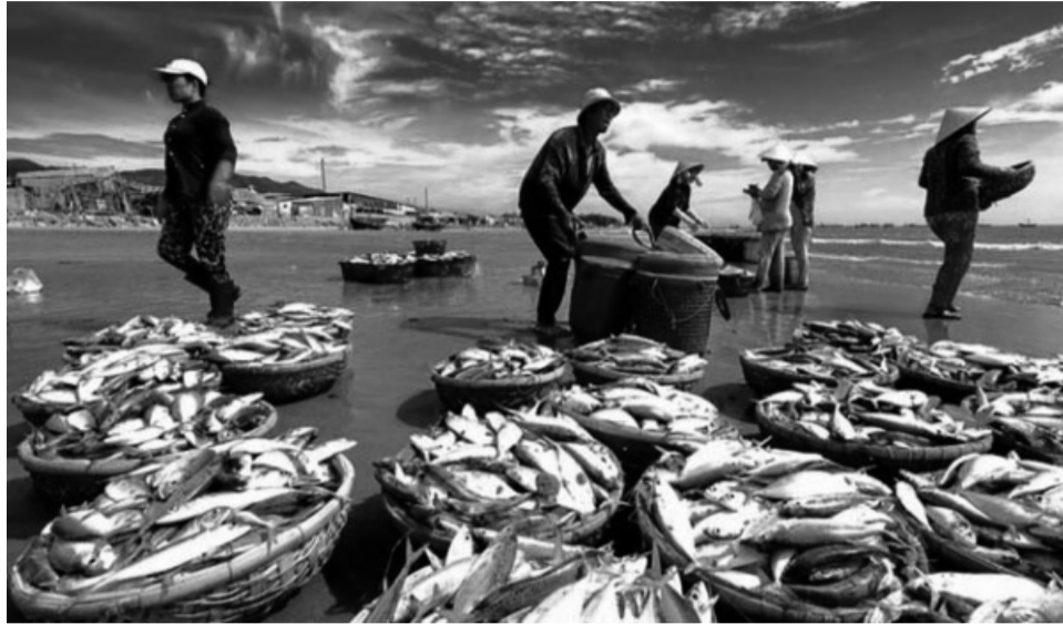
● Quy định mới về xử phạt vi phạm hành chính trong lĩnh vực thủy sản từ 20/5/2024.

Đối với quy định về khai thác thủy sản trong khu vực cấm, Nghị định 38/2024/NĐ-CP quy định phạt tiền từ 70 - 90 triệu đồng đối với hành vi sử dụng tàu cá có chiều dài lớn nhất từ 24m trở lên làm nghề lưới kéo, nghề và ngư cụ kết hợp ánh sáng (trừ nghề câu mực) khai thác thủy sản trong khu vực cấm khai thác thủy sản có thời hạn mà chưa đến mức truy cứu trách nhiệm hình sự.