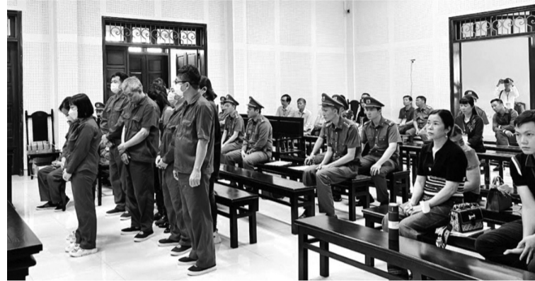
● Các bị cáo nghe phần luận tội của VKS trong phiên xử.