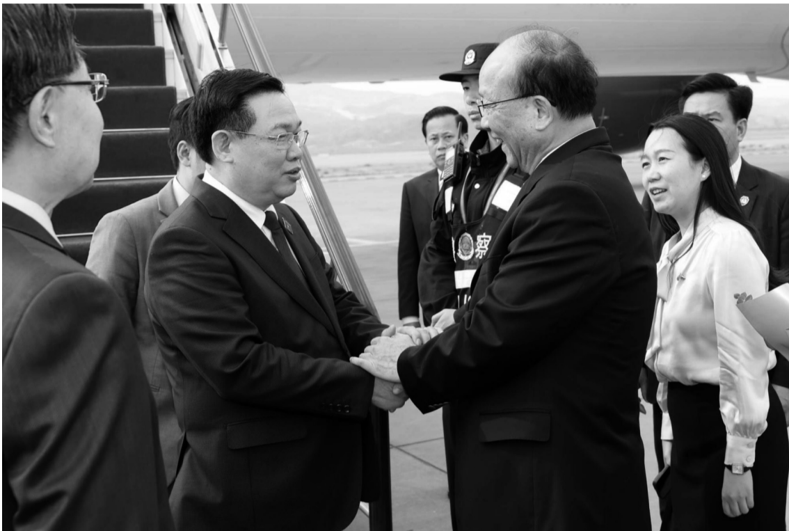
● Lãnh đạo tỉnh Vân Nam đón Chủ tịch Quốc hội Vương Đình Huệ tại sân bay quốc tế Trường Thủy Côn Minh.