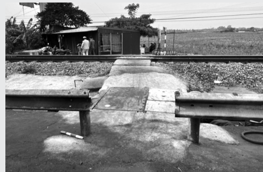
● Trường đã tự tháo tôn hạ lan ở lễ đường QL5 để mở đường ngang trái phép qua đường sắt.

Trước đó, khoảng 9h32 ngày 30/12/2023, tại Km82+650, đường sắt Hà Nội - Hải Phòng, thôn Kim Sơn, Lê Thiện, An Dương xảy ra vụ tai nạn giao thông đường sắt giữa xe máy BKS 16N8-0197 do người đàn ông SN 1973 (quê xã Trường Thọ, An Lão) và tàu hỏa HLP9, hậu quả người đàn ông SN 1973 bị tử vong.