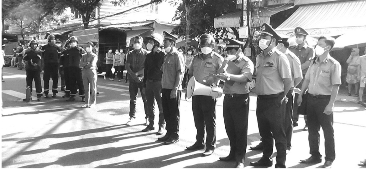
●Chấp hành viên Cục THADS TP Đà Nẵng phối hợp các ngành chức năng tổ chức cưỡng chế thi hành án.