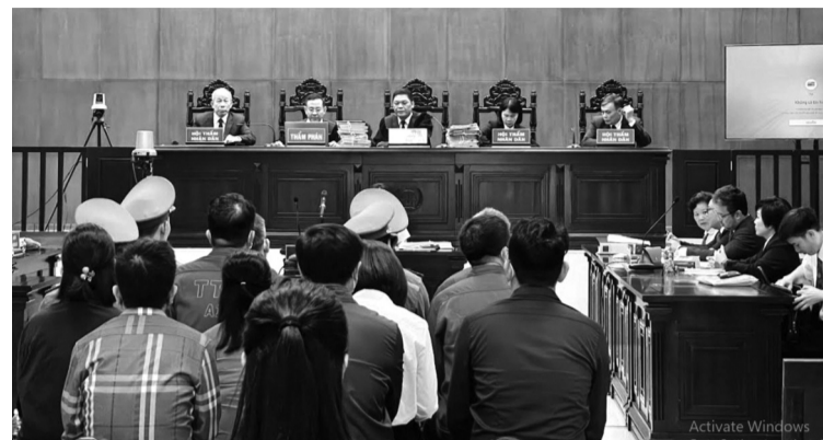
● Dự kiến, hôm nay (12/4) HĐXX TAND Quảng Ninh sẽ tuyên án.