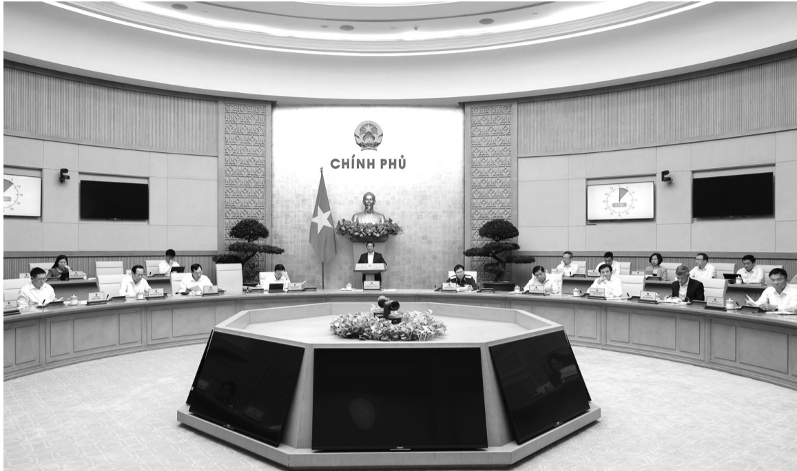
● Thủ tướng Phạm Minh Chính nêu rõ, việc xây dựng và hoàn thiện thể chế là một trong ba đột phá chiến lược, chủ trương lớn của Đảng và Nhà nước, được Chính phủ xác định là một nhiệm vụ trọng tâm.