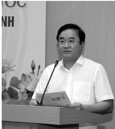
● TS. Đức nhấn mạnh cần tiêm đủ mũi vaccine để chủ động phòng các bệnh truyền nhiễm.

Với các dịch bệnh truyền nhiễm đã có vaccine dự phòng, TS. Đức thông tin, từ đầu năm 2024 đến nay, cả nước ghi nhận 130 ca mắc sởi, tăng 1,4 lần so với cùng kỳ 2023.