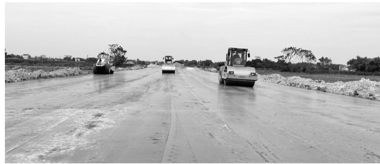
● Ban quản lý dự án đầu tư xây dựng các công trình giao thông tỉnh Thái Nguyên tiếp tục đẩy nhanh tiến độ, giữ vững quan điểm "vượt năng, thắng mưa" để công trình được bàn giao đúng tiến độ, chất lượng.