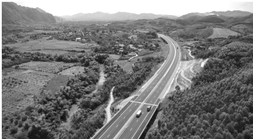
● Cao tốc Chi Lăng - Hữu Nghị sẽ nối thẳng với cao tốc Bắc Giang - Lạng Sơn.