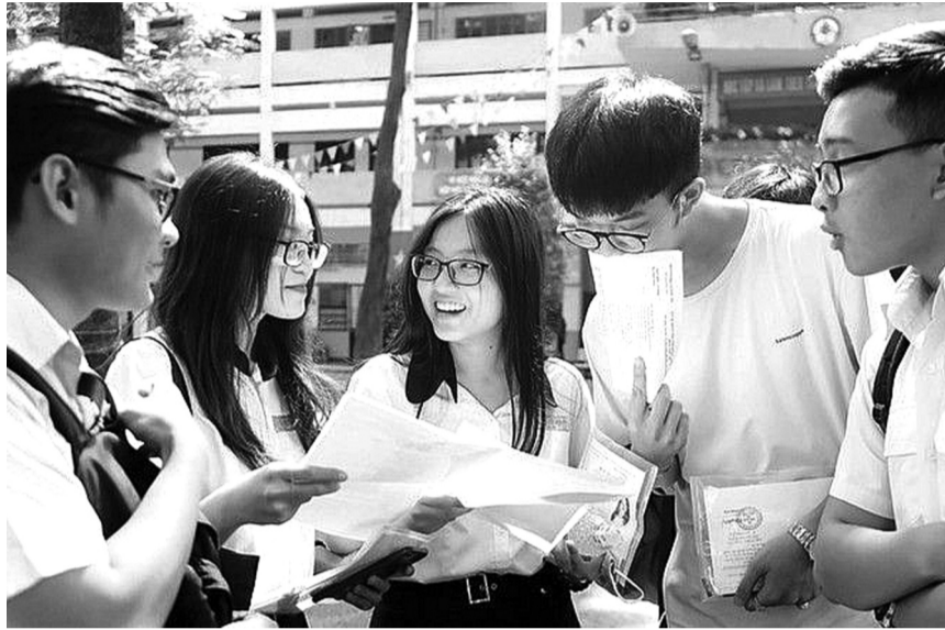
● Học sinh cần xác định lộ trình học tập phù hợp với năng lực và kì thi mình tham gia. (Ảnh minh họa)

Theo đó, ngay từ lớp 10, 11, học sinh muốn thi sớm cần thông qua việc tham khảo ý kiến gia đình, chuyên gia, giáo viên chủ nhiệm, giáo viên bộ môn... Từ đó xác định năng lực bản thân, sự yêu thích và các điều kiện gia đình phù hợp cho nghề nghiệp tương lai. Việc xác định ngành, nghề sẽ cần hoàn thiện sớm để từ đó chọn ngôi trường ĐH phù hợp theo mức điểm - lực học, kì thi, phương thức tuyển sinh và khoảng cách địa lí, học phí... Học