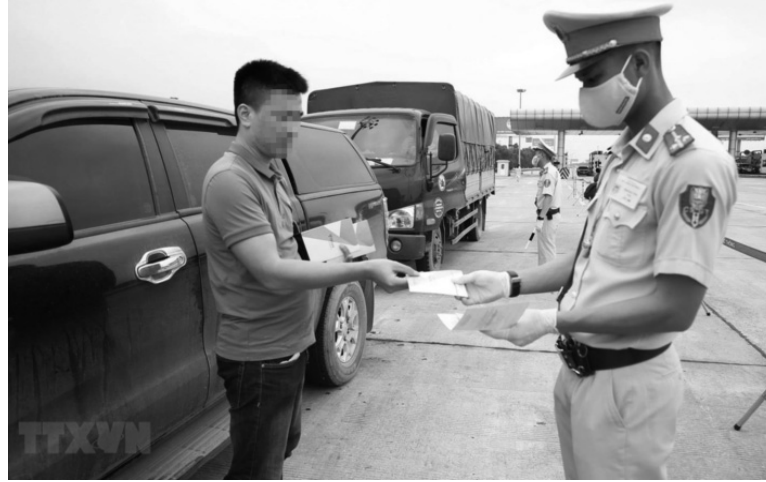
● Quy định về trừ điểm giấy phép lái xe được đánh giá là sẽ tác động tới hành vi, nâng cao ý thức của người tham gia giao thông. (Ảnh minh họa/Nguồn: TTXVN)

thu hồi GPLX khi xử phạt như hiện nay là rất an toàn và phù hợp. “Thay vì tạm giữ bằng lái, chúng ta áp dụng trừ điểm là rất nhân văn. Những tài xế lái xe mà bị tạm