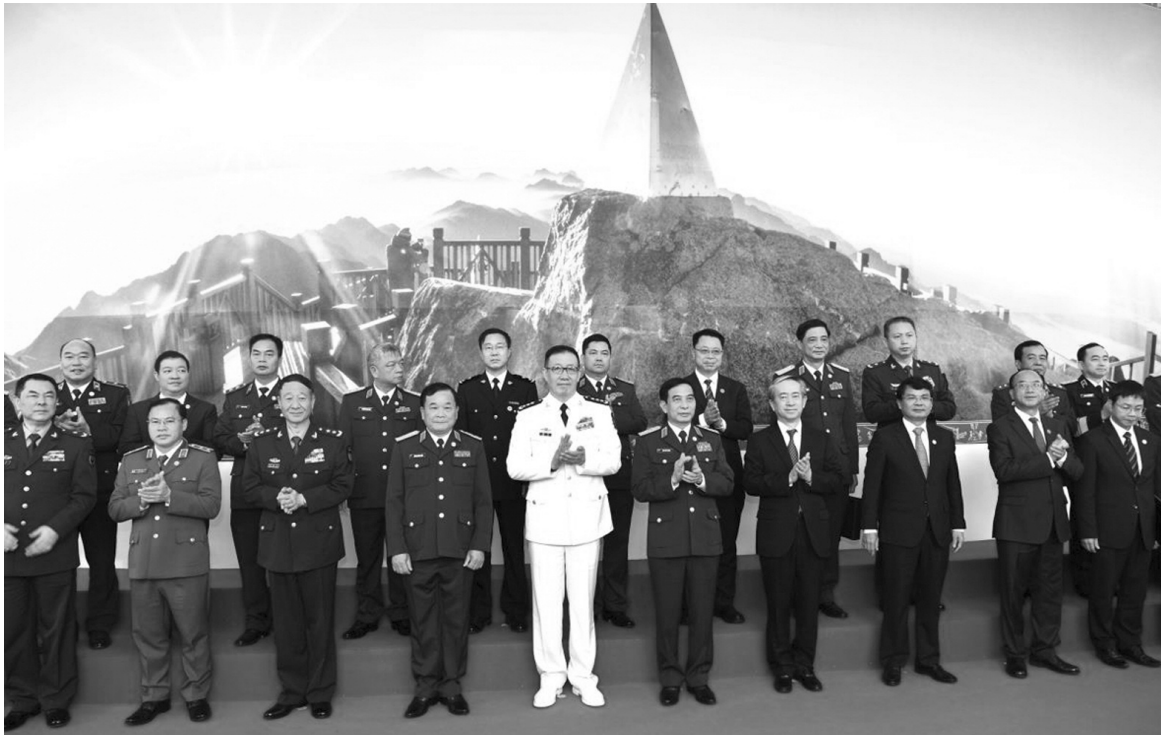
● Đoàn đại biểu Bộ Quốc phòng hai nước dự hội đàm chụp ảnh chung.

Qua 10 năm với 8 lần tổ chức rất thành công, Giao lưu hữu nghị Quốc phòng biên giới (GLHNQP) Việt Nam - Trung Quốc đã trở thành mô hình hợp tác hiệu quả, đặc sắc; thể hiện quyết tâm chính trị của hai bên trong việc tăng cường tình đoàn kết, hữu nghị, gắn bó giữa Nhân dân, chính quyền địa phương và giữa Bộ Quốc phòng (BQP) hai nước, cùng nhau xây dựng biên giới hòa bình, hữu nghị, hợp tác và phát triển.