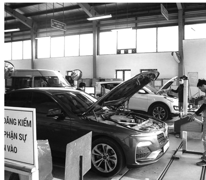
● Bộ GTVT đồng ý với đề xuất nghiên cứu cung cấp hồ sơ, giấy chứng nhận đăng kiểm phương tiện dưới dạng điện tử. (Ảnh minh họa)

Cục Đăng kiểm cho rằng, việc đầu tư dự án trên là cần thiết trong giai đoạn hiện nay nhằm đáp ứng nhu cầu về cơ sở vật chất, tăng cường năng lực trong hoạt động đăng kiểm để khắc phục các vấn đề cũng như thực hiện định hướng CDS theo các