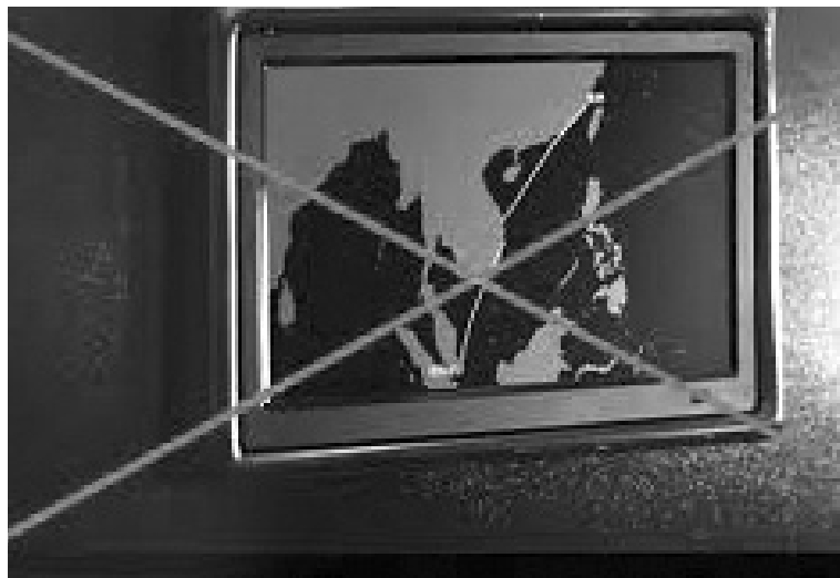
● Những thông tin xuyên tạc về chủ quyền và lịch sử của Việt Nam cần phải nghiêm túc loại trừ. (Ảnh minh họa - Nguồn: vietnamplus)

“Theo quy định tại khoản 5 Điều 21 Luật Điện ảnh, Bộ VH,TT&DL tổ chức nhân lực, phương tiện kỹ thuật để thực hiện việc kiểm tra nội dung phim, phân loại, hiển thị kết quả phân loại phim phổ biến trên không gian mạng; phối hợp với Bộ TT&TT, Bộ Công an và cơ quan quản lý nhà nước có liên quan thực hiện các biện pháp ngăn chặn, xử lý hành vi vi phạm quy