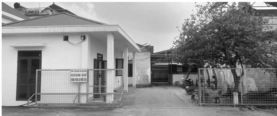
●Trụ sở Cty nước sạch Bạch Đằng tại thôn Trạm Lộ, xã Bạch Đằng, TX Kinh Môn. (Ảnh: Gia Hải)

Ngày 2/1/2024, đơn vị nơi người phụ nữ công tác đã có Kết luận nội dung tố cáo số 01/KL-ĐPT với viên chức này. Theo kết luận, nữ viên chức trên được Chủ tịch UBND TP Hải Dương tuyển dụng là viên chức của đơn vị từ tháng 8/2010 đến nay.