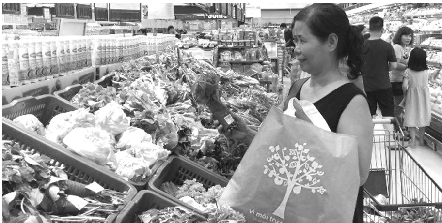
● Xu hướng kinh doanh và tiêu dùng xanh ngày càng được doanh nghiệp và người dân quan tâm. (Ảnh minh họa - Nguồn: VGP)

Trong thời gian qua, các nhà quản lý doanh nghiệp hàng đầu Việt Nam đã cho thấy rõ vai trò và minh chứng cụ thể về những nỗ lực liên tục của cả cộng đồng