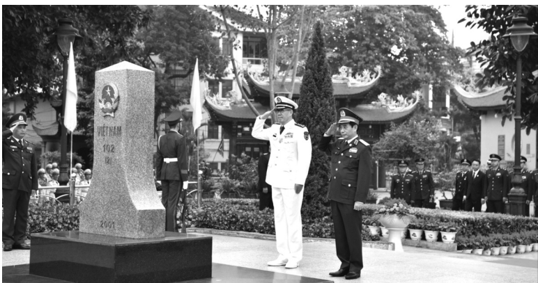
● Bộ trưởng Bộ Quốc phòng hai nước chào cột mốc chủ quyền.