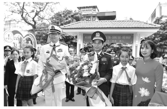
● Học sinh Trường Tiểu học Kim Đồng trao khăn quàng đỏ và tặng hoa hai Bộ trưởng Bộ Quốc phòng.