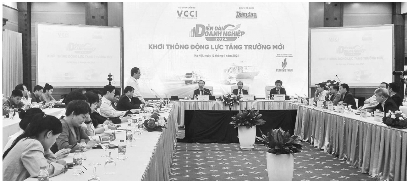
● Diễn đàn Doanh nghiệp 2024 với chủ đề “Khởi thông động lực tăng trưởng mới”.

Khôi phục các động lực tăng trưởng truyền thống và khởi thông, tận dụng hiệu quả các động lực tăng trưởng mới hướng đến phát triển bao trùm, bền vững trở thành yêu cầu vừa mang tính cấp bách, vừa mang tính chiến lược lâu dài đối với nền kinh tế Việt Nam.