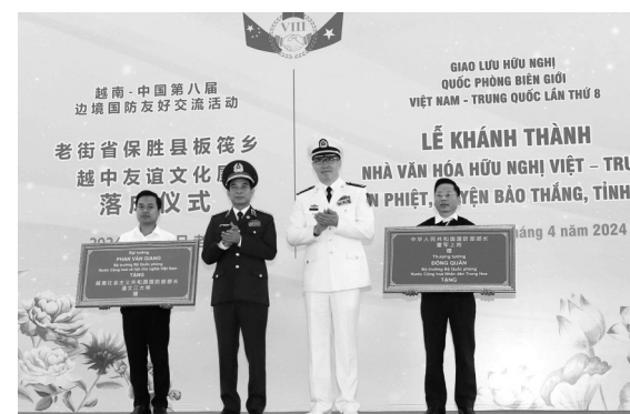
● Bộ trưởng Bộ Quốc phòng hai nước tặng quà cho xã Bản Phiệt.