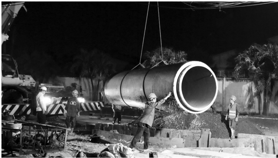
● Tổng Công ty Cấp nước Sài Gòn thi công tuyến ống D1200 Nguyễn Cửu Phú.

Trong năm 2023, công tác đấu thầu tại SAWACO được thực hiện nghiêm túc và tuân thủ quy định pháp luật về đấu thầu, bảo đảm chặt chẽ, minh bạch. Điều này góp phần nâng cao hiệu quả cạnh tranh giữa các nhà thầu và mang lại nhiều kết quả như: lựa chọn được nhà thầu có đủ năng lực, kinh nghiệm thực hiện gói thầu bảo đảm chất lượng và tiến độ; số lượng và giá trị gói thầu đấu thầu qua mạng ngày càng tăng giúp tiết kiệm thời gian và chi phí; vai trò và năng lực của bên mời thầu được cải thiện có tác dụng tích cực trong việc đánh giá và lựa chọn nhà thầu theo đúng quy định pháp luật về đấu thầu.