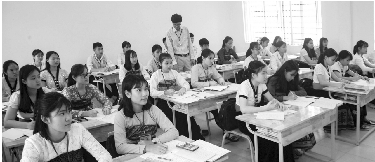
● Trường phổ thông dân tộc nội trú được Nhà nước thành lập cho học sinh là người dân tộc thiểu số, học sinh thuộc gia đình định cư lâu dài tại vùng có điều kiện kinh tế - xã hội đặc biệt khó khăn.

Trong những năm qua, nhờ sự quan tâm đặc biệt của Đảng, Nhà nước, sự nghiệp giáo dục và đào tạo vùng đồng bào dân tộc thiểu số, miền núi có những chuyển biến đáng kể. Để phát huy những kết quả đã đạt được, cần tiếp tục thực hiện hiệu quả các chính sách đã ban hành, đồng thời nghiên cứu, đề xuất sửa đổi, bổ sung và hoàn thiện chính sách hỗ trợ phát triển giáo dục đối với khu vực này.