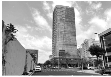
● Tòa nhà Victory Tower nằm tại số 12 Tân Trào, quận 7.