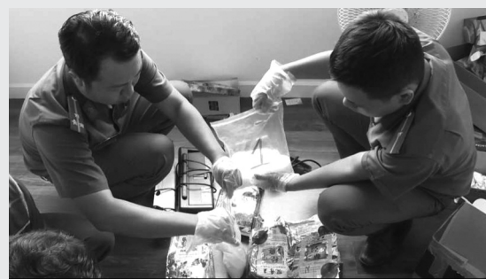
● Công an TP HCM khám nghiệm căn phòng nơi các đối tượng tàng trữ ma túy.

Công an đang tạm giữ hình sự 3 đối tượng nêu trên để tiếp tục làm rõ vị trí, vai trò, hành vi của từng đối tượng; tiếp tục phối hợp Cục Cảnh sát điều tra tội phạm về ma túy Bộ Công an và Công an các địa phương khẩn trương truy xét, mở rộng bắt giữ các đối tượng có liên quan để xử lý triệt để.