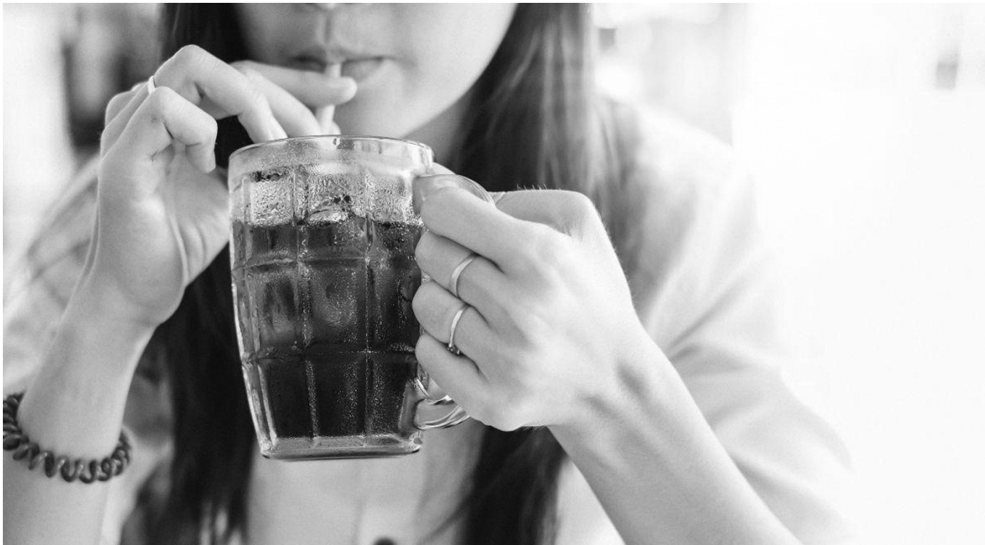
● Trong 10 năm qua, trung bình mỗi người Việt uống 1 lít đồ uống có đường/tuần. (Ảnh minh họa)

Trong 10 năm qua, trung bình mỗi người Việt uống 1 lít đồ uống có đường/tuần, gây nguy hiểm cho sức khỏe bởi những tác nhân từ bệnh không lây nhiễm. Con số đáng báo động này được Tổ chức Y tế Thế giới (WHO) tại Việt Nam cảnh báo tại Hội thảo cung cấp thông tin cho báo chí về tác hại của đồ uống có đường vừa diễn ra vào đầu tháng 4/2024.