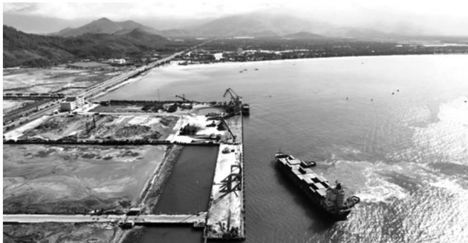
● Cảng biển Chân Mây (huyện Phú Lộc, tỉnh Thừa Thiên Huế) đang được chú trọng đầu tư về hạ tầng để thu hút các hãng tàu, doanh nghiệp.

Với tiềm năng, lợi thế, hạ tầng sẵn có, sau khi xây dựng hoàn thành bến số 4 và