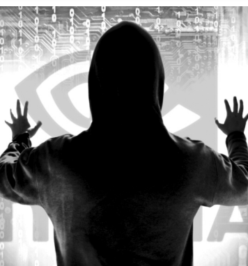
● Hình minh họa.

Tòa nhà Victory Tower nằm tại số 12 Trần Trào, quận 7 có quy mô 30 tầng, gồm shop house (tầng 1 - 2), văn phòng cho thuê (tầng 3 - 23) và những căn hộ cao cấp (tầng 24 - 30). Ngày 20/2/2017, đại diện của Petroland (nay là VCG) ký Hợp đồng dịch vụ quản lý vận hành số 03/2017/CCDVQLVH-SK với Cty Sao Kim trong thời hạn 6 năm.