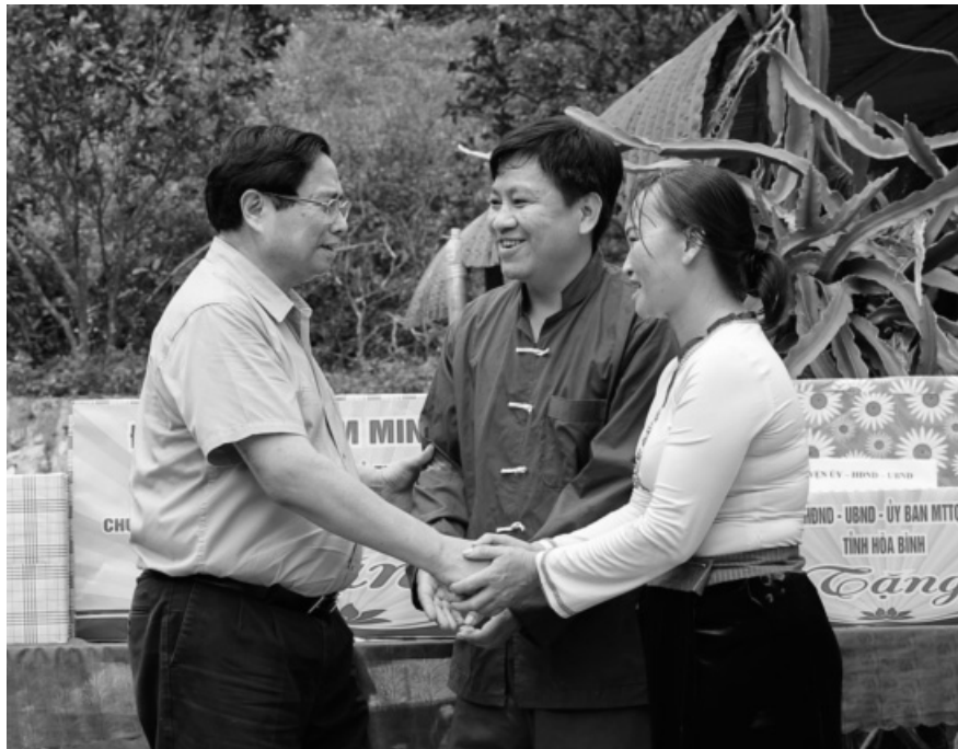
● Thủ tướng động viên, tặng quà, tham gia khởi công xây nhà mới cho một số hộ gia đình có hoàn cảnh khó khăn trên địa bàn huyện Đà Bắc, tỉnh Hòa Bình.

Với nhiều chương trình, đề án hỗ trợ nhà ở cụ thể, đặc biệt là 3 Chương trình mục tiêu quốc gia, từ năm 2011 đến nay, ngân sách nhà nước và xã hội hóa đã hỗ trợ xây dựng, sửa chữa nhà ở cho 820.000 hộ gia đình người có công, hộ nghèo trong cả nước; MTTQ Việt Nam các cấp đã hỗ trợ xây dựng