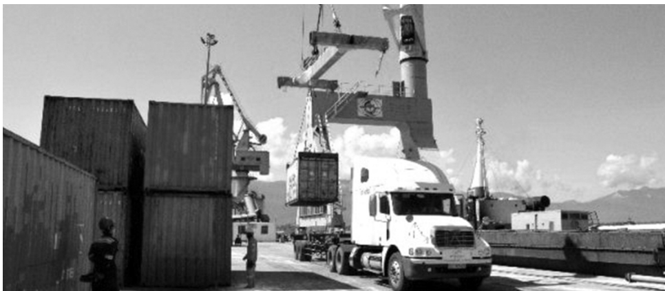
● Các hãng tàu biển có hàng hóa vận chuyển bằng container đi, đến cảng Chân Mây.

số 5 sẽ nâng tổng chiều dài các cầu cảng tại Chân Mây lên 1.450m. Hoàn thành giai đoạn 2 để chắn sóng cảng Chân Mây với chiều dài 750m sẽ bảo đảm các điều kiện để tiếp nhận đồng thời các loại tàu hàng, tàu container, tàu khách cỡ lớn và hiện đại trên thế giới, tăng thời gian khai thác tàu trong năm; tạo động lực và khí thế mới cho Khu kinh tế Chân Mây - Lăng Cô. Ngoài ra, các bến 7 đến 12 cũng đang được tỉnh tập trung kêu gọi đầu tư. Bên cạnh đó, DA để chắn sóng cảng Chân Mây đã được Ban Quản lý Khu kinh tế, công nghiệp tỉnh đầu tư hoàn thành giai đoạn 1 với chiều dài 450m và hiện đang tiếp tục đầu tư giai đoạn 2 với chiều dài 300m, dự kiến hoàn thành vào quý IV/2025 sẽ góp phần hỗ trợ để các tàu làm hàng ổn định, an toàn trong các điều kiện thời tiết không thuận lợi.