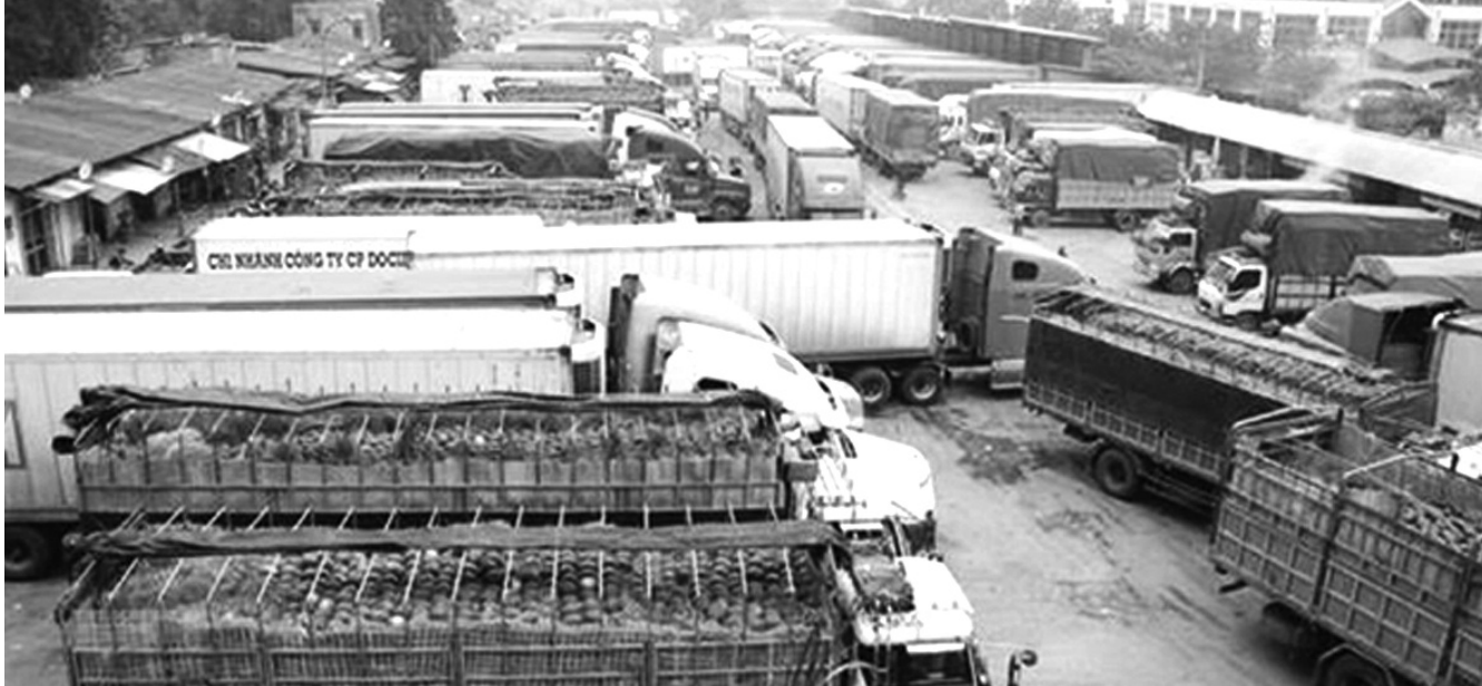
● Ảnh minh họa: TTXVN

Vùng Trung du và miền núi phía Bắc (TD&MNPB) có nhiều thuận lợi để phát triển thương mại biên giới nói riêng và xuất nhập khẩu (XNK) nói chung nhưng vẫn còn tồn tại một số hạn chế lớn, cần có sự liên kết vùng để phát huy thế mạnh từng địa bàn.