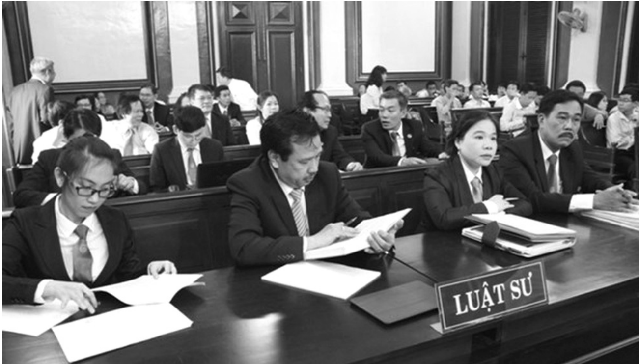
● Các Luật sư tham gia phiên tòa.

Xây dựng Luật Luật sư thay thế Luật Luật sư số 65/2006/QH11 ngày 29/6/2006 của Quốc hội (được sửa đổi, bổ sung bởi Luật số 20/2012/QH13 ngày 20/11/2012 của Quốc hội), Bộ Tư pháp cho biết sẽ quy định chặt chẽ hơn về điều kiện miễn đào tạo nghề, miễn giảm thời gian tập sự hành nghề luật sư.