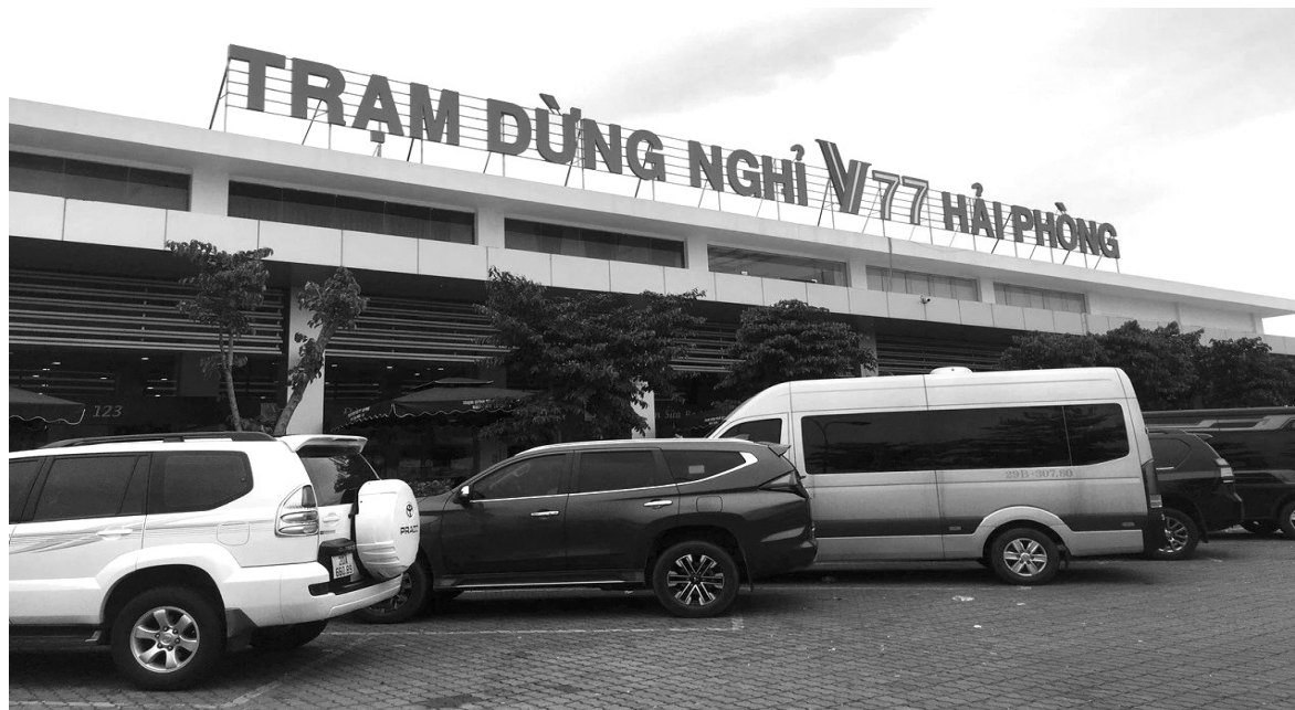
● Trạm dừng nghỉ V77 trên tuyến cao tốc Hà Nội - Hải Phòng.

Hệ thống điện, nước, chiếu sáng, thông tin liên lạc của trạm dừng nghỉ phải bảo đảm đồng