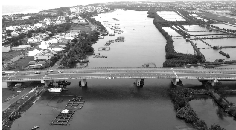
● Dự án cầu Đẽ Vông do Cty Đạt Phương đầu tư theo hình thức BT.

Văn phòng UBND tỉnh Quảng Nam vừa có công văn gửi các Sở TN&MT, Tài chính, KH&ĐT; UBND huyện Thăng Bình, TP Hội An; đề nghị tham mưu UBND tỉnh giải quyết một số kiến nghị của Cty CP Tập đoàn Đạt Phương (trụ sở tại Quảng Nam).