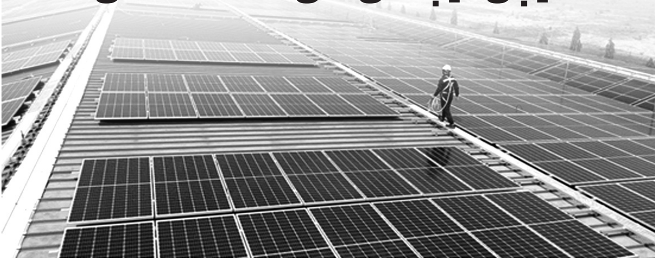
● Hệ thống ĐMTMN của một DN ngành dệt may ở Đồng Nai.

Là nguồn năng lượng sạch, không gây ra khí thải nhà kính hay ô nhiễm môi trường, điện mặt trời mái nhà khu công nghiệp không những giúp doanh nghiệp tiết kiệm chi phí mà còn tạo ra lợi thế cạnh tranh cho doanh nghiệp trên thị trường quốc tế.