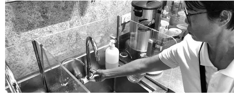
● Cư dân bị cúp nước vì tranh chấp giữa chủ đầu tư với đơn vị vận hành tòa nhà.