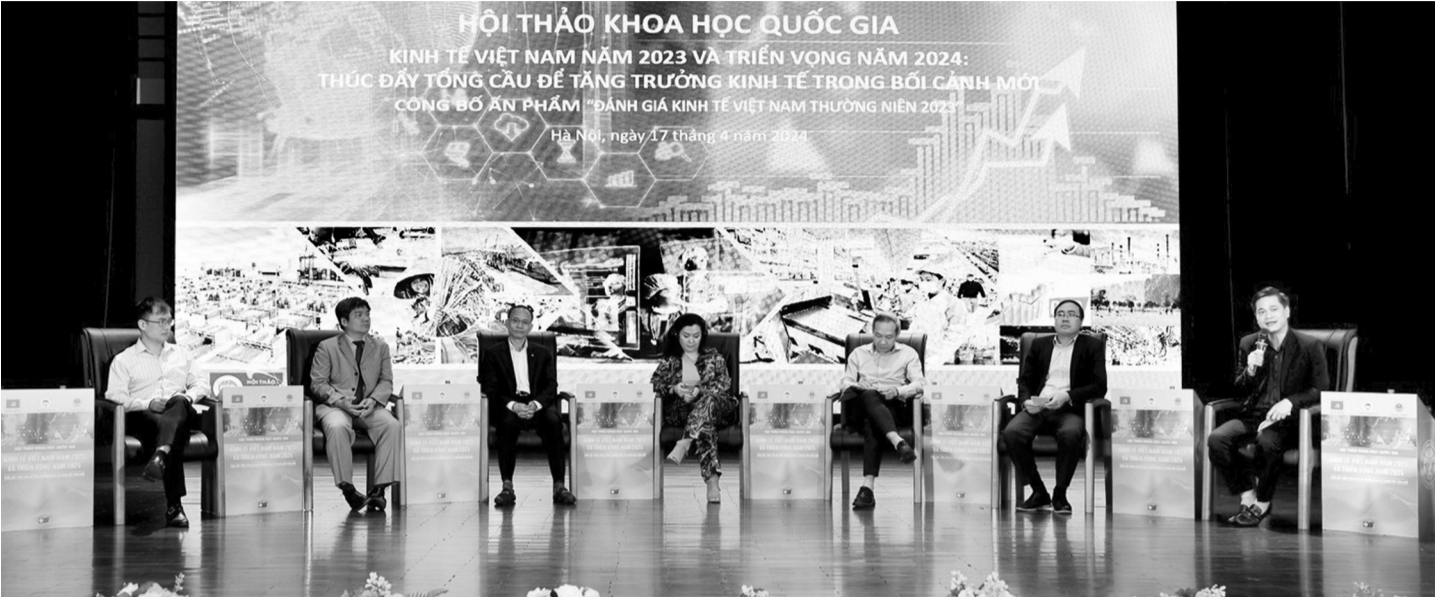
● Các chuyên gia thảo luận tại Hội thảo.

Đóng vai trò quan trọng trong xác định mức độ hoạt động và việc làm trong nền kinh tế, theo các chuyên gia, cần khẩn trương có biện pháp củng cố các động lực tăng trưởng từ phía tổng cầu, tạo tiền đề phát triển kinh tế trong bối cảnh mới.