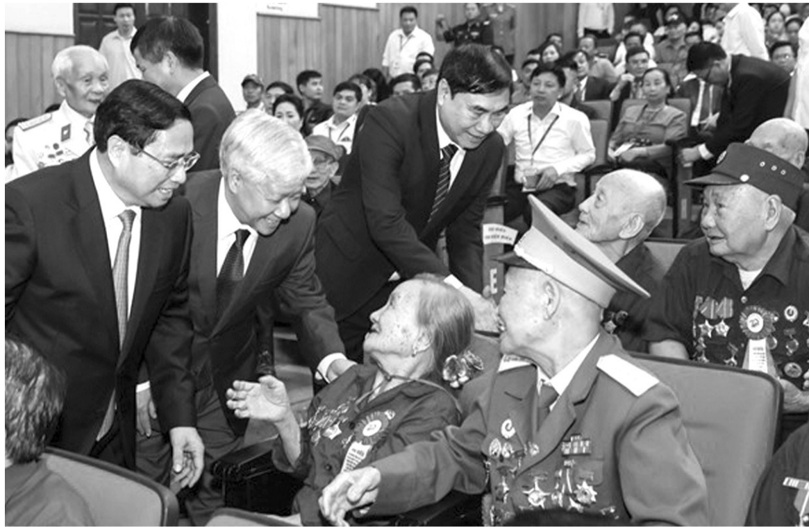
● Thủ tướng Chính phủ Phạm Minh Chính và Chủ tịch UBTƯ MTTQ Việt Nam Đỗ Văn Chiến thăm hỏi các đại biểu tham dự chương trình.

Phát biểu tại chương trình, Bí thư Trung ương Đảng, Chủ tịch Ủy ban Trung ương Mặt trận Tổ quốc Việt Nam Đỗ Văn Chiến xúc động chia sẻ: Chúng ta mãi mãi tri ân công sức của Nhân dân trên mọi miền đất nước với hơn 240.000 người trực tiếp tham gia Chiến dịch Điện Biên Phủ đóng góp cho kháng chiến với khẩu hiệu “tất cả cho tiền tuyến, tất cả cho chiến thắng... Quên sao được hơn 30.000 chiếc xe đạp thồ trong chiến dịch đã vận chuyển hơn 23.000 tấn gạo, 266 tấn muối, gần 2.000 tấn thực phẩm cho chiến trường. Với lòng yêu nước nồng nàn, chí căm thù giặc sâu sắc, các anh, các chị TNXP, dân công hỏa tuyến mới làm được những việc phi thường.