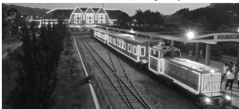
● Chuyến tàu đêm Đà Lạt.

Tuyến tàu hỏa Đà Lạt - Tháp Chàm đã đi vào lịch sử ngành công nghiệp đường sắt khi là cung đường sắt chạy bằng bánh răng cưa, vượt miền duyên hải lên cao nguyên. Để qua được đèo dốc trên cao nguyên Lâm Viên, bên cạnh những đoạn đường ray răng cưa, những bánh răng của được lắp thêm vào trong đầu máy. Tuyến đường sắt Tháp Chàm - Đà Lạt dài 84km gồm hai đoạn: đoạn từ Tháp Chàm đến Krongpha (Sông Pha) và đoạn Krongpha - Đà Lạt.