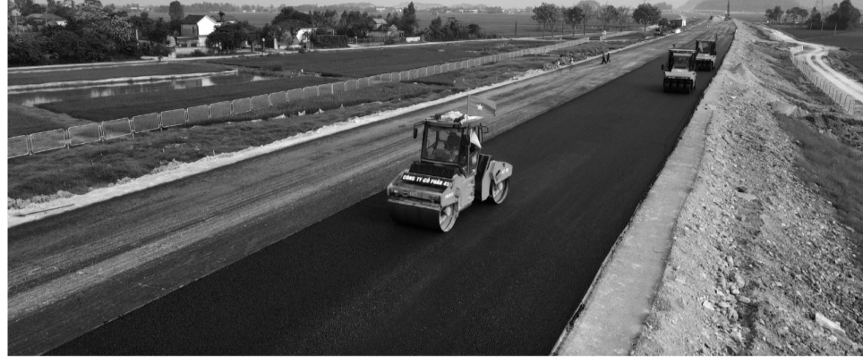
● Thi công cao tốc Diễn Châu - Bãi Vọt.

Không chỉ thi công 3 ca, 4 kíp suốt ngày đêm, nhiều nhà thầu còn sẵn sàng tăng cường máy móc, nhân lực sang hỗ trợ nhà thầu khác đang gặp khó để nỗ lực đưa 2 dự án cao tốc Bắc - Nam phía Đông vào hoạt động trước dịp 30/4.