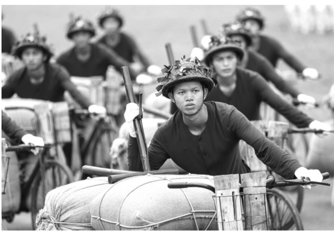
● Khối Dân công hỏa tuyến, tượng trưng cho 30 nghìn thanh niên xung phong vào Dân công hỏa tuyến tham gia Chiến dịch ĐBP.