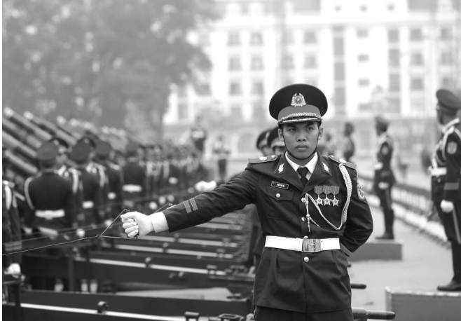
● Lực lượng pháo lễ trong buổi tổng duyệt.