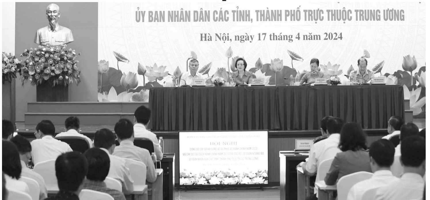
● Năm 2023 là năm thứ 12 liên tiếp Bộ Nội vụ phối hợp với các Bộ, ngành, địa phương và các cơ quan liên quan triển khai xác định, công bố Chỉ số cải cách hành chính của các Bộ, các tỉnh.