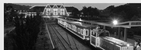
Người dân, du khách trải nghiệm dịch vụ đi tàu đêm Đà Lạt.

Được người Pháp khởi công, xây dựng cách đây hơn 90 năm, Ga Đà Lạt được biết đến là ga xe lửa duy nhất ở Tây Nguyên, cùng với ga Hải Phòng là nhà ga cổ nhất Việt Nam với kiến trúc độc đáo. Để bảo tồn, phát huy Di tích kiến trúc cấp quốc gia này, ngành Đường sắt cùng với chính quyền TP Đà Lạt (Lâm Đồng) đang chung sức hồi sinh ga tàu lịch sử với những sản phẩm du lịch độc đáo.