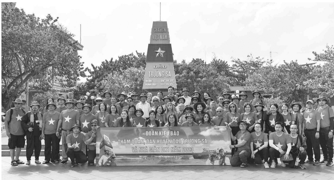
● Đoàn kiều bào thăm Trường Sa năm 2023.