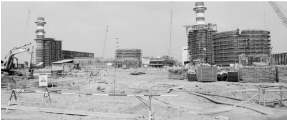
● 2 Nhà máy nhiệt điện Nhơn Trạch 3 - 4 đã thi công được 85%.

Theo Quy hoạch điện (QHĐ) VIII thời kỳ 2021 - 2030, tầm nhìn đến năm 2050 được Thủ tướng phê duyệt tại Quyết định 500/QĐ-TTg ngày 15/5/2023, tổng công suất đặt các nguồn điện đến 2030 là 150,489GW (gần gấp đôi tổng công suất đặt hiện nay, khoảng 80GW). Trong đó, tổng công suất các nguồn điện khí phải đầu tư xây dựng mới là 30.424MW.