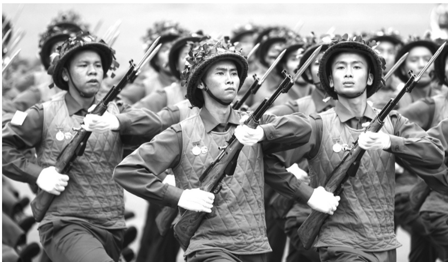
● Khối chiến sĩ Điện Biên với trang phục, vũ khí được tái hiện đúng như hình ảnh người lính Cụ Hồ vào 70 năm trước.

Buổi họp luyện của khối Quân đội diễn ra trong khí thế hùng tráng "đều, đẹp, thống nhất" khi chỉ còn khoảng nửa tháng nữa là diễn ra Lễ kỷ niệm 70 năm Chiến thắng ĐBP. Thời tiết ở Hà Nội thời gian qua khá thuận lợi, không mưa, trời quang, nắng ráo.