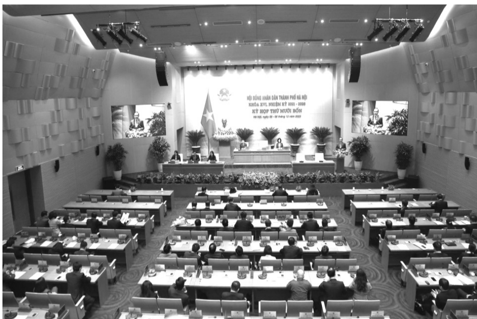
● Quang cảnh một kỳ họp của HĐND TP Hà Nội.