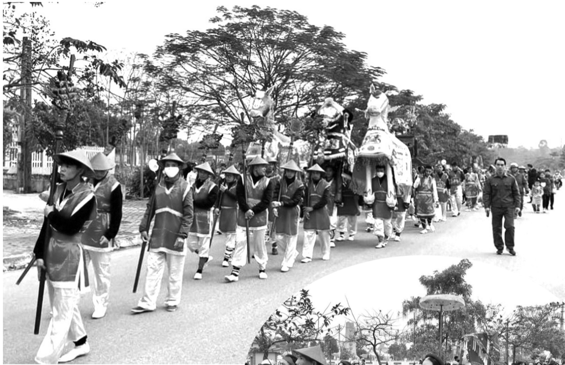
● Đặc sắc nghi lễ rước Chúa gái.

Truyền thuyết thời Hùng Vương lưu truyền rằng: Thời Vua Hùng Duệ Vương (Hùng Vương thứ 18), có hai người con gái, một người tên là My Châu Tiên Dung Công chúa được gả cho Chử Đồng Tử - chàng trai nghèo kiếm cá ven sông (ở xã Đa Hòa, huyện Đông Yên, phủ Khoái Châu, xứ Sơn Nam). Còn My Nương Ngọc Hoa Công chúa, Vua Hùng muốn tìm người tài giỏi, kiệt xuất nên chưa gả