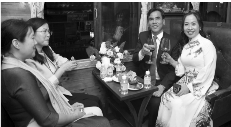
● Người dân, du khách trải nghiệm dịch vụ đi tàu đêm Đà Lạt.

của tuyến đường sắt độc đáo Đà Lạt - Tháp Chàm, những năm qua ngành ĐSVN cùng chính quyền TP Đà Lạt đã tích cực phối hợp, đưa vào khai thác nhiều sản phẩm du lịch mới.