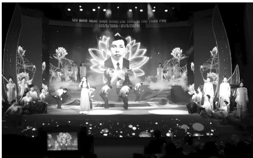
● Chương trình nghệ thuật "Hãy giữ vững chí khí chiến đấu" tại Lễ kỷ niệm 120 năm Ngày sinh cố Tổng Bí thư Trần Phú.