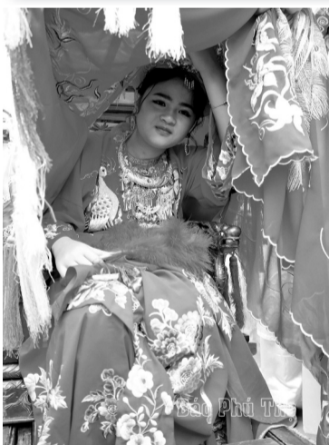
● Chúa gái ngồi trên ngai và được các thanh niên nữ tú của làng Vi và làng Trọ rước.

Ngoài chủ tế, quan viên trong đội tế, người làm voi, ngựa, đội chân cờ, chân kiệu, người đóng một số vai diễn trò bách nghệ khôi hài... cũng phải đáp ứng những tiêu chuẩn truyền thống, gia đình hòa thuận, không có tang ma, những người từng trải, có kinh nghiệm, khỏe mạnh, có đạo đức... Mỗi làng phải làm một voi màu đen, một cặp ngựa, con hồng, con trắng, to bằng voi, ngựa thật. Người ta dùng nan tre đan hình cốt voi, ngựa sau đó dán giấy màu bên ngoài, trang trí rực rỡ, sống động.