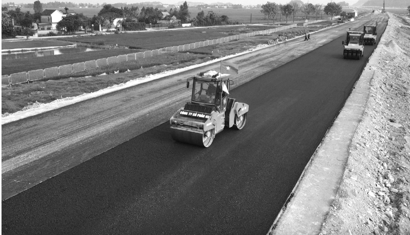
Thi công cao tốc Diễn Châu - Bãi Vọt.

Không chỉ thi công 3 ca, 4 kíp suốt ngày đêm, nhiều nhà thầu còn sẵn sàng tăng cường máy móc, nhân lực sang hỗ trợ nhà thầu khác đang gặp khó để nỗ lực đưa 2 dự án cao tốc Bắc - Nam phía Đông vào hoạt động trước dịp 30/4.