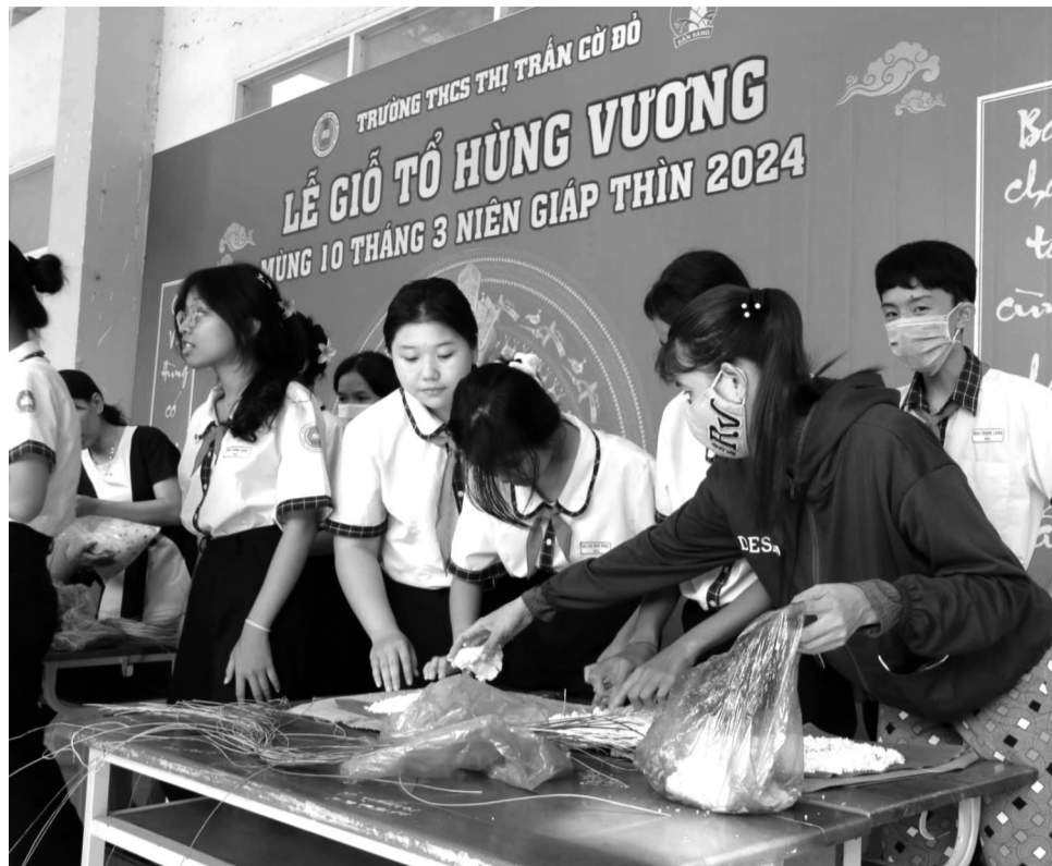
● Thế hệ trẻ tham gia nhiều hoạt động ý nghĩa trong dịp Giỗ Tổ Hùng Vương.

Đối với thế hệ trẻ, ngoài việc gìn giữ những tục lệ truyền thống, nhiều bạn trẻ còn tích cực tham gia hoạt động thiết