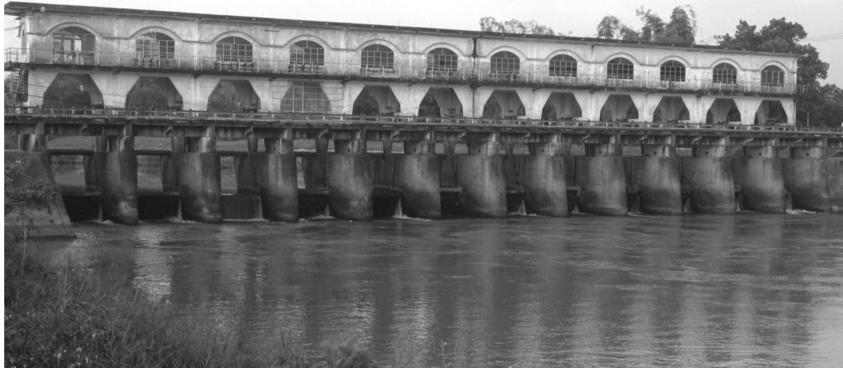
● Nước sông tại cửa thu nước thô vào các nhà máy nước ở Đà Nẵng đang bị nhiễm mặn.