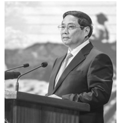
● Thủ tướng Chính phủ Phạm Minh Chính phát biểu tại chương trình.

Cùng với đó, Thủ tướng yêu cầu thực hiện đồng bộ, hiệu quả các chính sách ưu đãi người có công, không ngừng nâng cao đời sống vật chất, tinh thần cho người có công và gia đình có công với cách mạng; quan tâm hơn nữa đến người có công có hoàn cảnh khó khăn, sống cô đơn, không nơi nương tựa, các gia đình người có công ở vùng sâu, vùng xa, biên giới, hải đảo, vùng đồng bào dân