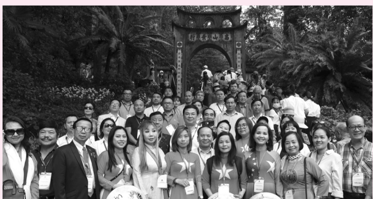
Đoàn kiều bào về dâng hương tưởng niệm các Vua Hùng trong dịp Giỗ Tổ Hùng Vương.

Với những người Việt sống xa Tổ quốc, “sông dù lớn bao nhiêu cũng đổ về với biển, lá tươi tốt bao nhiêu khi già cũng rụng về cội rễ”; người Việt sống ở phương trời nào cũng đều hướng về cội nguồn, về với quê hương, Tổ quốc. Những ngày cận kề Giỗ Tổ Hùng Vương năm nay, kiều bào ở một số nơi trên thế giới cũng đang háo hức trở về để tham dự Giỗ Tổ và tham gia đoàn công tác tới thăm, động viên cán bộ, chiến sĩ và Nhân dân huyện đảo Trường Sa và Nhà giàn DK1.