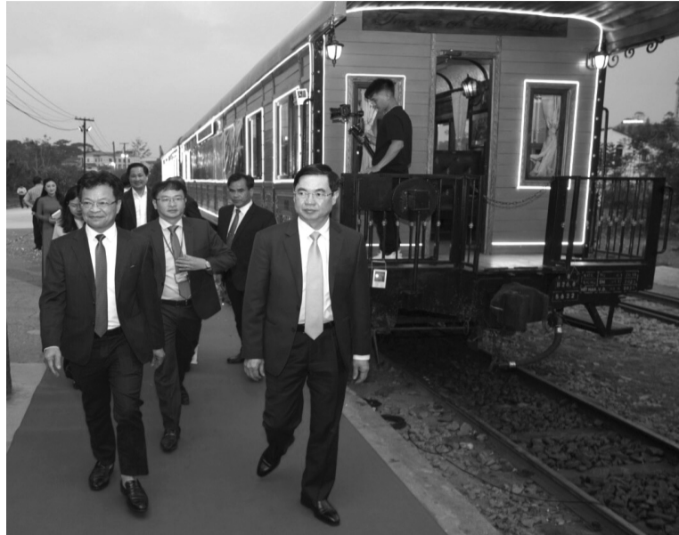
● Lãnh đạo tỉnh Lâm Đồng cùng lãnh đạo TP Đà Lạt và Tổng Cty Đường sắt Việt Nam tại sự kiện khai trương chuyên tàu đêm.

Năm 1990, đoạn đường cuối cùng từ Đà Lạt - Trại Mát dài khoảng 7km được khai thác để phục vụ du lịch. Tuy vậy, việc sử dụng, khai thác các tiềm năng du lịch này của thành phố chưa đạt hiệu quả cao. Tuy nhiên, với quyết tâm bảo tồn, hồi sinh Ga Đà Lạt cũng như phần ít ỏi còn lại