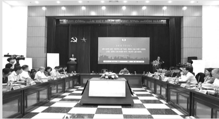
● Nhiều giải pháp được đưa ra tại Hội thảo nhằm phát triển đời sống vật chất, tinh thần cho công nhân trong tình hình mới.

Tại Hội thảo “Xây dựng môi trường an toàn, nâng cao chất lượng sống cho đoàn viên, người lao động” do Tổng Liên đoàn Lao động Việt Nam phối hợp với Báo Lao động tổ chức ngày 17/4, các đại biểu đã đưa ra nhiều giải pháp nhằm bảo đảm an ninh trật tự, an toàn lao động, xây dựng và phát triển đời sống vật chất, tinh thần cho công nhân trong tình hình mới.