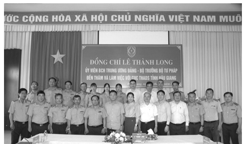
● Tập thể, lãnh đạo Cục THADS tỉnh Hậu Giang chụp ảnh lưu niệm với Bộ trưởng và Đoàn Công tác.

Kết luận buổi làm việc với Cục THADS tỉnh Hậu Giang,