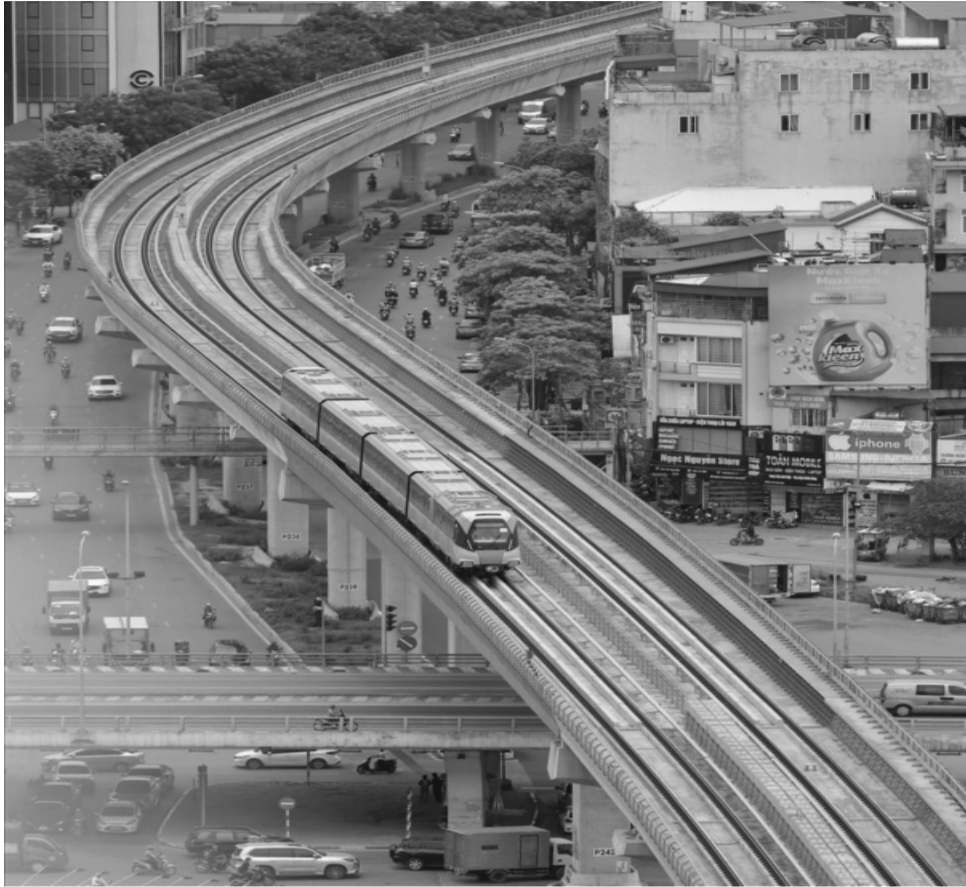
● Dự án tuyến ĐSDT số 3, đoạn Nhổn - ga Hà Nội vừa hoàn thành tuần thứ tư của giai đoạn vận hành thử nghiệm.