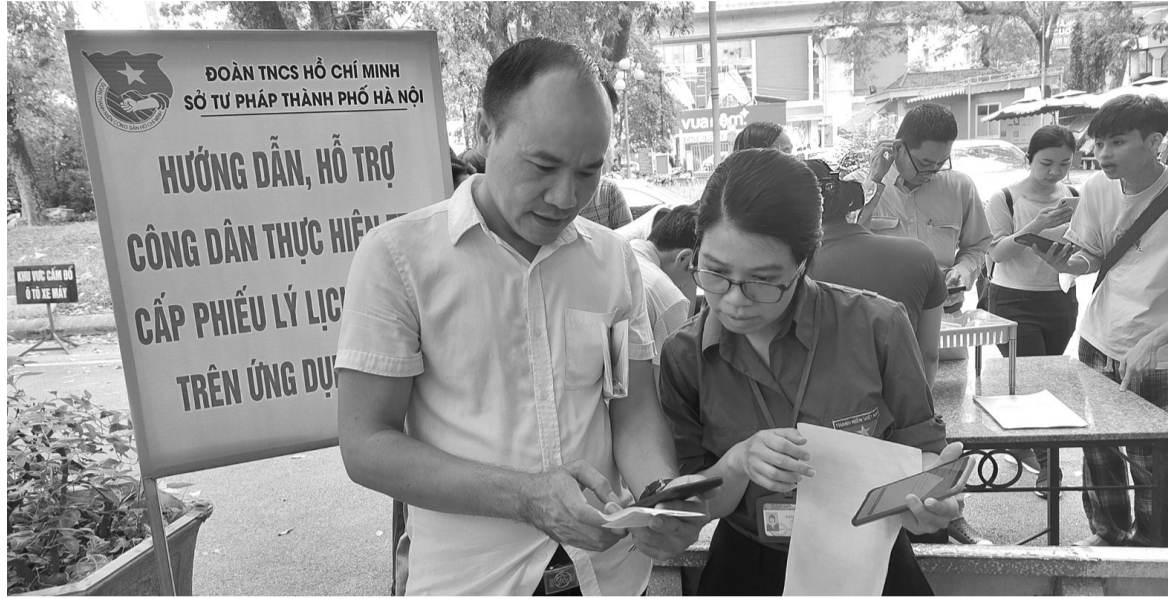
● Đoàn viên Sở Tư pháp Hà Nội hỗ trợ người dân. (Ảnh: PV)

Cấp Phiếu LLTP trên ứng dụng VNeID được thực hiện thí điểm nhằm tạo điều kiện cho công dân có thêm lựa chọn phương thức yêu cầu cấp Phiếu bên cạnh phương thức yêu cầu cấp Phiếu LLTP qua hệ thống thông tin giải quyết thủ tục hành chính của TP Hà Nội ( https://dichvucong.hanoi.gov.vn ), qua hệ thống bưu chính công ích và nộp hồ sơ trực tiếp tại Bộ phận Một cửa của Sở Tư pháp.