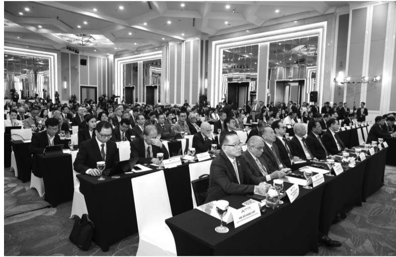
●Diễn đàn Tương lai ASEAN 2024 với chủ đề "Xây dựng Cộng đồng ASEAN phát triển nhanh, bền vững, lấy người dân làm trung tâm" là một sáng kiến quan trọng do Thủ tướng Phạm Minh Chính đề xuất tại Hội nghị cấp cao ASEAN lần 43 vào tháng 9/2023.

Để thực hiện Tầm nhìn Cộng đồng ASEAN 2045, Thủ tướng đề nghị thực hiện 5 tăng cường. Đó là tăng cường đoàn kết, hợp tác, thống nhất trong đa dạng, nêu cao tính độc lập, tự cường, tự chủ chiến lược của ASEAN. Tăng cường tin cậy chiến lược trong ASEAN và trong quan hệ với các đối tác, góp phần ngăn ngừa xung đột, duy trì một môi trường hòa bình, an ninh, ổn định và thịnh vượng