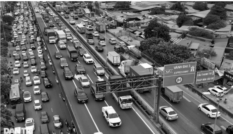
● Ủy ban Thường vụ Quốc hội cho ý kiến bước đầu về Báo cáo kết quả giám sát chuyên đề việc thực hiện chính sách, pháp luật về bảo đảm trật tự, an toàn giao thông.

Đây là ý kiến được Chủ nhiệm Ủy ban Tư pháp của Quốc hội Lê Thị Nga đưa ra tại phiên họp của Ủy ban Thường vụ Quốc hội sáng 23/4, cho ý kiến bước đầu về Báo cáo kết quả giám sát chuyên đề việc thực hiện chính sách, pháp luật về bảo đảm trật tự, an toàn giao thông từ năm 2009 đến hết năm 2023.