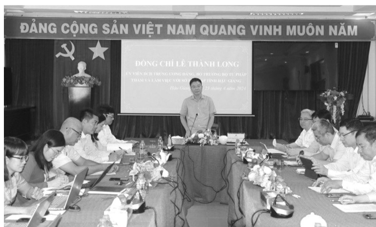
● Bộ trưởng Lê Thành Long phát biểu tại buổi làm việc với Sở Tư pháp tỉnh Hậu Giang.

Bộ trưởng thông tin, trong thời gian tới sẽ tiếp tục sửa đổi, bổ sung nhiều luật liên quan đến quản lý của ngành như Luật Đầu giá tài sản, Luật Công chứng, Luật Luật sư... Từ đó, Bộ trưởng chỉ đạo Tư pháp địa phương cần thiết thực nghiên cứu, đóng góp cho xây dựng, hoàn thiện các luật này. Theo Bộ trưởng, vấn đề ứng