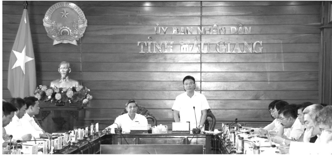
● Bộ trưởng Bộ Tư pháp Lê Thành Long đề nghị tỉnh Hậu Giang tập trung thực hiện những nhiệm vụ trọng tâm trên cơ sở kế hoạch phát triển kinh tế - xã hội của địa phương.

Qua đó, quý I/2024, tình hình kinh tế - xã hội trên địa bàn tỉnh đạt nhiều kết quả quan trọng. Tốc độ tăng trưởng kinh tế GRDP đạt 6,83%, đứng thứ 2