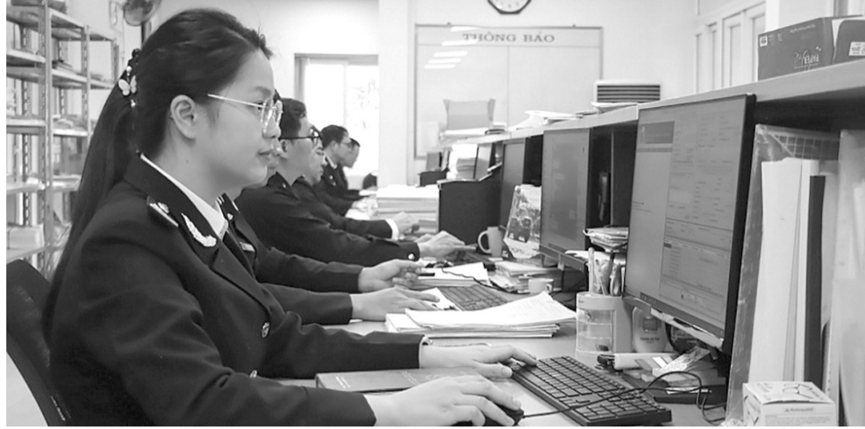
● Hiện đại hóa công tác hải quan để tạo thuận lợi thương mại. (Ảnh minh họa - T.Binh)

Tuy nhiên, dự báo thời gian tới tình hình thế giới tiếp tục diễn biến phức tạp, khó lường; ở trong nước hoạt động sản xuất kinh doanh còn nhiều khó khăn. Để tiếp tục đẩy mạnh, nâng cao hơn nữa hiệu quả công tác chuyển đổi số trong lĩnh vực hải quan góp phần thúc đẩy xuất nhập khẩu, tiết kiệm chi phí, tạo thuận lợi hơn nữa cho người dân, DN, đồng thời tăng cường hiệu quả quản lý nhà nước trong lĩnh vực hải quan, Thủ tướng Chính phủ yêu cầu Bộ Tài chính, Tổng cục Hải quan rà soát, hoàn thiện chính