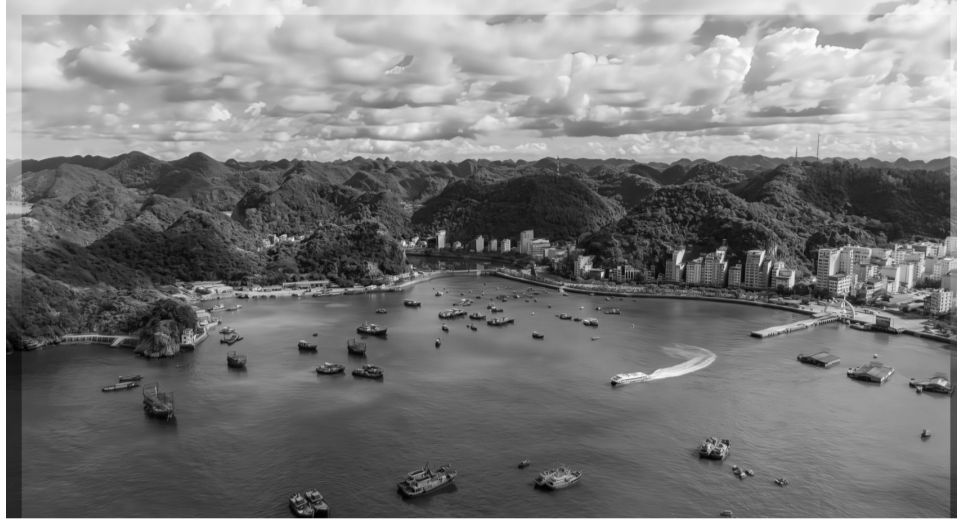
● Du lịch Việt Nam cần đầu tư về chất lượng hơn số lượng. (Ảnh minh họa - Hồ Tùng Phương)

Giá rẻ có thể đồng nghĩa với việc du lịch phát triển ồ ạt, kéo theo lượng lớn du khách cả trong và ngoài nước đến Việt Nam. Bên cạnh việc kích cầu, thu hút khách du lịch, ngược lại, du lịch đại