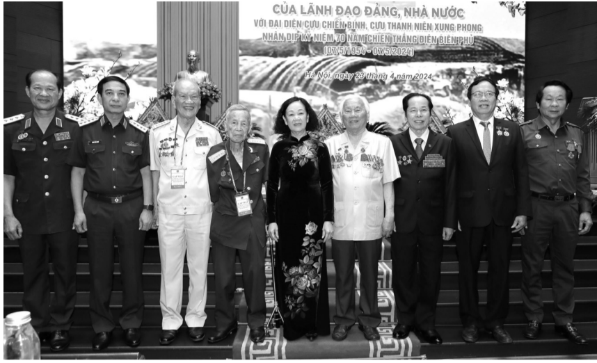
● Ủy viên Bộ Chính trị, Thường trực Ban Bí thư, Trưởng Ban Tổ chức Trung ương Trương Thị Mai và các đại biểu tại buổi gặp mặt.

Kỷ niệm 70 năm Chiến thắng Điện Biên Phủ là dịp toàn Đảng, toàn quân, toàn dân tiếp tục phát huy truyền thống cách mạng, tinh thần yêu nước, lòng tự hào và sức mạnh đại đoàn kết toàn dân tộc. Cuộc gặp mặt lần này là hoạt động sâu sắc, thiết