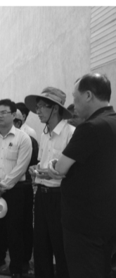
● Các bên đã thống nhất sẽ bảo đảm cung ứng nước cho dân trước ngày 10/5/2024.

Cao tốc Phan Thiết - Dầu Giây khởi công tháng 9/2020, tổng mức đầu tư hơn 12.500 tỷ đồng, quy mô 6 làn xe. Do thuộc diện đầu tư công, việc thu phí cao tốc này phải chờ quy định mới. Bộ GTVT và Bộ Tài chính đang hoàn thiện đề án thu phí sử dụng đường bộ đầu tư công để trình Chính phủ xem xét, báo cáo Ủy ban Thường vụ Quốc hội. VĂN SON