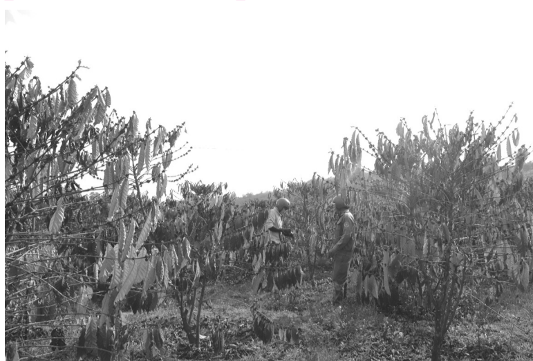
Hơn 600ha cà phê có hiện tượng cháy, rụng lá tại huyện Di Linh.

Huyện Di Linh, "thủ phủ cà phê" của Lâm Đồng đang trải qua đợt khô hạn gay gắt khiến nhiều hồ đập, suối cạn nước; hơn 600ha cà phê có hiện tượng cháy, rụng lá; khoảng 55ha lúa nguy cơ bị thiệt hại hoàn toàn.