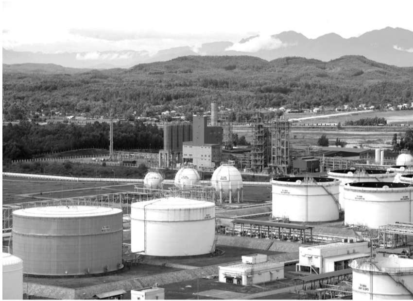
● Nhà máy lọc dầu Dung Quất - nơi cung cấp hơn 30% nhu cầu xăng dầu hàng năm cho thị trường trong nước.

Ở trong nước, lãnh đạo PVN nhìn nhận, tăng trưởng kinh tế quý I tích cực, tuy nhiên, khu vực sản xuất vẫn cho thấy có nhiều khó khăn; khả năng hấp thụ vốn của nền kinh tế yếu, tăng trưởng tín dụng thấp. Thị trường năng lượng biến động mạnh, giá dầu ở mức cao