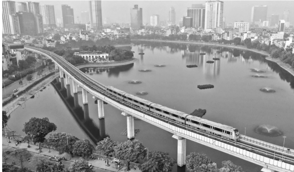
● Tuyến đường sắt Cát Linh - Hà Đông.

Thực tế cho thấy, một trong những vướng mắc lớn nhất cần giải quyết để thực hiện các dự án ĐSĐT là nguồn vốn lên đến hàng tỷ USD. Trong đó, theo tính toán, nếu xây dựng đủ 10 tuyến ĐSĐT theo quy hoạch, TP Hà Nội sẽ cần khoảng 37 tỷ USD (khoảng hơn 940.000 tỷ đồng).