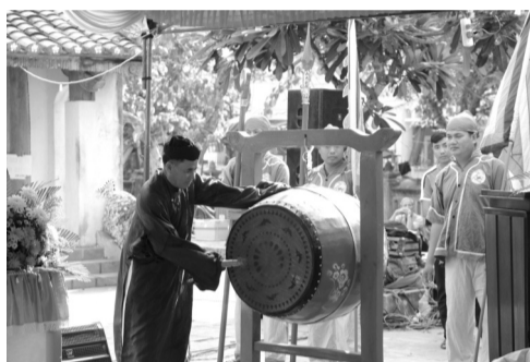
● Lễ khao lễ thể lính Hoàng Sa là di sản văn hóa phi vật thể quốc gia.

Huyện đảo Lý Sơn hiện có khoảng 500 tàu thuyền với hàng ngàn ngư dân lao động nghề biển, trong đó hơn 100 tàu đánh bắt xa bờ. Cùng với sự hỗ trợ của Nhà nước, ngư dân Lý Sơn luôn đầu tư nâng cấp, cải hoán tàu thuyền, trang bị các phương tiện đánh bắt hiện đại, vươn khơi bám biển.