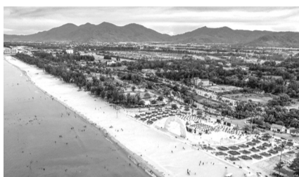
● Bãi biển Xuân Thành nhìn từ trên cao.