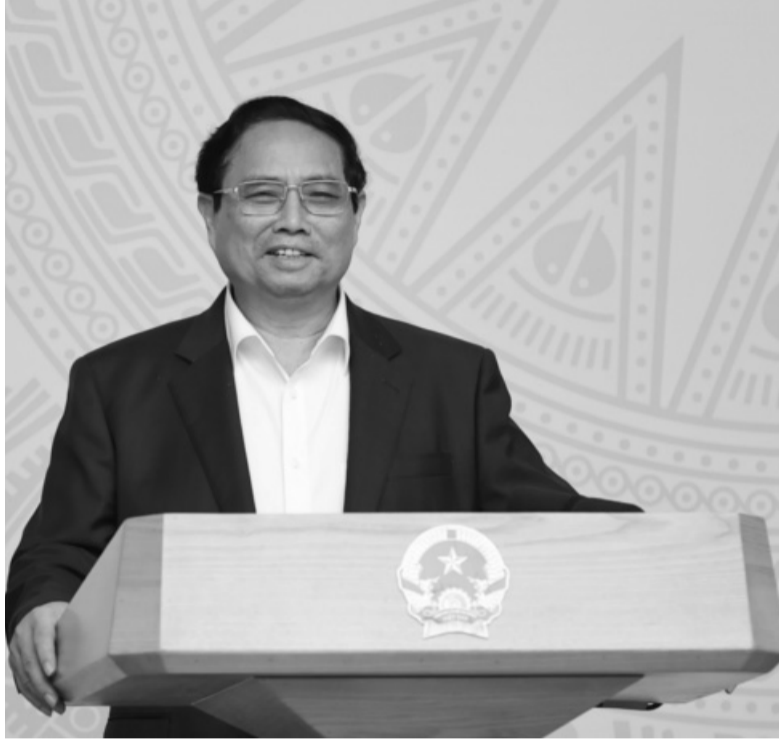
● Thủ tướng Phạm Minh Chính yêu cầu tăng ít nhất 5 bậc chỉ số phát triển Chính phủ điện tử của Liên Hợp quốc.