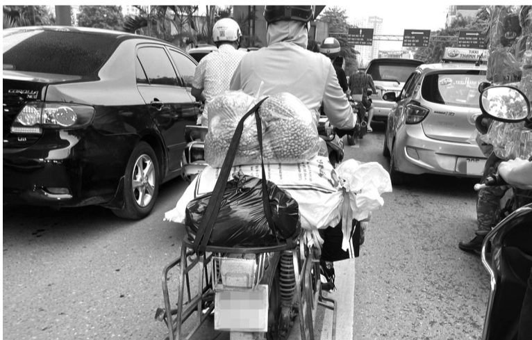
● Nhiều xe máy cũ được "tân trang" để chờ hàng hóa. (Ảnh: PV)

Các phương tiện trên luôn là nỗi ám ảnh của người tham gia giao thông, bởi không bảo đảm an toàn kỹ thuật, gây nguy hiểm, mất trật tự an toàn giao thông. Không những vậy, việc nhiều phương tiện cá nhân không được bảo trì, bảo dưỡng đúng kỳ hạn đã dẫn đến lượng khí thải thải ra môi trường tăng cao, làm gia tăng mức độ ô nhiễm.