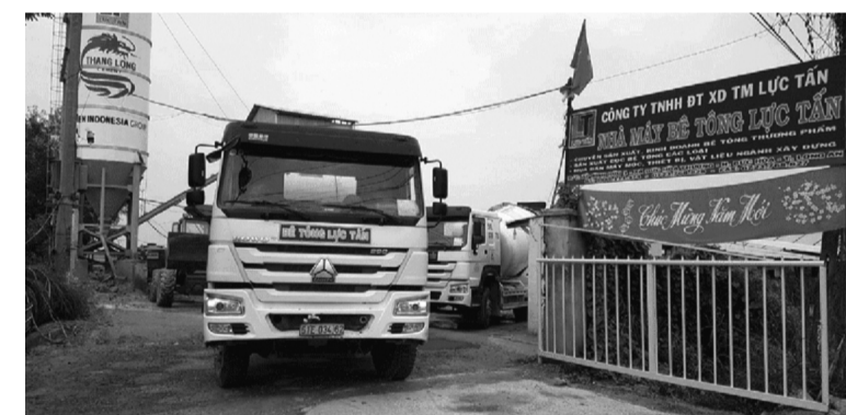
● Trạm trộn bê tông và trạm điện (nằm sát nhau, bên trái) của Cty Lực Tấn đến nay vẫn chưa được bồi thường.