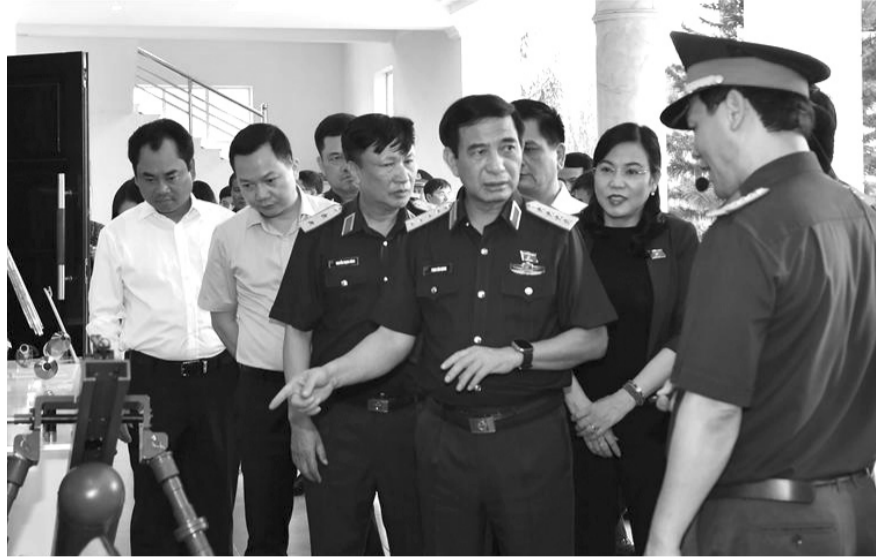
● Đại tướng Phan Văn Giang tham quan Nhà máy Z131 (Tổng cục CNQP).

Mới đây Đại tướng Phan Văn Giang, Ủy viên Bộ Chính trị, Bộ trưởng Bộ Quốc phòng cùng các đại biểu Quốc hội tỉnh Thái Nguyên đã có buổi tiếp xúc cử tri chuyên đề lấy ý kiến vào dự thảo Luật Công nghiệp quốc phòng, an ninh và Động viên công nghiệp trên địa bàn Thái Nguyên trước Kỳ họp thứ 7, Quốc hội khóa XV.