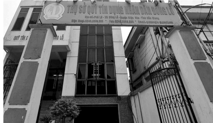
● Trụ sở QTDND Đông Lỗ tại xã Đông Lỗ.

Hợp đồng nêu rõ: “Bên A đồng ý bán cho bên B toàn bộ số đất bãi Đồng Vân ở thôn Cẩm Vân”. Đơn giá bên A bán cho bên B là 19.500 đồng/m 3 . Bên B sau khi nhận mặt bằng sẽ tiến hành cải tạo và khai thác triệt để khu đất. Số tiền thu được để trả gốc và lãi vào các hợp đồng đang còn dư nợ tại QTDND Đông