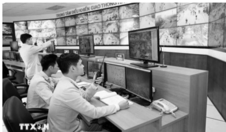
● Trung tâm điều khiển giao thông Hà Nội, nơi theo dõi các phương tiện vi phạm qua camera.