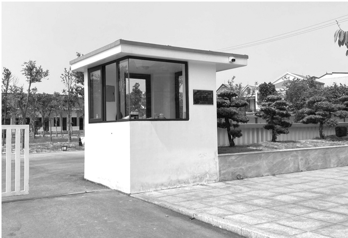
● Hệ thống xử lý Nhà máy nước Hưng Vinh đã sử dụng hơn 20 năm.

Về nguyên nhân yếu nước và mất nước, thông tin từ phía Nhà máy nước Nghệ An, do nguồn nước từ 3 nhà máy không đủ đáp ứng nhu cầu sử dụng của