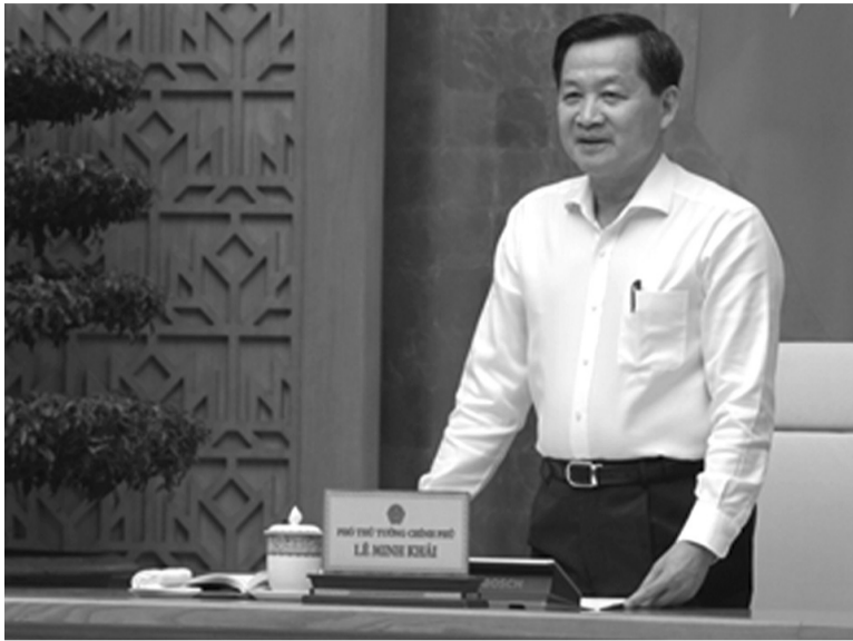
● Phó Thủ tướng - Trưởng Ban Chỉ đạo điều hành giá Lê Minh Khái chỉ đạo tại Hội nghị.

phương cần chủ động theo dõi sát diễn biến cung - cầu, thị trường, giá cả các mặt hàng thiết yếu để có giải pháp bình ổn thị trường phù hợp, nhất là đối với xăng dầu và các mặt hàng chiến lược có khả năng bị ảnh hưởng từ sự đứt gãy chuỗi cung ứng toàn cầu và xung đột căng thẳng địa chính trị gia tăng.