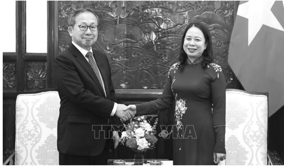
● Quyền Chủ tịch nước Võ Thị Ánh Xuân tiếp Đại sứ Nhật Bản Yamada Takio đến chào từ biệt, kết thúc nhiệm kỳ công tác tại Việt Nam.

Quyền Chủ tịch nước vui mừng khi hợp tác kinh tế, thương mại song phương tiếp tục đi vào chiều sâu, hiệu quả, là trụ cột chính của hai nước với nhiều cơ hội, lĩnh vực mới được mở ra. Thời gian tới, Quyền Chủ tịch nước