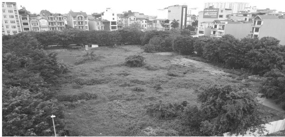
● Dự án của Cty CP Thương mại Hà Nội chậm đưa đất vào sử dụng.

Trả lời kiến nghị cử tri, tại Văn bản 2062/STNMT-QLĐĐ,ĐD&BD ngày 1/12/2023 của Sở TN&MT nêu: Cty CP Thương mại Hà Nội đang hoàn thiện hồ sơ gia hạn thời gian sử dụng đất (SDD) theo