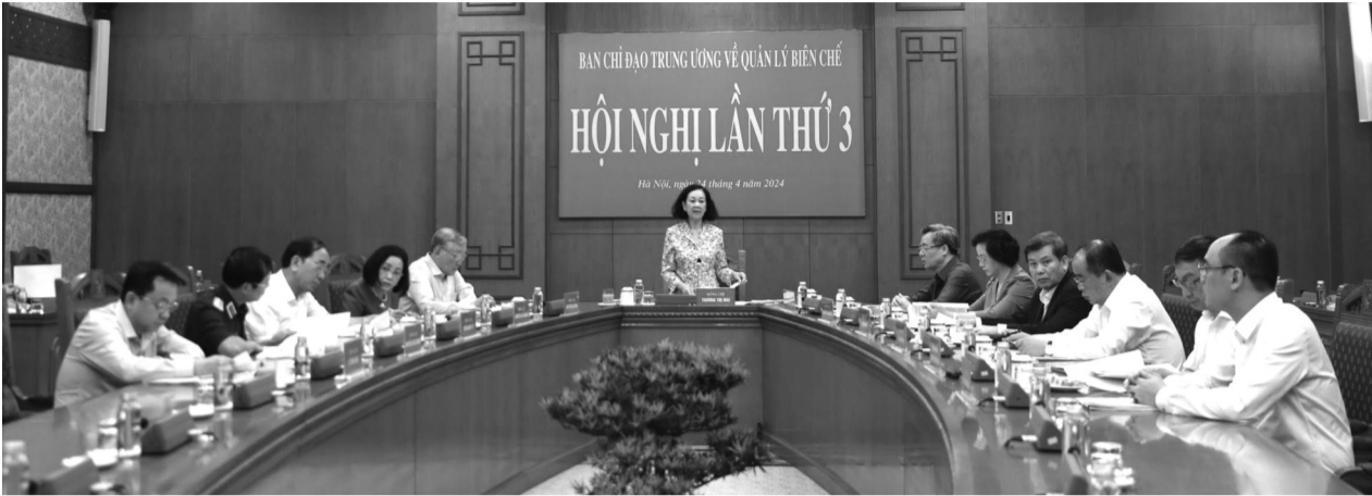
● Ban Chỉ đạo Trung ương về quản lý biên chế đánh giá kết quả đạt được và hạn chế, đồng thời xác định một số nhiệm vụ trọng tâm đến năm 2026.

Hôm qua (24/4), tại Trụ sở Văn phòng Trung ương Đảng đã diễn ra Hội nghị Ban Chỉ đạo Trung ương về quản lý biên chế (Phiên họp thứ 3). Ủy viên Bộ Chính trị, Thường trực Ban Bí thư, Trưởng Ban Tổ chức Trung ương, Trưởng Ban Chỉ đạo Trung ương về quản lý biên chế Trương Thị Mai chủ trì Hội nghị.