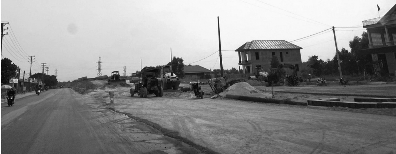
● Đơn vị thi công dự án đường cứu hộ, cứu nạn Phong Điền - Điền Lộc đẩy nhanh tiến độ để hoàn thành tuyến đường cứu hộ trong năm 2024.