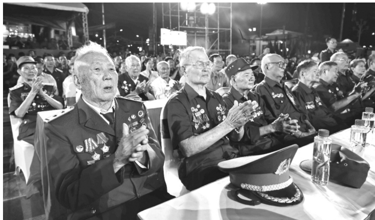
● Các đại biểu cựu chiến binh Chiến sĩ Điện Biên, thanh niên xung phong, dân công hỏa tuyến trực tiếp tham gia chiến dịch Điện Biên Phủ tham dự chương trình.

nghĩa anh hùng cách mạng, sức mạnh đại đoàn kết toàn dân tộc, bản lĩnh và trí tuệ Việt Nam, ý chí quyết chiến, quyết thắng và sức mạnh của Quân đội nhân dân, Lực lượng Vũ trang nhân dân Việt Nam, trong đó có sự đóng góp tích cực, to lớn của thanh niên.