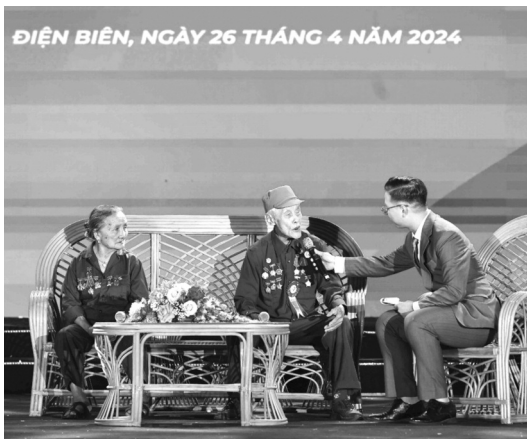
● Giao lưu với cựu chiến binh Chiến sĩ Điện Biên.

Hành trình “Điện Biên Phủ - Khát vọng non sông” của cán bộ Đoàn, đoàn viên, thanh niên, sẽ đồng thời diễn ra Hành trình “Tôi yêu Tổ quốc tôi” của cán bộ, hội viên Hội Liên hiệp Thanh niên Việt Nam, Hành trình “Sinh viên với khát vọng non sông” của cán bộ Hội, hội viên Hội Sinh viên Việt Nam và Liên hoan “Chiến sĩ nhỏ Điện Biên” toàn quốc lần thứ 5, năm 2024 do Hội đồng Đội Trung ương tổ chức, với khoảng 550 đại biểu ưu tú, xuất sắc từ cả nước về tham gia.