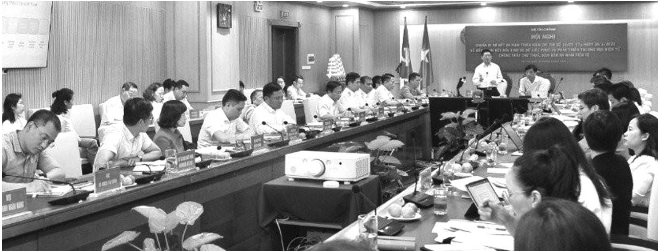
● Lãnh đạo Bộ Tài chính phát biểu tại cuộc họp.