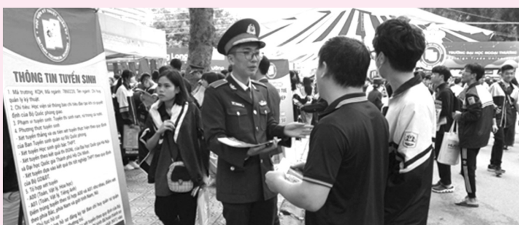
● Tuổi trẻ Học viện Kỹ thuật Quân sự tham gia Ngày hội tư vấn tuyển sinh - hướng nghiệp 2024.

Hôm qua (26/4), Ban Tuyển sinh Quân sự Bộ Quốc phòng đã tổ chức buổi gặp mặt báo chí giới thiệu công tác Tuyển sinh Quân sự năm 2024. Năm 2023, 17 trường quân đội tuyển gần 4.400 chỉ tiêu. Trường Sĩ quan Lục quân 1 là đơn vị tuyển sinh nhiều nhất (494 chỉ tiêu), kế đến là Học viện Kỹ thuật Quân sự (458). Chỉ tiêu tuyển sinh năm 2024 là 5.212, tăng 900 chỉ tiêu so với 2023.