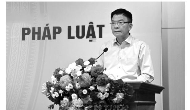
● Bộ trưởng Lê Thành Long nêu rõ, Luật Ban hành VBQPPL đã có những đóng góp cơ bản trong phát triển kinh tế - xã hội, quốc phòng - an ninh.