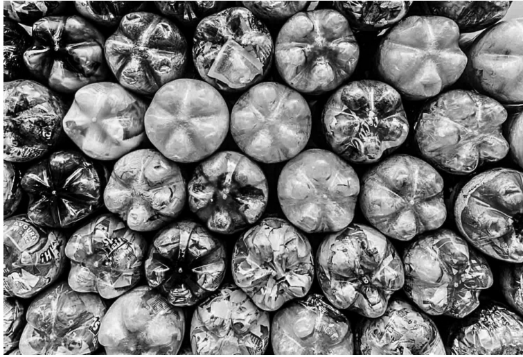
● Giải quyết ô nhiễm nhựa là một trong những vấn đề bức thiết hiện nay.

Sau ba phiên đàm phán trước, các thành viên mới chỉ đưa ra được bản dự thảo về một thỏa thuận chung nhằm loại bỏ ô nhiễm nhựa, tuy nhiên có thể chưa phản