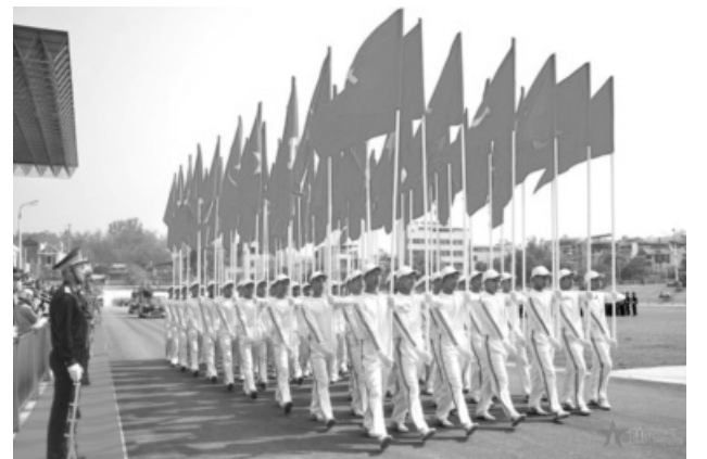
● Đi đầu là khối cờ Đảng, cờ Tổ quốc.

Hôm qua (26/4), tại sân vận động tỉnh Điện Biên (TP Điện Biên Phủ, tỉnh Điện Biên), Tiểu ban diễu binh, diễu hành tiến hành hợp luyện các lực lượng tham gia diễu binh, diễu hành kỷ niệm 70 năm Chiến thắng Điện Biên Phủ (7/5/1954 - 7/5/2024).