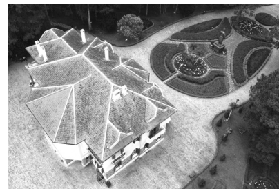
● Toàn cảnh Dinh I nhìn từ trên cao.

Lãnh đạo UBND tỉnh cho hay, sự việc ở dự án Dinh I kéo dài từ 2021, tỉnh chỉ đạo nhiều lần nhưng một số bên không thực hiện được và nay phải giải quyết dứt điểm.