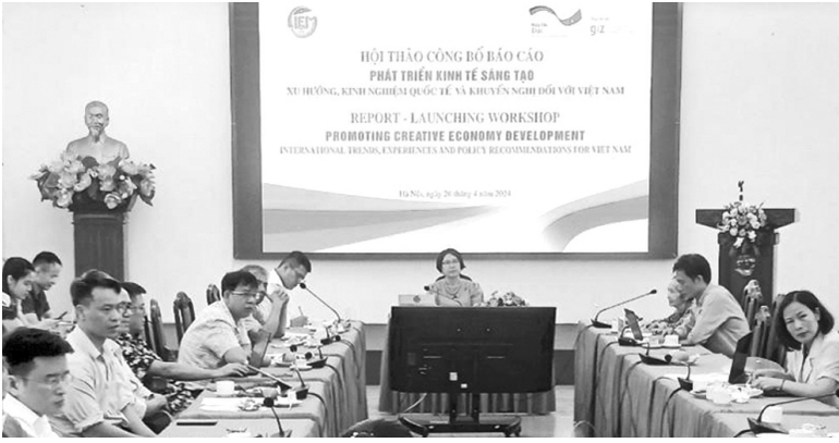
● Nghiên cứu của CIEM chỉ ra rằng, Việt Nam đã bước đầu có khung chính sách liên quan đến phát triển kinh tế sáng tạo. (Quang cảnh Hội thảo)

Khẳng định tiềm năng phát triển của kinh tế sáng tạo (KTST) rất lớn, theo các chuyên gia, Việt Nam cần hoàn thiện khung chính sách vững chắc để nuôi dưỡng KTST.