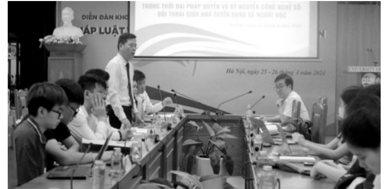
● Tọa đàm là cơ hội rất lớn để sinh viên, nghiên cứu sinh đón nhận những chia sẻ về nghề nghiệp, kỹ năng, kinh nghiệm của các diễn giả, chuyên gia.

Trao đổi tại Tọa đàm, Thẩm phán cao cấp Chu Thành Quang, Phó Chánh án TAND cấp cao tại Hà Nội cho biết, toàn ngành Tòa án hiện có khoảng 6.500 thẩm phán, còn thiếu nhiều so với số lượng biên chế được giao và lượng việc ngày một tăng (khoảng 600.000 vụ việc). Ngoài ra, Luật Tổ chức TAND đang được sửa đổi với rất nhiều điểm mới như thành lập tòa án chuyên biệt; đổi mới TAND cấp tỉnh, cấp huyện theo thẩm quyền xét xử... Vì vậy, cơ hội nghề nghiệp cho các bạn sinh viên luật là rất lớn.