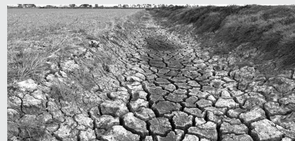
● Mương nước nội đồng ở xã Đại Ân 2 (huyện Trần Đề, tỉnh Sóc Trăng) trơ đáy, khô, nứt nẻ.

Xâm nhập mặn có xu hướng ảnh hưởng đến nguồn nước ngọt tại Đồng bằng sông Cửu Long sớm hơn trước 1 - 1,5 tháng, gay gắt và bất thường, theo báo cáo về công tác phòng, chống hạn hán, xâm nhập mặn vùng Đồng bằng sông Cửu Long của Cục Thủy lợi (Bộ NN&PTNT).