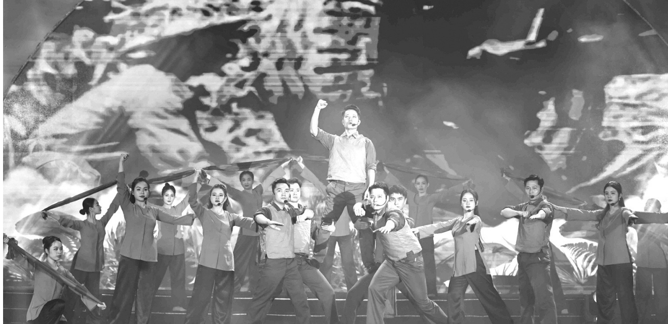
● Một tiết mục trong Chương trình giao lưu nghệ thuật “Điện Biên Phủ - Khát vọng non sông”.

Tối 26/4, tại quảng trường thành phố Điện Biên Phủ, Tổng cục Chính trị Quân đội nhân dân Việt Nam, Trung ương Đoàn Thanh niên Cộng sản Hồ Chí Minh và tỉnh Điện Biên phối hợp tổ chức Chương trình giao lưu nghệ thuật với chủ đề “Điện Biên Phủ - Khát vọng non sông”.