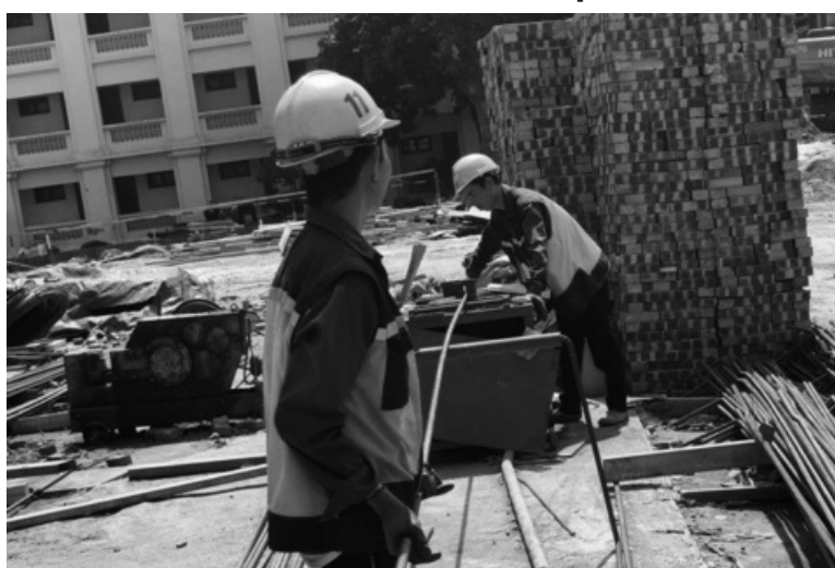
● Biến đổi khí hậu đang tác động nghiêm trọng đến an toàn và sức khỏe của người lao động ở khu vực châu Á - Thái Bình Dương.

Theo bà Chihoko Asada-Miyakawa, BĐKH đang tác động nghiêm trọng đến an toàn và sức khỏe của người lao động ở khu vực châu Á - Thái Bình Dương. Từ những đợt nắng nóng khắc nghiệt đến chất lượng không khí tồi tệ, người lao động phải gánh