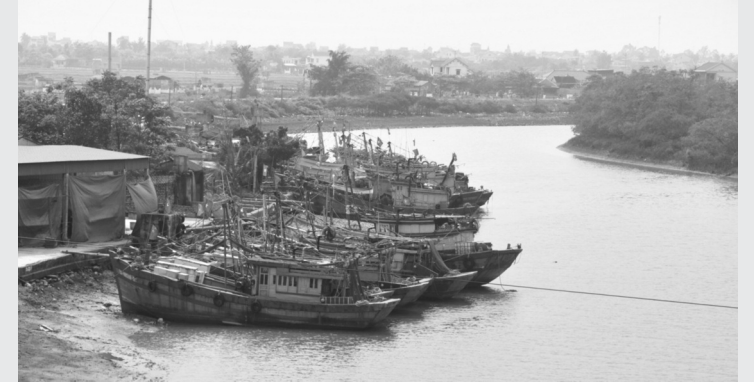
● Cửa biển Lạch Vạn đang ngày càng bị thu hẹp do phù sa bồi lắng.

Cửa biển Lạch Vạn là 1 trong 6 cửa lạch lớn nhất của tỉnh Nghệ An, đồng thời là tuyến đường thủy quan trọng để tàu thuyền của ngư dân các xã Diễn Ngọc, Diễn Bích, Diễn Thành, Diễn Kim, Diễn Vạn... ra khơi, phát triển kinh tế biển. Thời gian qua, tình trạng phù sa bồi lắng tại cửa biển Lạch Vạn đang ngày càng trở nên nghiêm trọng, tiềm ẩn nguy cơ gây mất an toàn cho các phương tiện lưu thông ra, vào lạch.