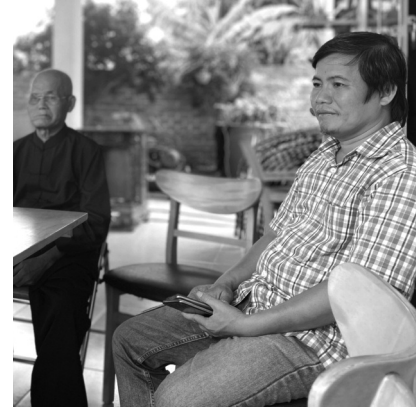
● Ông Lê (bên trái) và con trai nhiều năm nay đề nghị cơ quan chức năng làm rõ sự việc.

Dự án KCN Xuyên Á sau đó mắc nhiều vi phạm, sai phạm, đã được Thanh tra tỉnh Long An chỉ ra trong Kết luận Thanh tra số 61/KL-TT ngày 24/8/20025; một số cá nhân trong Cty