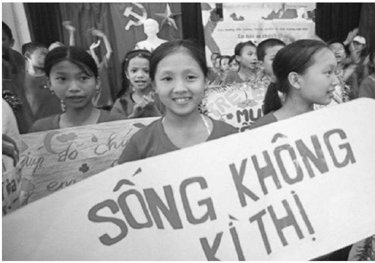
● Cán giáo dục nhận thức cho giới trẻ về việc không phân biệt kì thị vùng miền. (Ảnh minh họa - Nguồn: PLVN)

Trước đó, một tài khoản Tiktok tên H.M cũng đã đưa những thông tin mang tính phân biệt vùng miền tương tự. Trong một clip đăng tải vào năm 2022 với tựa đề “Bạn nghĩ sao về người miền Trung”, H.M đã có nhiều câu nói sai sự thật, kém văn hóa, xúc phạm người dân miền Trung như “người miền Trung rất keo kiệt và bủn xỉn, hà tiện, khôn lỏi, lúc nào cũng nghĩ cho bản thân, gia đình của họ trước, không có tinh thần xã hội,