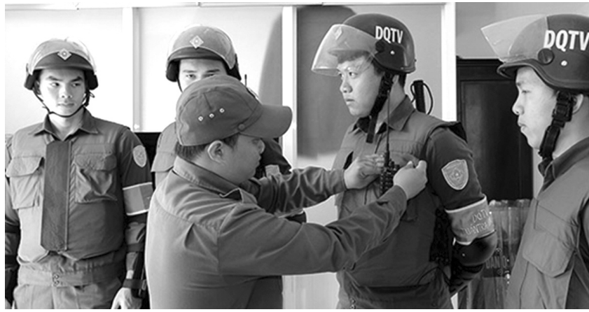
●Dàn quân thường trực Ban Chỉ huy quân sự thị xã Long Khánh, tỉnh Đồng Nai chuẩn bị lên đường làm nhiệm vụ.

Công dân được xét tuyển để đề nghị công nhận là Tổ viên Tổ bảo vệ ANTT phải được quá nửa tổng số thành viên Hội đồng xét tuyển có mặt