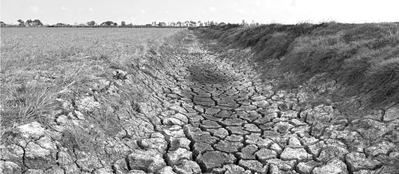
●Mương nước nội đồng ở xã Đại Ân 2 (huyện Trần Đề, tỉnh Sóc Trăng) trơ đáy, khô, nứt nẻ.

Xâm nhập mặn có xu hướng ảnh hưởng đến nguồn nước ngọt tại Đồng bằng sông Cửu Long (ĐBSCL) sớm hơn trước 1 - 1,5 tháng, gay gắt và bất thường, theo báo cáo về công tác phòng, chống hạn hán, xâm nhập mặn vùng ĐBSCL của Cục Thủy lợi (Bộ NN&PTNT).