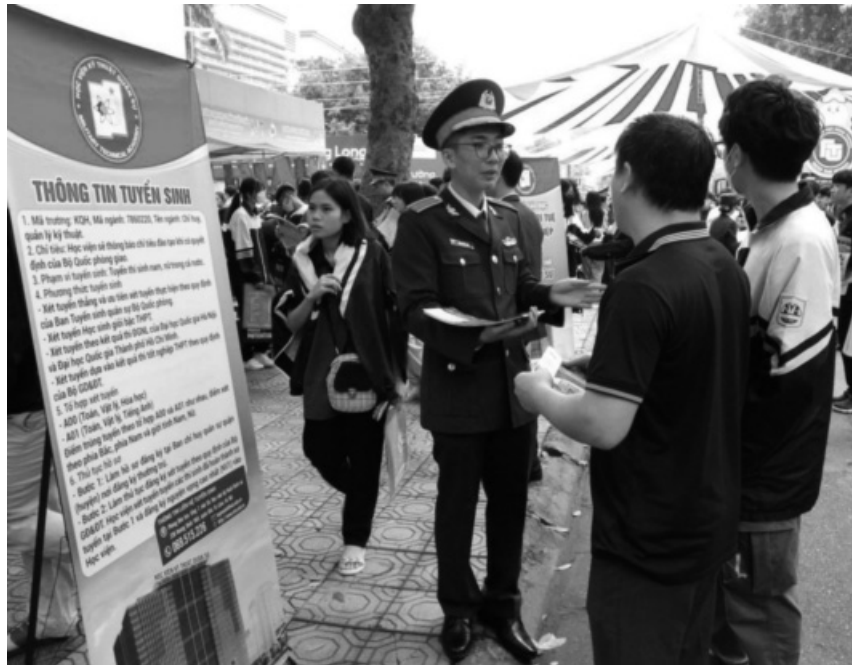
● Tuổi trẻ Học viện Kỹ thuật Quân sự tham gia Ngày hội tư vấn tuyển sinh - hướng nghiệp 2024.

Bên cạnh đó, thí sinh có thể đổi tổ hợp xét tuyển giữa các trường