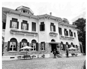
● Dinh I trước và sau khi được đầu tư, đưa vào khai thác phục vụ du lịch.

Ngoài yêu cầu ngừng kinh doanh tại Dinh I, tại Văn bản 113/TB-UBND, UBND tỉnh Lâm Đồng còn yêu cầu Cty CP Hoàn Cầu Đà Lạt thống kê tài sản đất, nhà và các công trình, cây cảnh, vật kiến trúc, hiện vật bàn giao cho UBND Đà Lạt trước 10/5; phối hợp UBND Đà Lạt hoàn thành thủ tục thanh lý hợp đồng thuê nhà, thanh lý tài sản trước 20/5.