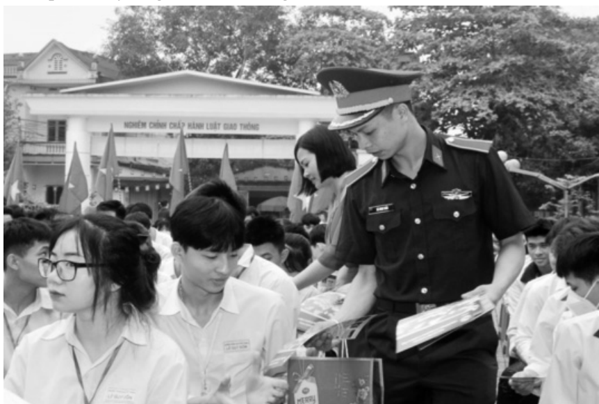
● Học viện Trường Sĩ quan Chính trị phát tài liệu tư vấn TSQS tại Trường THPT Lê Quý Đôn (huyện Trấn Yên, tỉnh Yên Bái).

Ngay sau đó, đội quy tập mộ liệt sĩ Quân đoàn 3 đã tiến hành xác minh, khai quật phát hiện hài cốt liệt sĩ được chôn tại vị trí trên. Quá trình tìm kiếm phát hiện được một số hài cốt cùng nhiều di vật của bộ đội giải phóng như tang, ni lông, vải dù, thìa nhôm, đế dép cao su, dây thông tin, dây dù, vỏ đạn AK. UYÊN THU