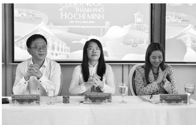
● Họp báo thông tin Lễ hội Sông nước TP HCM lần thứ 2.

Tiếp nối thành công của Lễ hội Sông nước TP HCM lần thứ 1, lễ hội năm nay với chủ đề “Chuyến tàu huyền thoại” sẽ diễn ra từ ngày 31/5 - 9/6/2024.