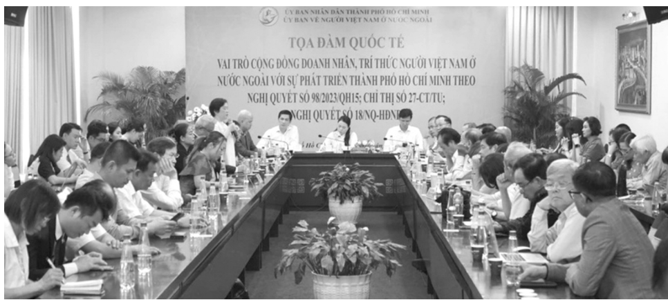
● Cộng đồng doanh nhân, trí thức người Việt ở nước ngoài hiến kế cho TP HCM thực hiện thành công Nghị quyết 98 của Quốc hội.

TP HCM cũng đang thiếu các tập thể khoa học mạnh, các chuyên gia đầu ngành; chưa tạo được sản phẩm KH&CN thực sự mang tính đột phá, chủ lực; cơ chế, chính