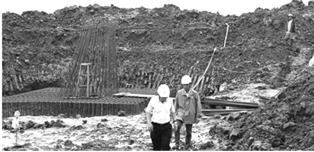
● Yêu cầu thi công đường dây mạch 3 phải bảo đảm tiến độ và an toàn.

Theo đại diện EVN, để phân đầu hoàn thành dự án đúng tiến độ, EVN đã tiếp tục kiến nghị UBND các tỉnh xem