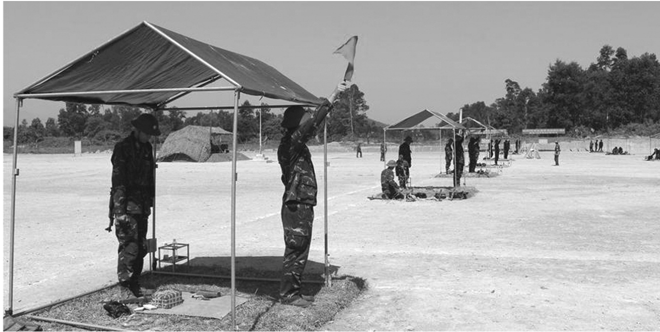
● Dựng các lều lán chống nắng khi luyện tập. (Ảnh: Lam Hạnh)

Mùa nắng nóng đã ảnh hưởng không nhỏ đến hoạt động của các đơn vị trong quân đội. Trước tình hình đó, các cơ quan, đơn vị đã triển khai nhiều biện pháp phòng, chống nắng nóng hiệu quả, góp phần bảo đảm tốt sức khỏe cho bộ đội trong thực hiện các nhiệm vụ.