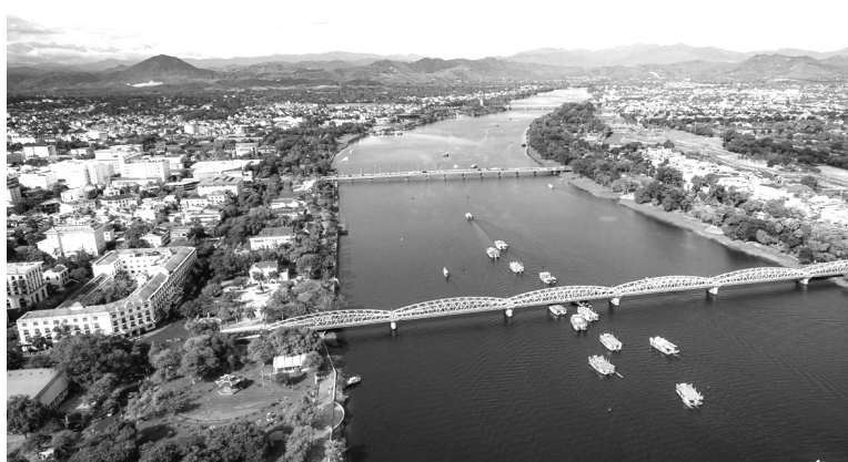
● Đô thị Huế đổi thay từng ngày theo hướng "mở", văn minh, thân thiện môi trường.

Năm 2023, với nhiều cơ hội và thách thức đan xen nhưng với sự đoàn kết, phấn đấu của cả hệ thống chính trị, Nhân dân trên địa bàn nên tình hình kinh tế - xã hội (KT-XH) của TP Huế tiếp tục chuyển biến tích cực, 12/12 chỉ tiêu đạt và vượt kế hoạch. Đáng chú ý, thu ngân sách đạt trên 100%; tốc độ tăng trưởng giá trị sản xuất tăng 12%, doanh thu du lịch đạt 4.585 tỷ đồng - đạt 186%