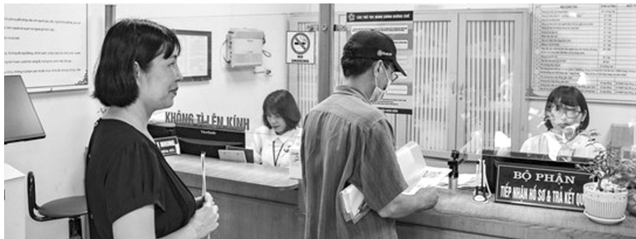
Người dân thực hiện thủ tục hành chính tại Bộ phận tiếp nhận và trả kết quả UBND quận Hoàn Kiếm, Hà Nội.

Tại cuộc họp, các địa phương kiến nghị các Bộ, ngành Trung ương đẩy nhanh việc ban hành một số văn bản hướng dẫn, trong đó có quy định về định mức kinh tế kỹ thuật đối với nội dung chi cho hoạt