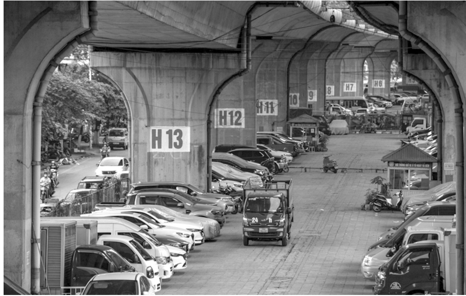
● Điểm trông giữ phương tiện tạm thời dưới gầm cầu Vĩnh Tuy.

cộng, áp lực giao thông tăng từng giờ, từng phút đè nặng lên hạ tầng giao thông của TP Hà Nội. Hiện nay, việc sử dụng vỉa hè, lòng đường làm nơi dừng đỗ xe đã trở thành lời giải tạm thời cho “bài toán” này. Theo báo cáo chưa hoàn chỉnh (mới có thông tin từ 17/30 địa phương được thống kê), UBND các quận, huyện, thị xã đã cấp phép sử dụng tạm thời hè đường, lòng đường để trông giữ xe tại 422 điểm, với tổng diện tích là 93.300m 2 . Sở Giao thông vận tải (GTVT) đã cấp phép sử dụng tạm thời lòng đường để trông giữ xe cho 40 đơn vị tại 214 vị trí, với tổng diện tích là 37.985m 2 .