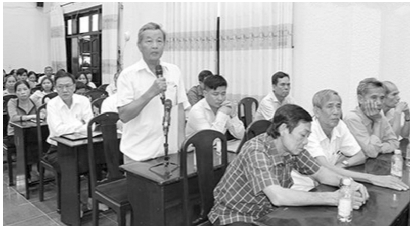
● Cử tri huyện Châu Thành A, Hậu Giang có nhiều kiến nghị hay với Đoàn đại biểu Quốc hội.

Ngày 8/5, thực hiện chương trình tiếp xúc cử tri trước Kỳ họp thứ 7, Quốc hội khóa XV, các đại biểu Quốc hội đã ghi nhận, trao đổi với các cử tri về nhiều vấn đề quốc kế, dân sinh.