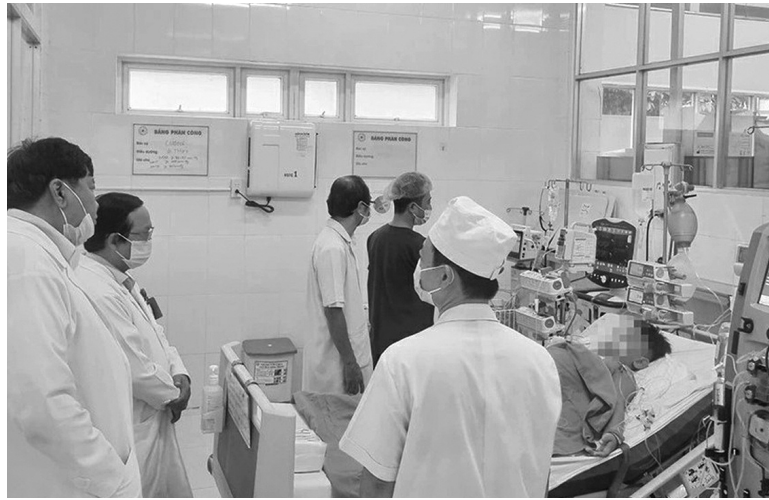
● Theo dõi sức khỏe bệnh nhân nhập viện sau vụ ngộ độc thực phẩm.

Trước đó, ngày 1/5, sau khi ăn bánh mì tại tiệm bánh mì Băng, đường Trần Quang Diệu,