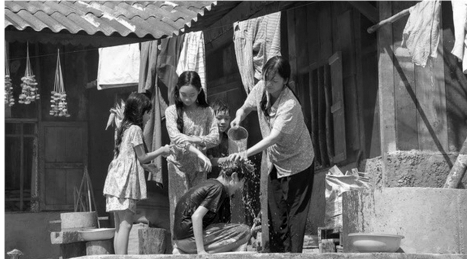
● Một cảnh trong phim “Một điều ước”. (Ảnh minh họa.)

Trên một số diễn đàn điện ảnh, nhiều khán giả bình luận rằng, khi họ đã “chán ngán” với các “drama”, những tình huống kịch tính khiên cưỡng, mặt tối xấu xí của xã hội nhan nhản trên điện ảnh, truyền hình, phim ngắn mạng, thì những bộ phim như thế này thực sự cần thiết để xoa dịu